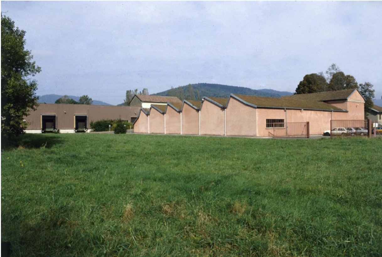
Atelier de fabrication (?) vu de trois quarts arrière.