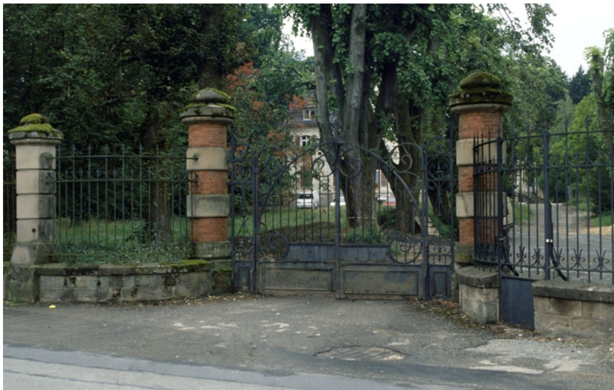
Entrée du parc du logement patronal (rue des Fougerets).