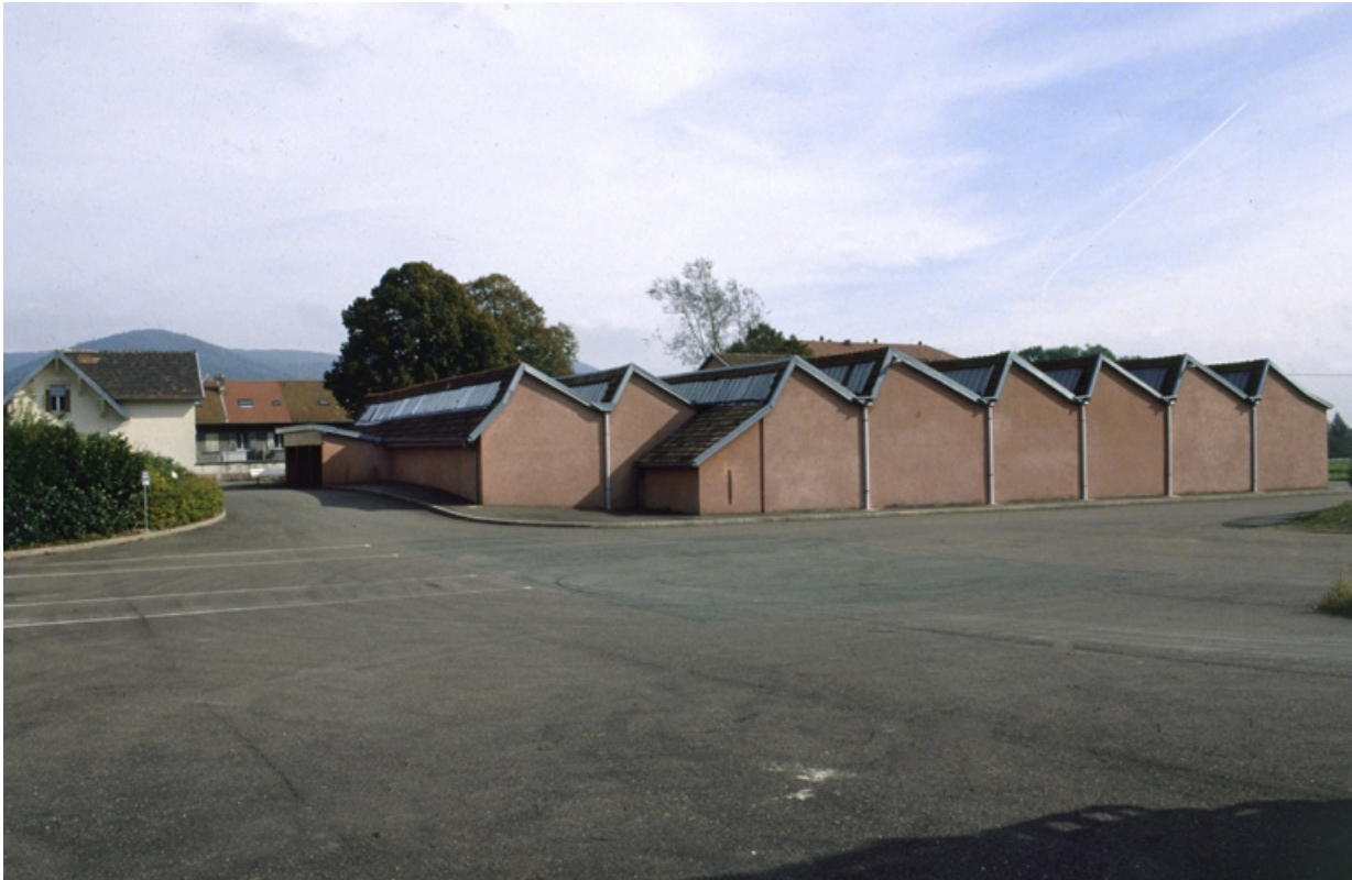
Atelier de fabrication (?) depuis l'ouest.