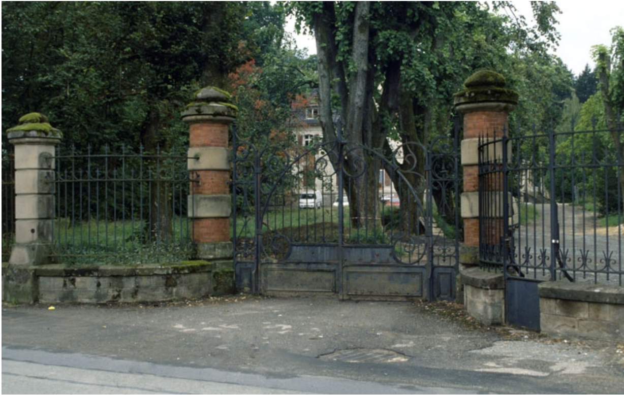
Entrée du parc du logement patronal (rue des Fougerets).