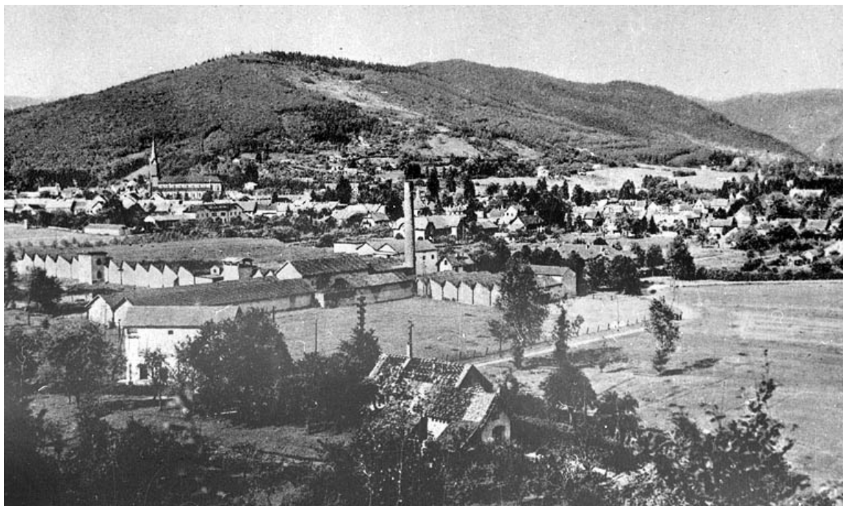
Giromagny. (Territoire de Belfort) - Vue générale.