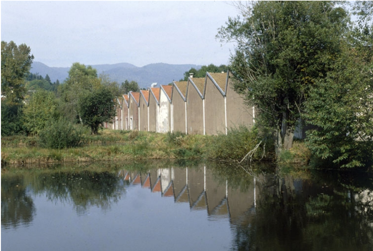
Etang et murs-pignons de l'atelier de filature.