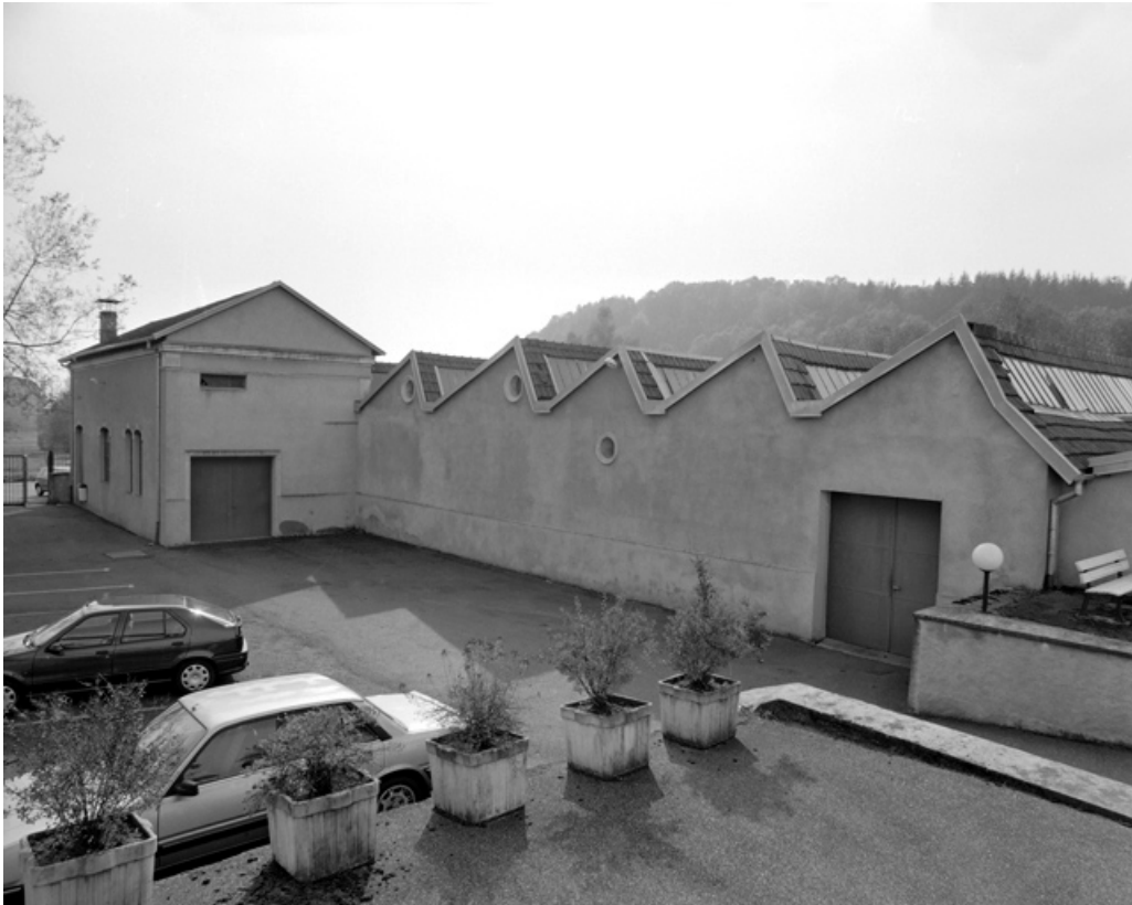
Atelier de fabrication (?) depuis les bureaux.