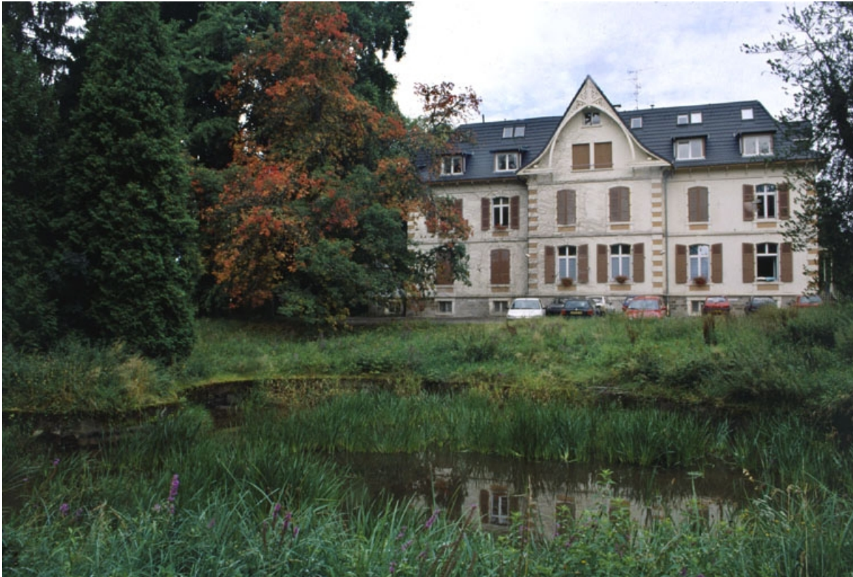
Vue d'ensemble du logement patronal.