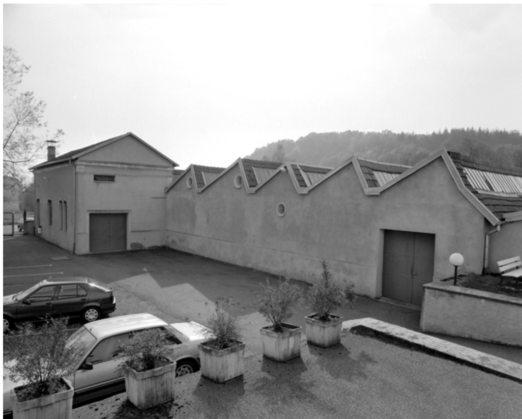
Atelier de fabrication (?) depuis les bureaux.