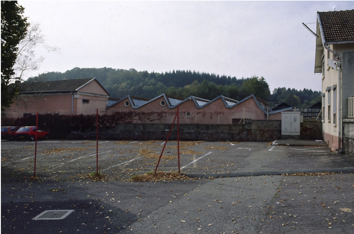
Atelier de fabrication (?) depuis l'est.