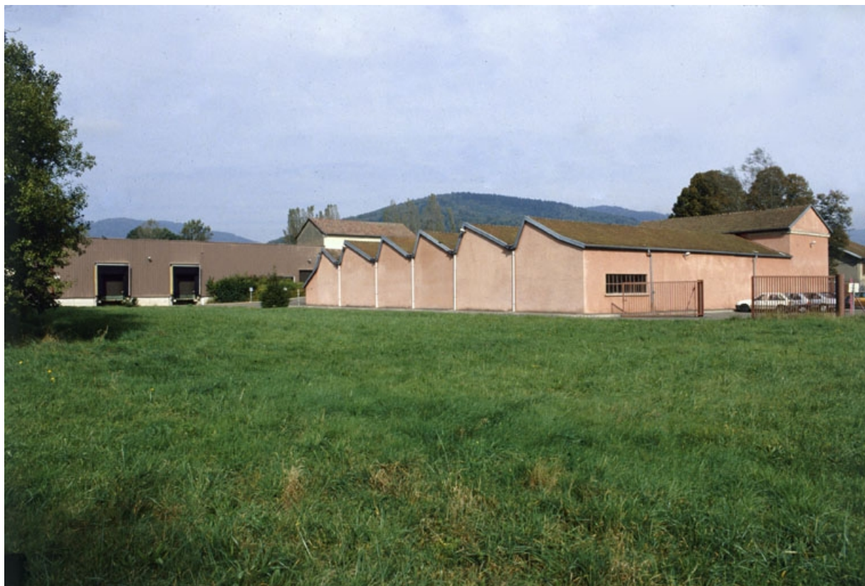
Atelier de fabrication (?) vu de trois quarts arrière.