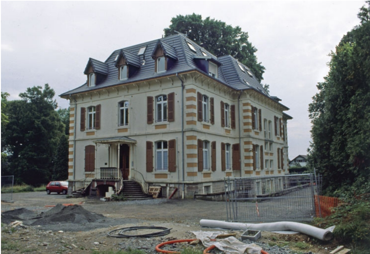
Logement patronal depuis le nord-ouest.