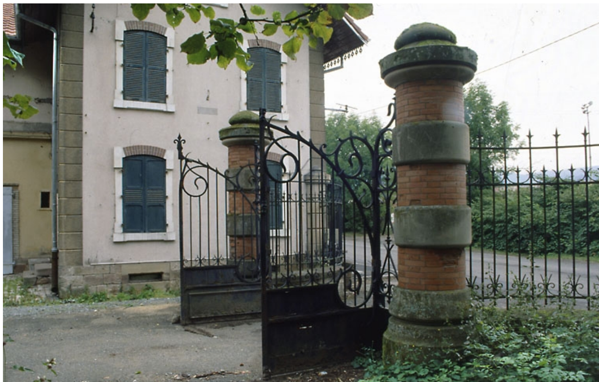
Conciergerie et grille du parc du logement patronal (rue des Fougerets).