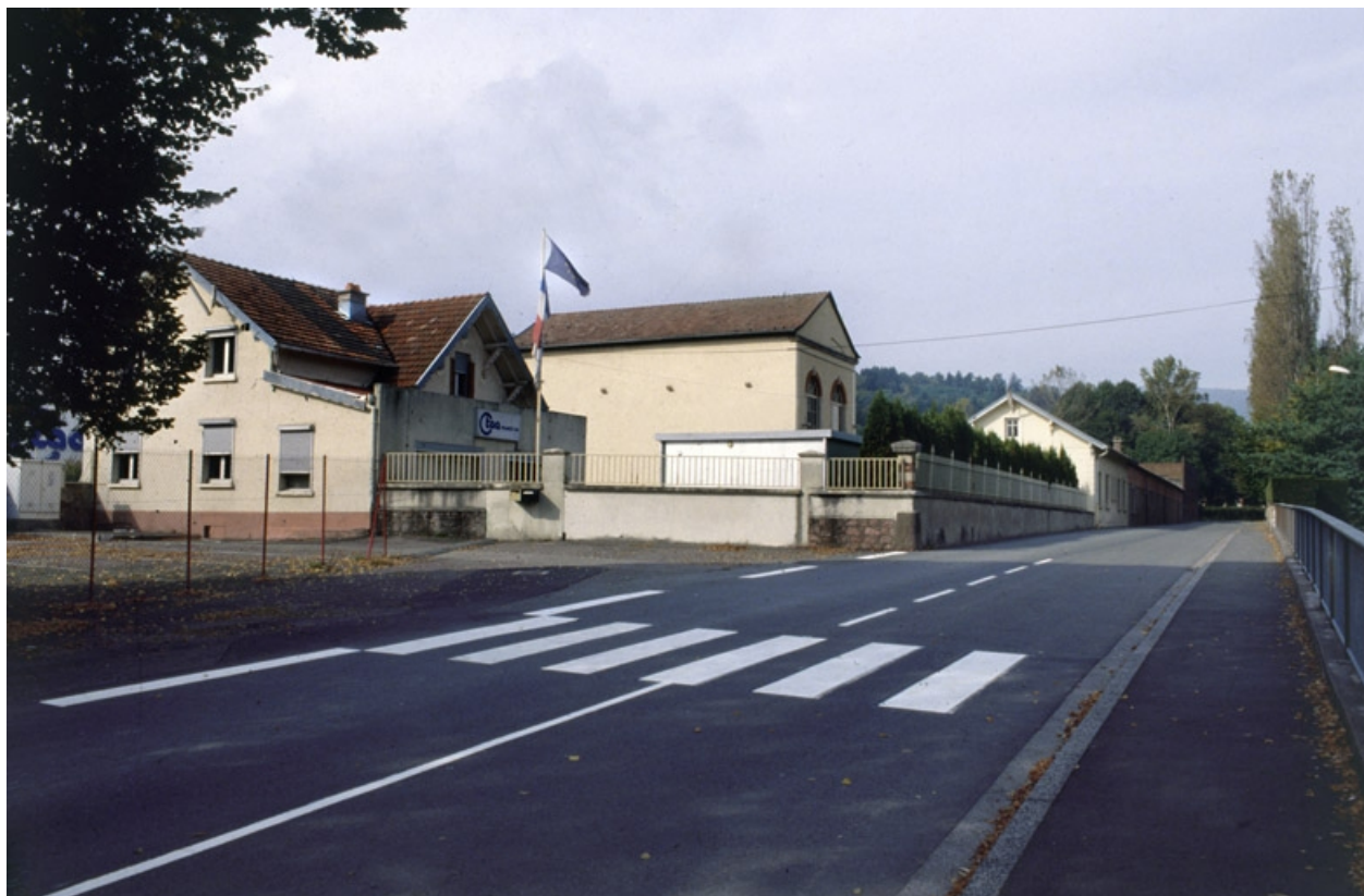
Vue d'ensemble depuis la rue des Prés-Heyd.