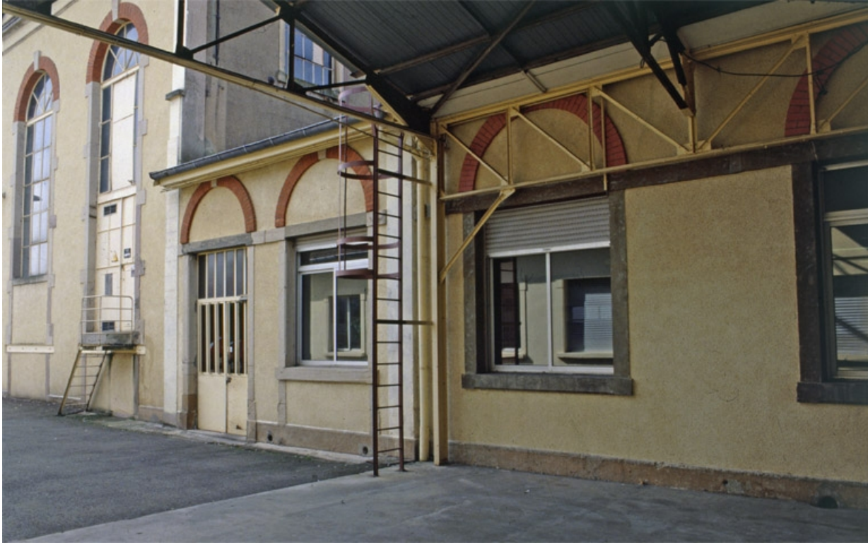
Détail de baies de la salle des machines.