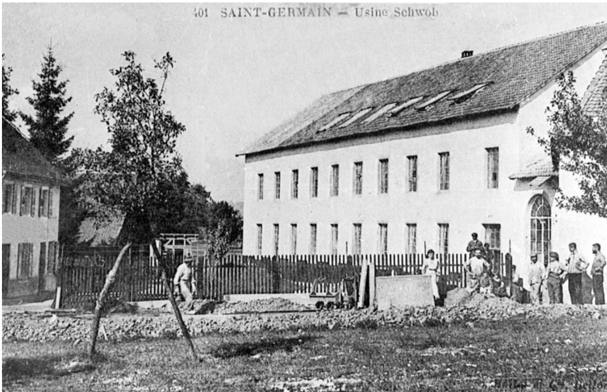
Saint-Germain - Usine Schwob.

90, Saint-Germain-le-Châtelet rue du Moulin