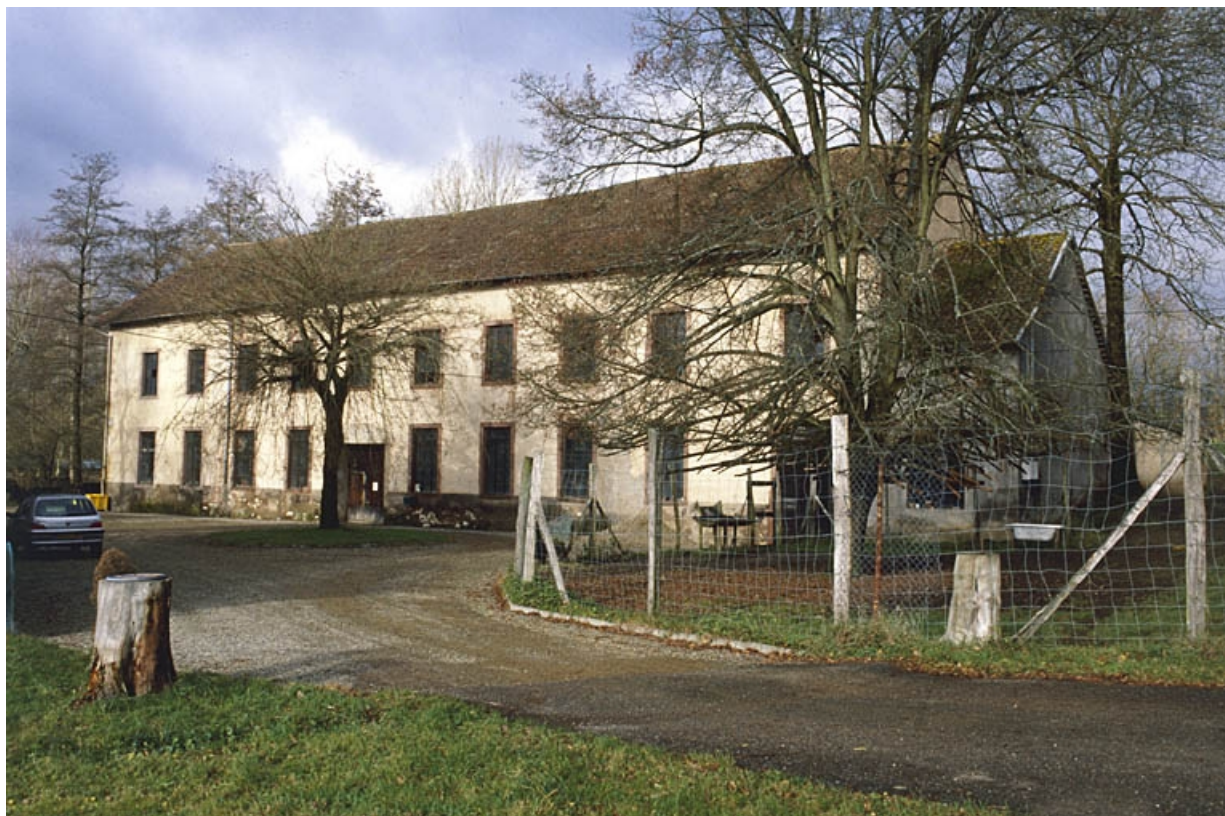
Façade antérieure de l'atelier de fabrication.

90, Saint-Germain-le-Châtelet rue du Moulin