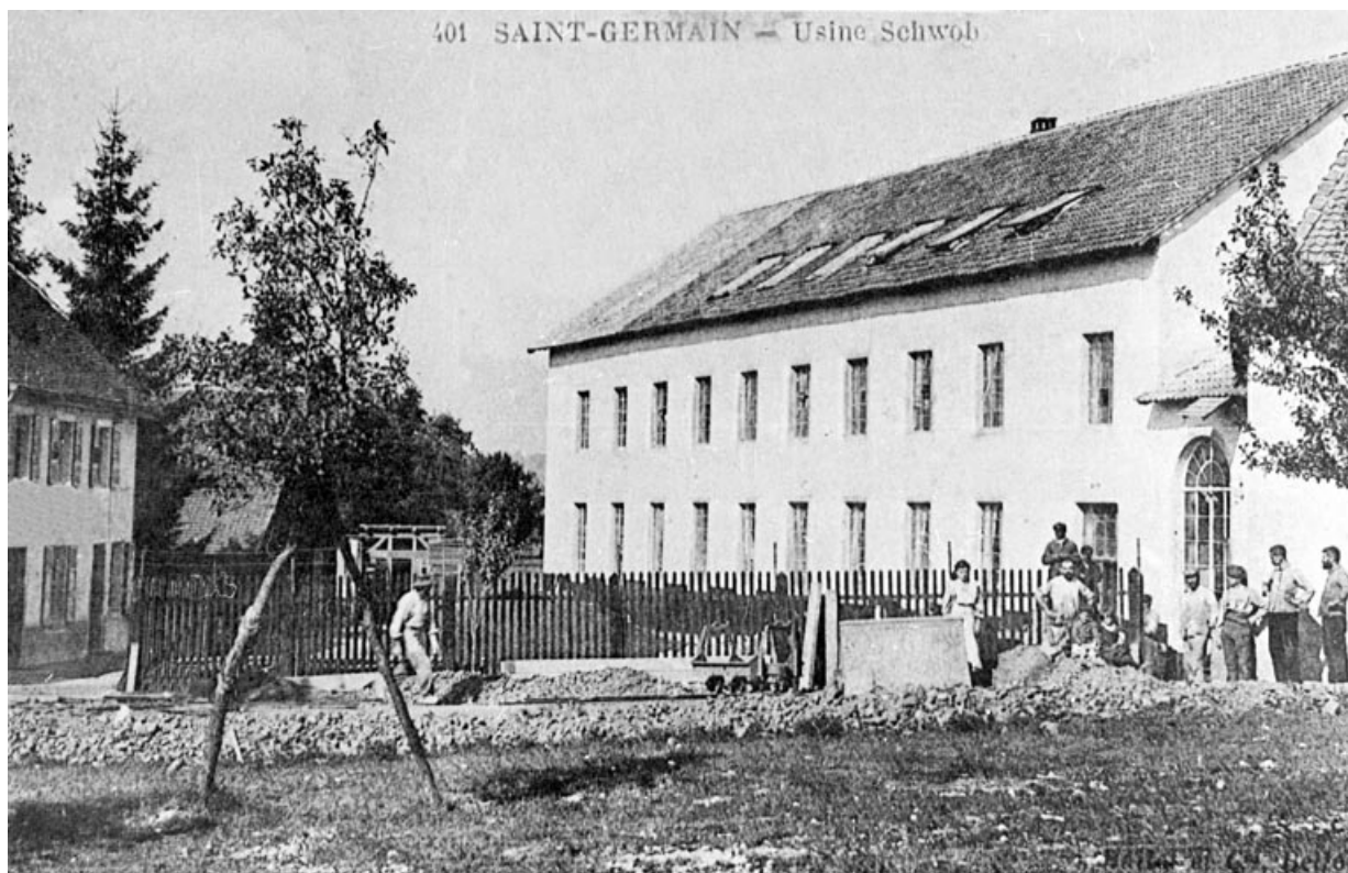
Saint-Germain - Usine Schwob.

90, Saint-Germain-le-Châtelet rue du Moulin