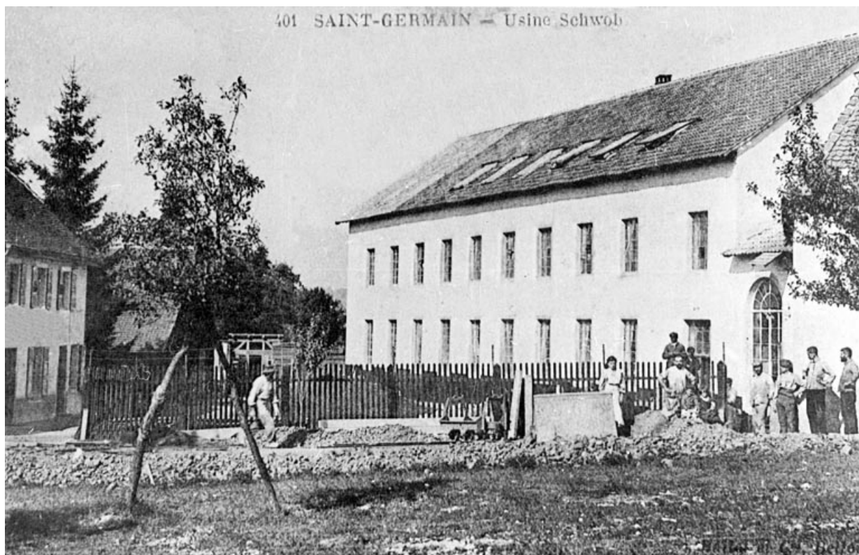
Saint-Germain - Usine Schwob.

90, Saint-Germain-le-Châtelet rue du Moulin