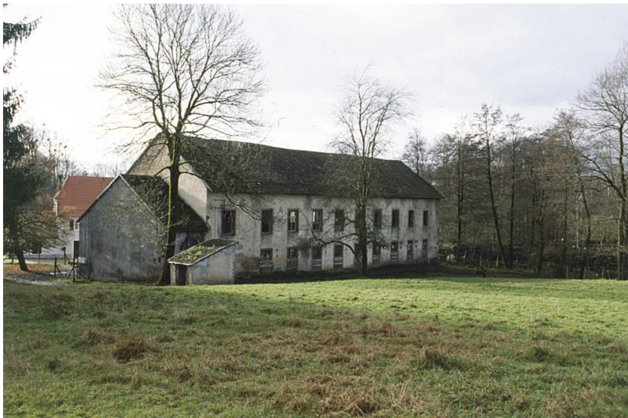
Vue de trois quarts arrière de l'atelier de fabrication.

90, Saint-Germain-le-Châtelet rue du Moulin