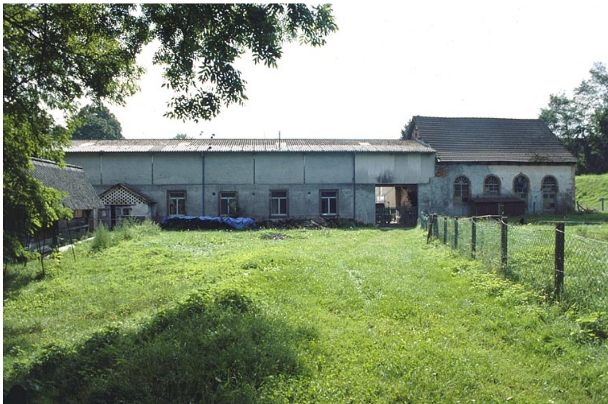
Façade postérieure de l'atelier de fabrication et salle des machines.