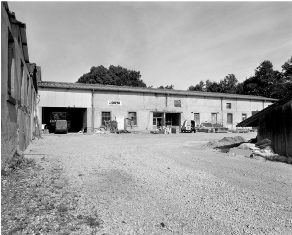
Atelier de fabrication ouest.