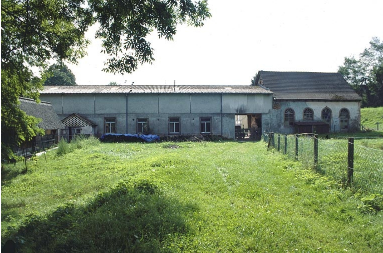
Façade postérieure de l'atelier de fabrication et salle des machines. 90, Anjoutey rue du Moulin