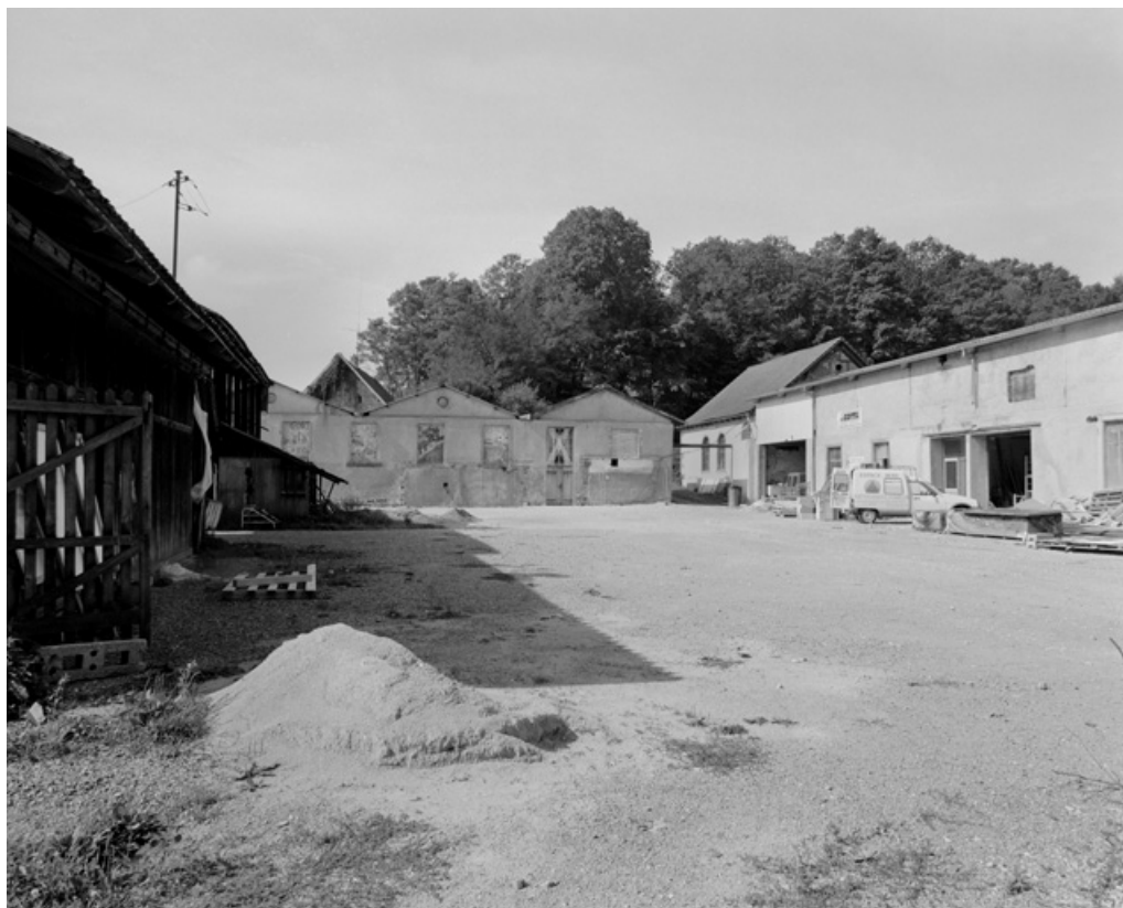
Atelier de fabrication et salle des machines depuis le nord.