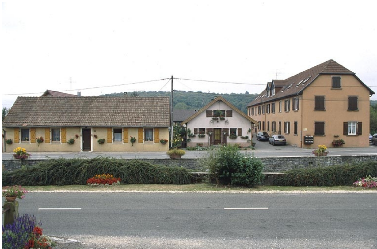
Logements ouvriers depuis le nord.