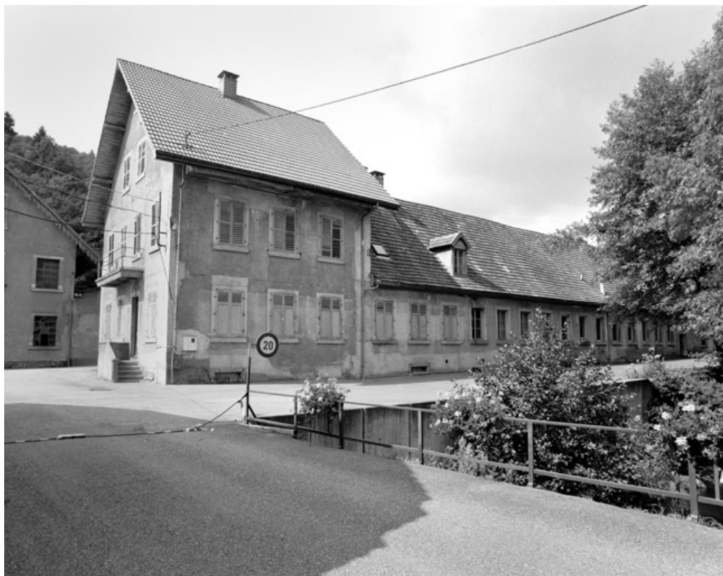
Bureaux et conciergerie depuis l'entrée.