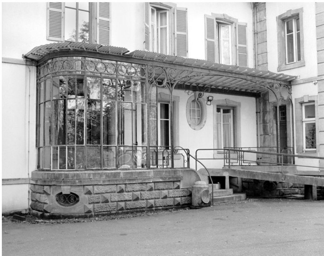
Détail de la véranda et de la marquise du logement patronal.