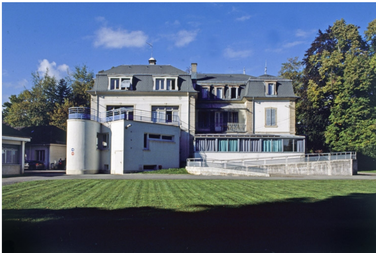
Façade postérieure du logement patronal.