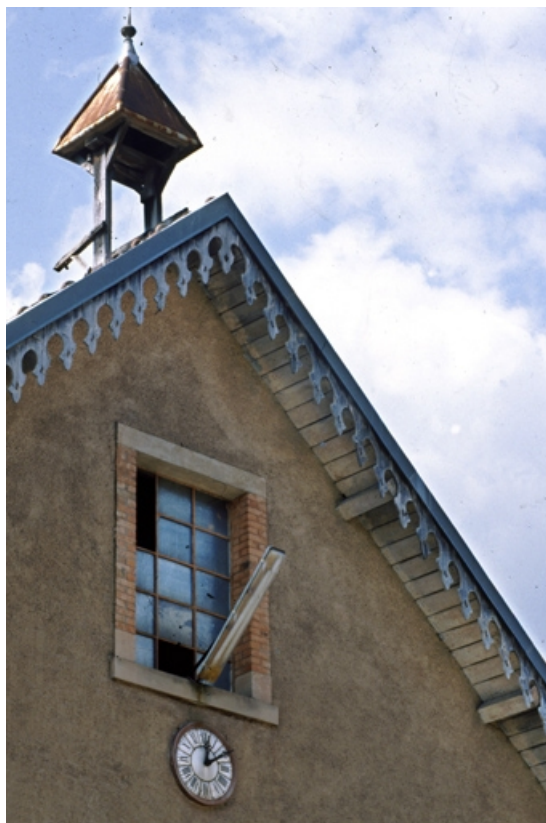
Détail du pignon du bâtiment des bureaux et du laboratoire. 90, Étueffont Grande Rue 28, 37