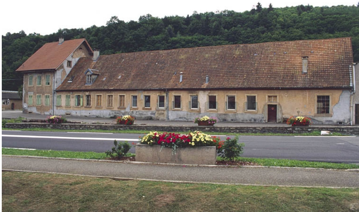
Vue d'ensemble du tissage depuis l'est.