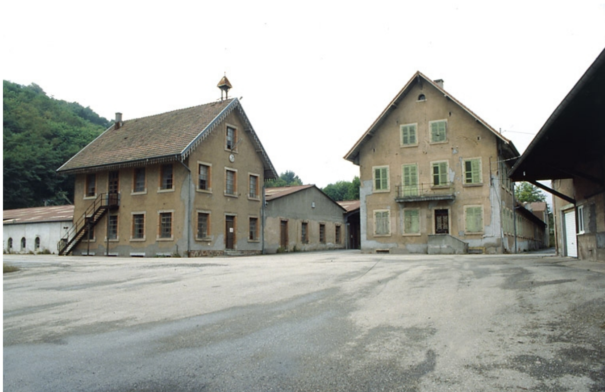
Laboratoire, bureaux et conciergerie depuis le sud.