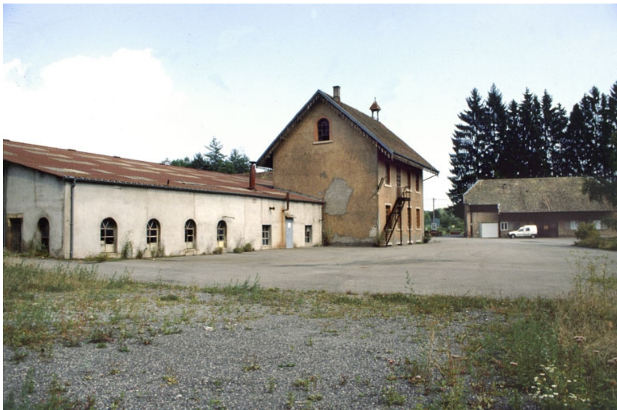
Atelier de forge et bâtiment du laboratoire et des bureaux.