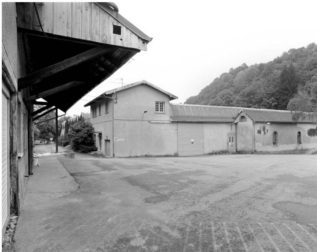
Bâtiments de la filature depuis le nord.