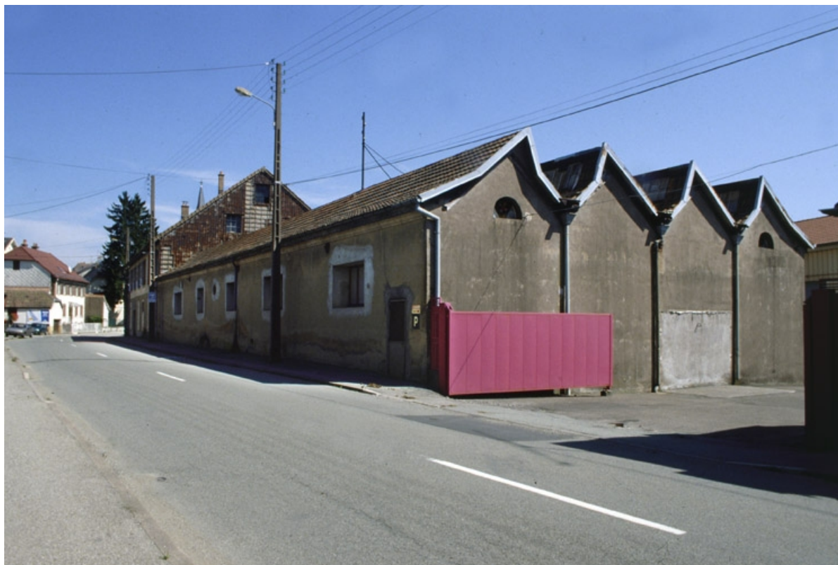
Atelier de fabrication longeant la rue d'Etueffont. 90, Rougemont-le-Château, 7 à 11 rue d' Etueffont