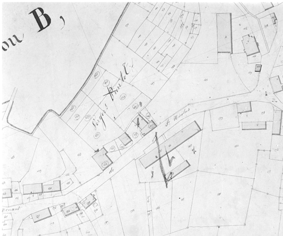
Rougemont-le-Château. Section D dite le Village [plan-masse et de situation extrait du plan cadastral napoléonien]. 90, Rougemont-le-Château, 7 à 11 rue d' Etueffont