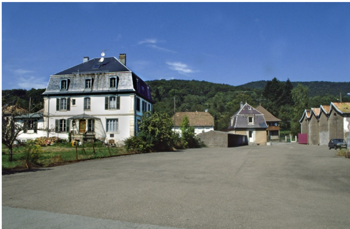
Logement patronal, conciergerie et pignons d'un atelier de fabrication depuis le sud. 90, Rougemont-le-Château, 7 à 11 rue d' Etueffont