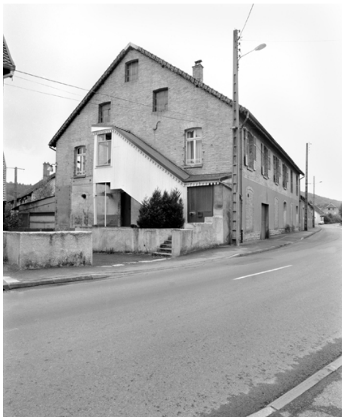
Bâtiment abritant un entrepôt industriel (au rez-de-chaussée), un logement et des bureaux (à l'étage). 90, Rougemont-le-Château, 7 à 11 rue d' Etueffont