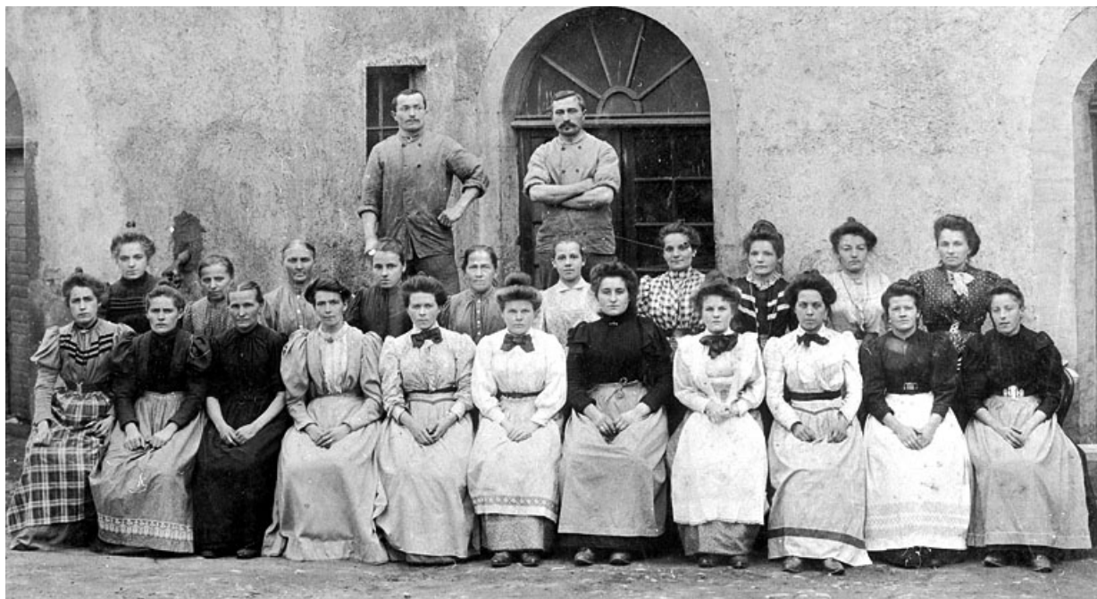
Tissage mécanique Winckler : le personnel.

90, Rougemont-le-Château, 7 à 11 rue d' Etueffont