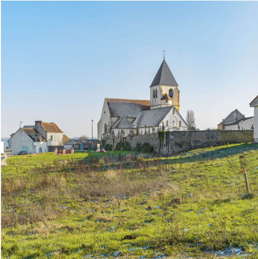
Vue d'ensemble, au cœur du village.