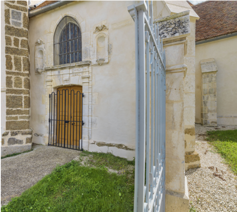
Elévation nord : jonction entre la nef et le transept.