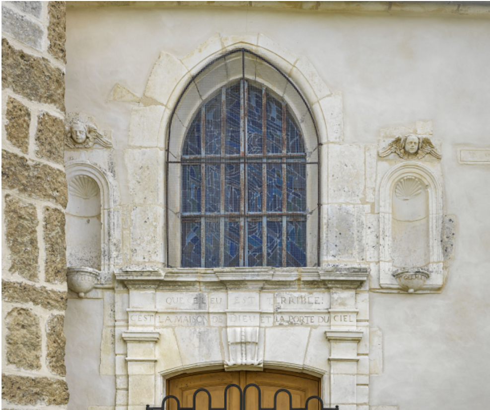
Elévation nord : détail du portail et de la baie éclairant le transept. 89, Venoy rue de l' Église