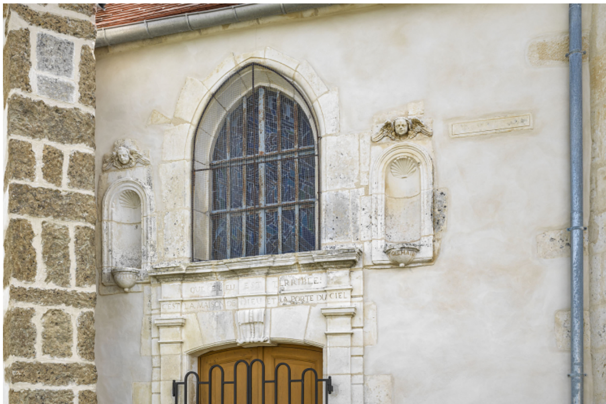
Elévation nord : détail du portail et de la baie éclairant le transept. 89, Venoy rue de l' Église