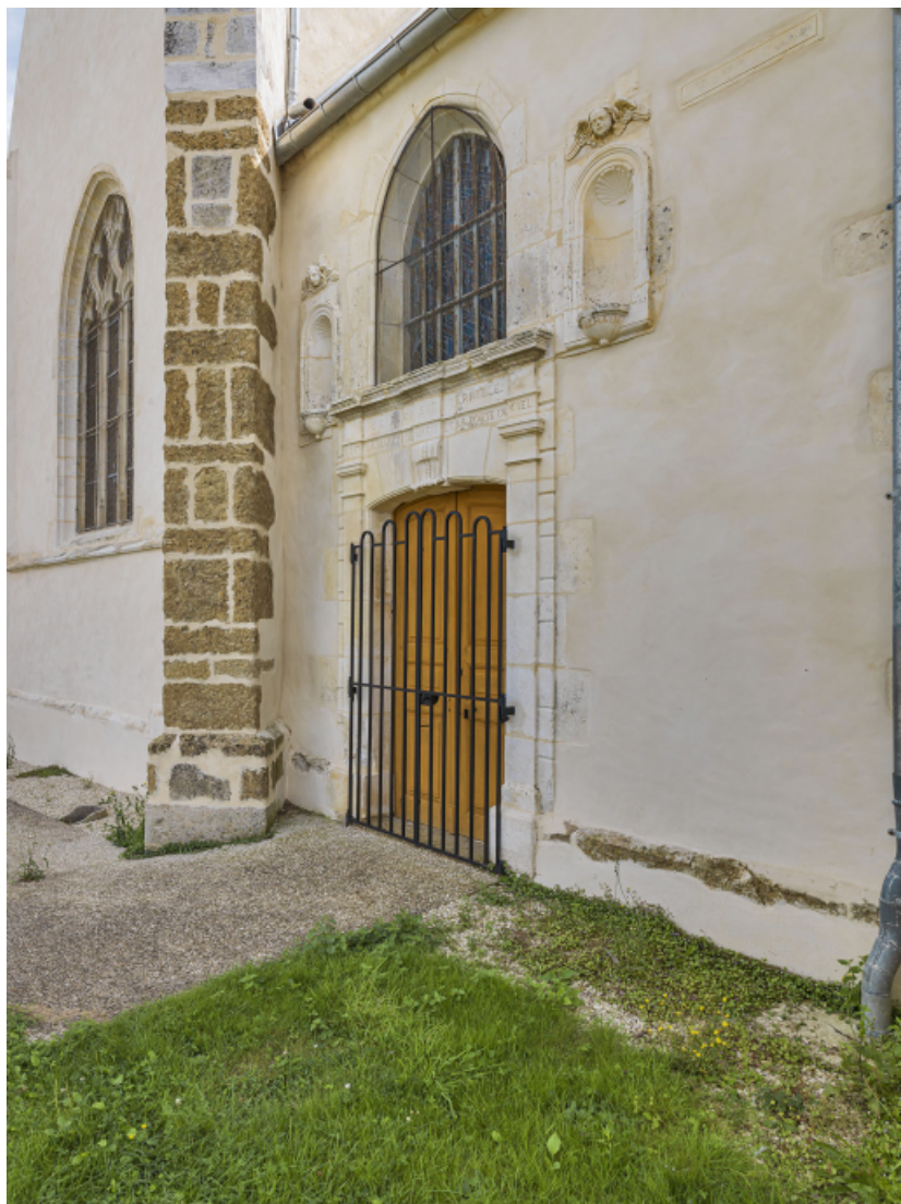
Portail d'entrée nord.