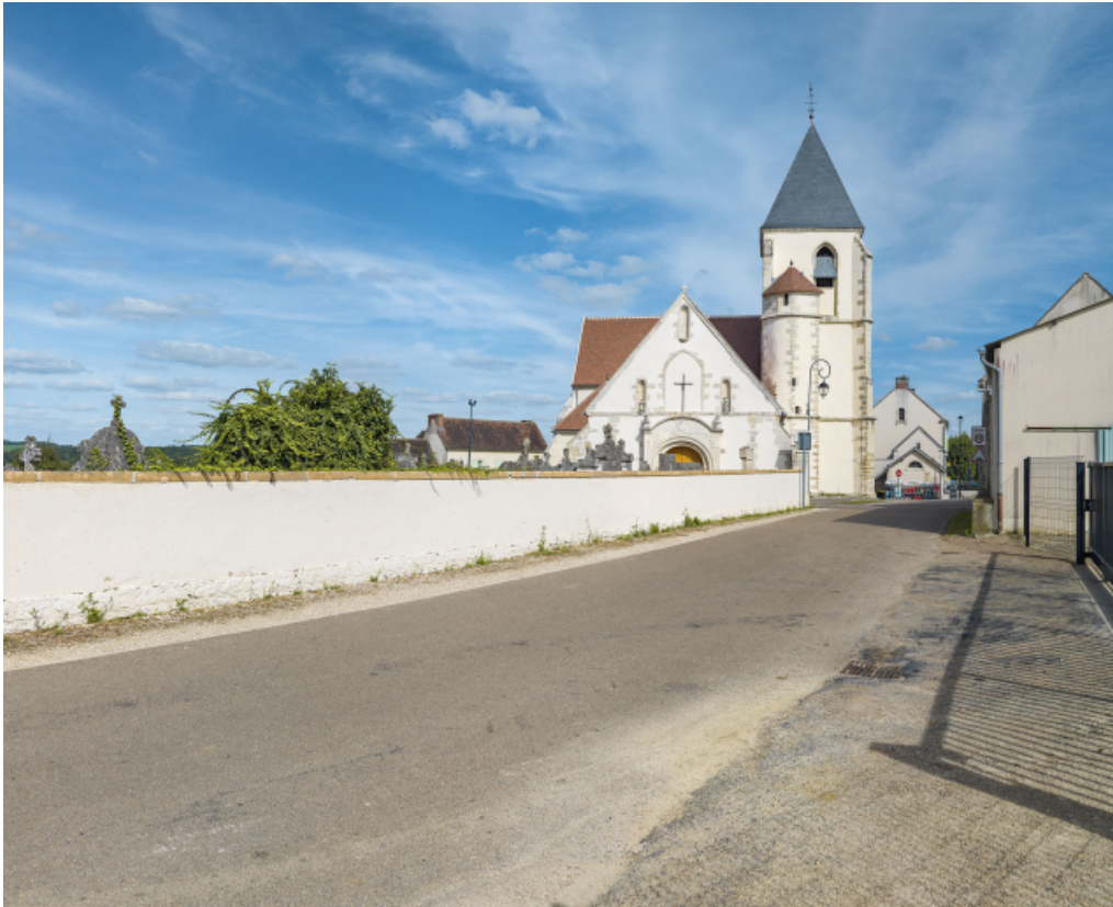
Vue d'ensemble de la façade principale et du clocher.