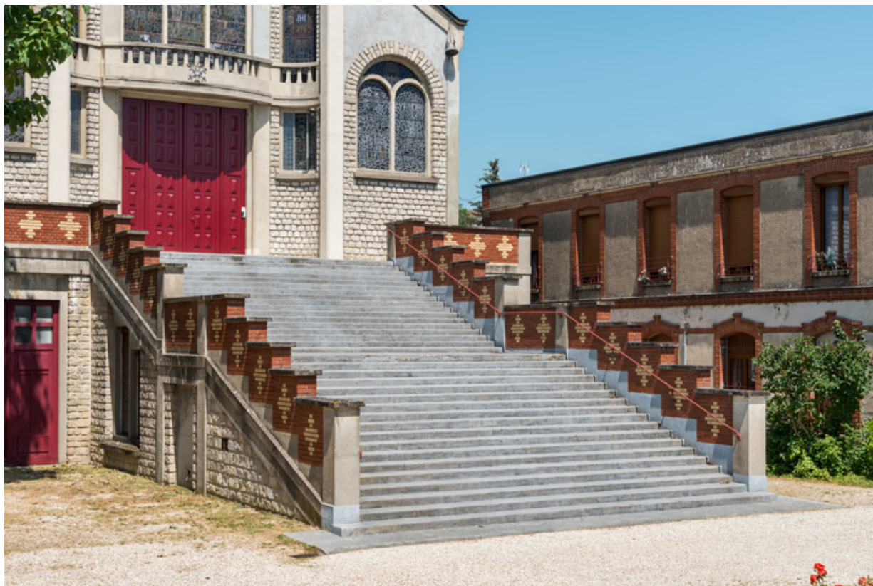
Escalier menant au parvis. Vue de trois quarts. A droite, la chapelle.

89, Migennes, 3 avenue Marcelin Berthelot