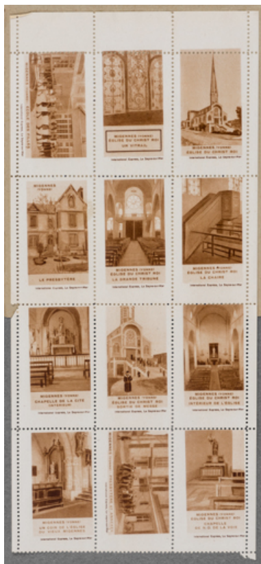
Carnet de timbres du Christ-Roi, détail. 89, Migennes, 3 avenue Marcelin Berthelot