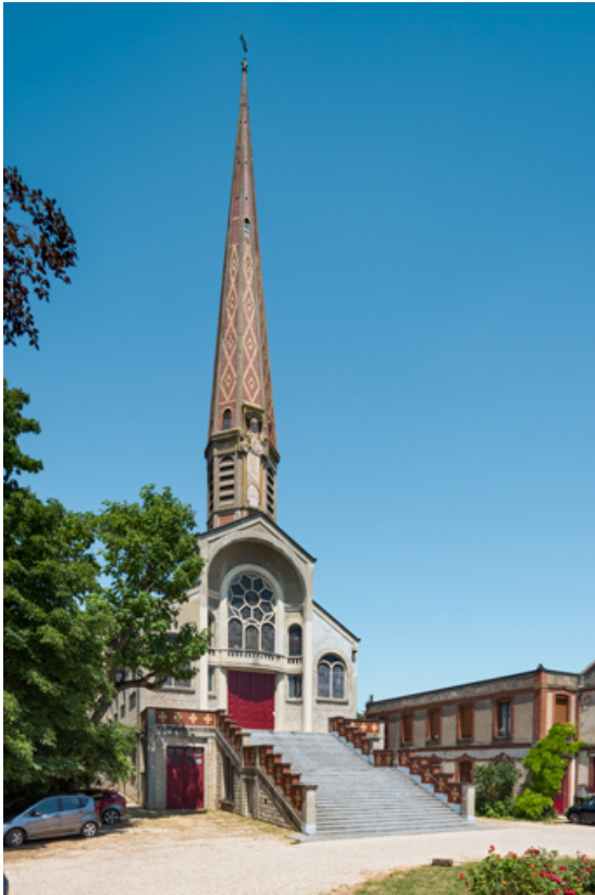
Eglise et chapelle. Vue de trois quarts.

89, Migennes, 3 avenue Marcelin Berthelot