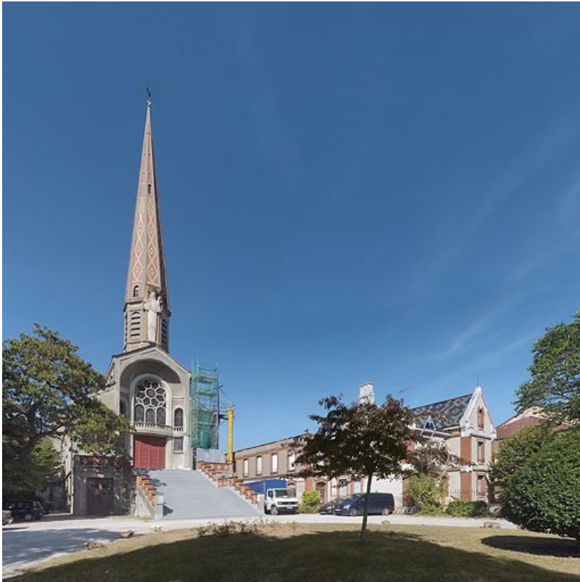
L'église du Christ-Roi et son presbytère.

89, Migennes, 3 avenue Marcelin Berthelot