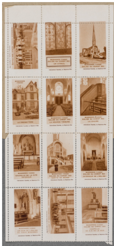
Carnet de timbres du Christ-Roi, détail. 89, Migennes, 3 avenue Marcelin Berthelot