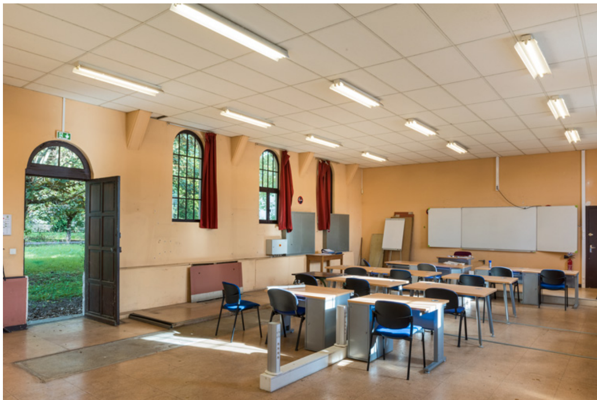
Nef de la chapelle aménagée en salle de formation. Vue de trois quarts en direction du sud-est. 89, Migennes, 16 rue Henri Surier