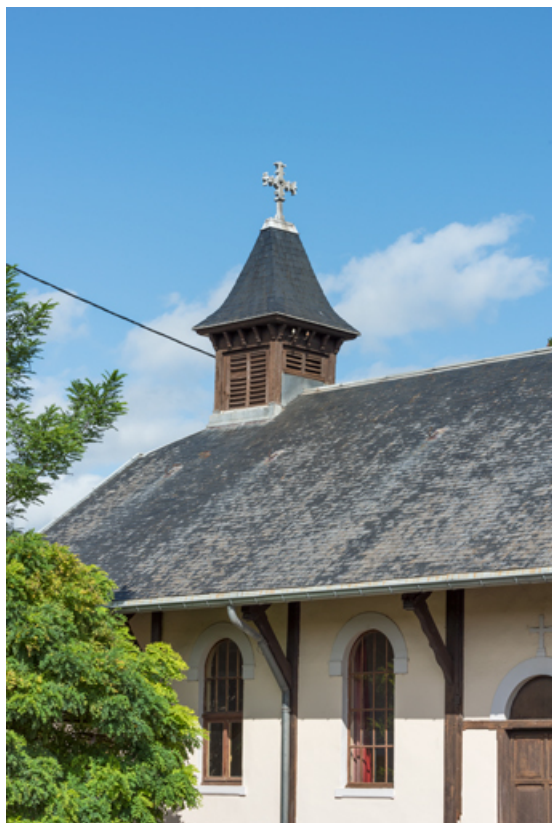
Campanile. Vue de trois quarts depuis le sud ouest. 89, Migennes, 16 rue Henri Surier