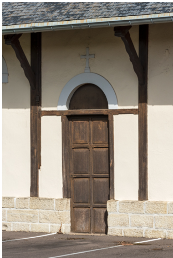
Porte de la façade ouest. Vue de trois quarts.