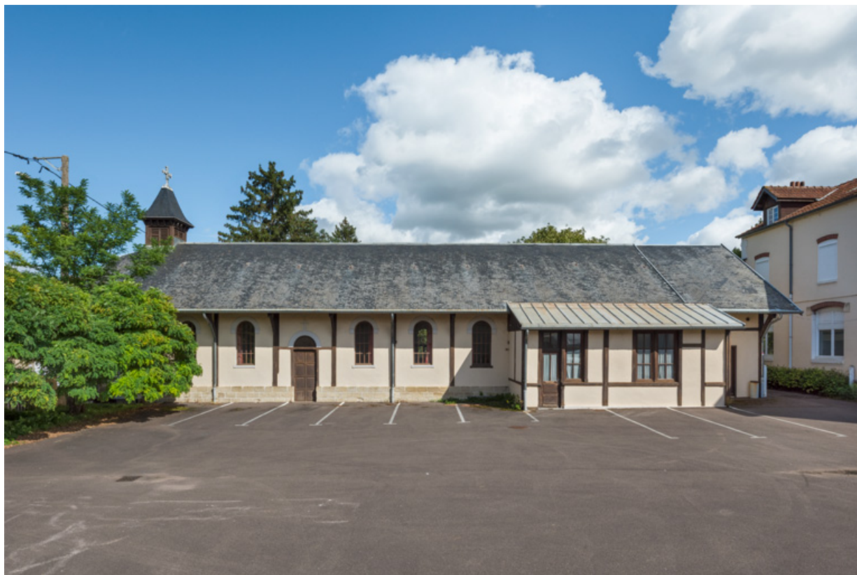
Façade ouest. Vue d'ensemble.