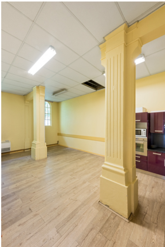
Ancien chœur, devenu cuisine. Vue de trois quarts en direction du sud-est. 89, Migennes, 16 rue Henri Surier