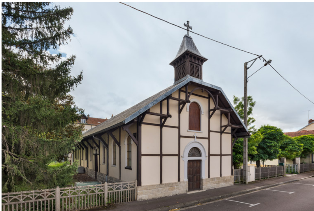
Façades nord (antérieure) et est. Vue de trois quarts.