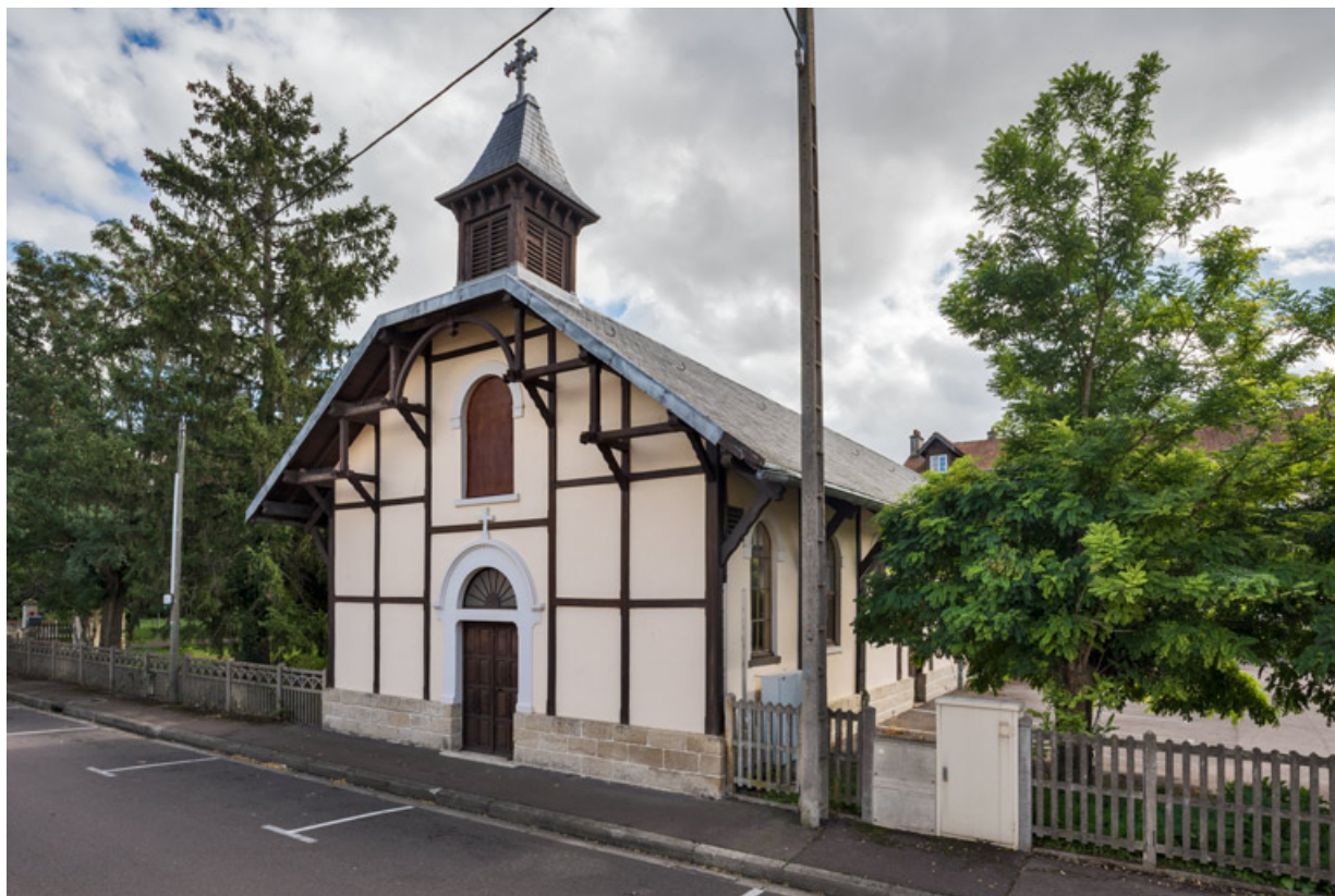
Façade antérieure. Vue de trois quarts.