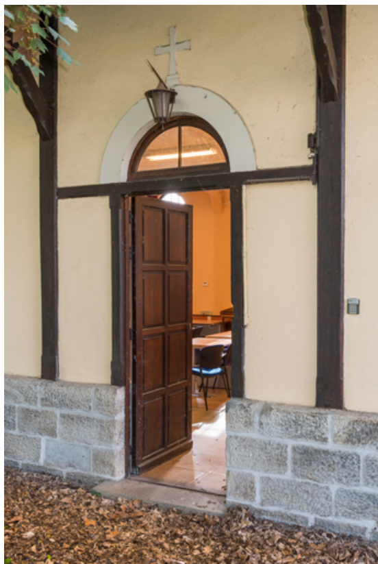
Entrée de la façade est. Vue de trois quarts.