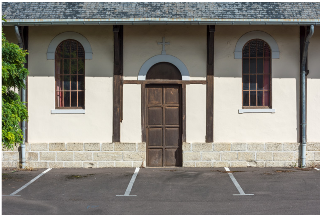
Façade ouest. Vue de trois travées.