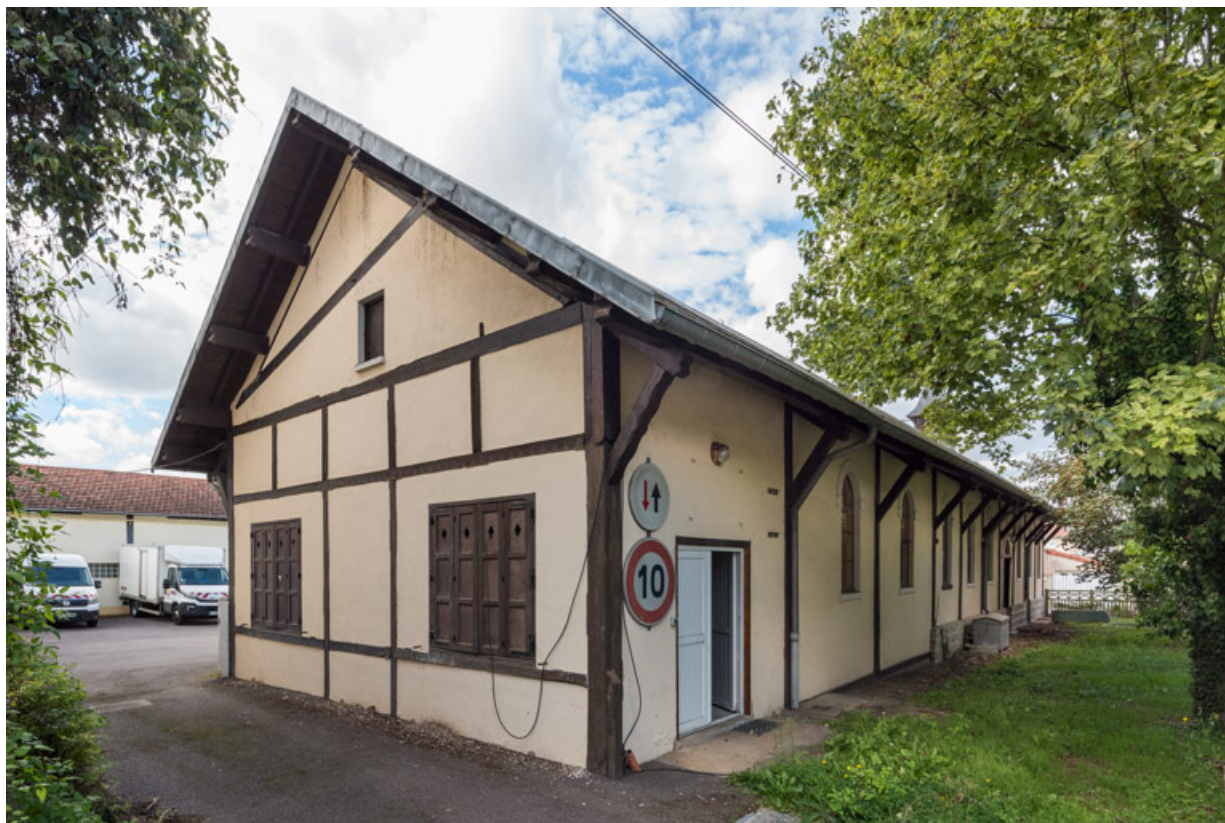
Façades sud et est. Vue de trois quarts.