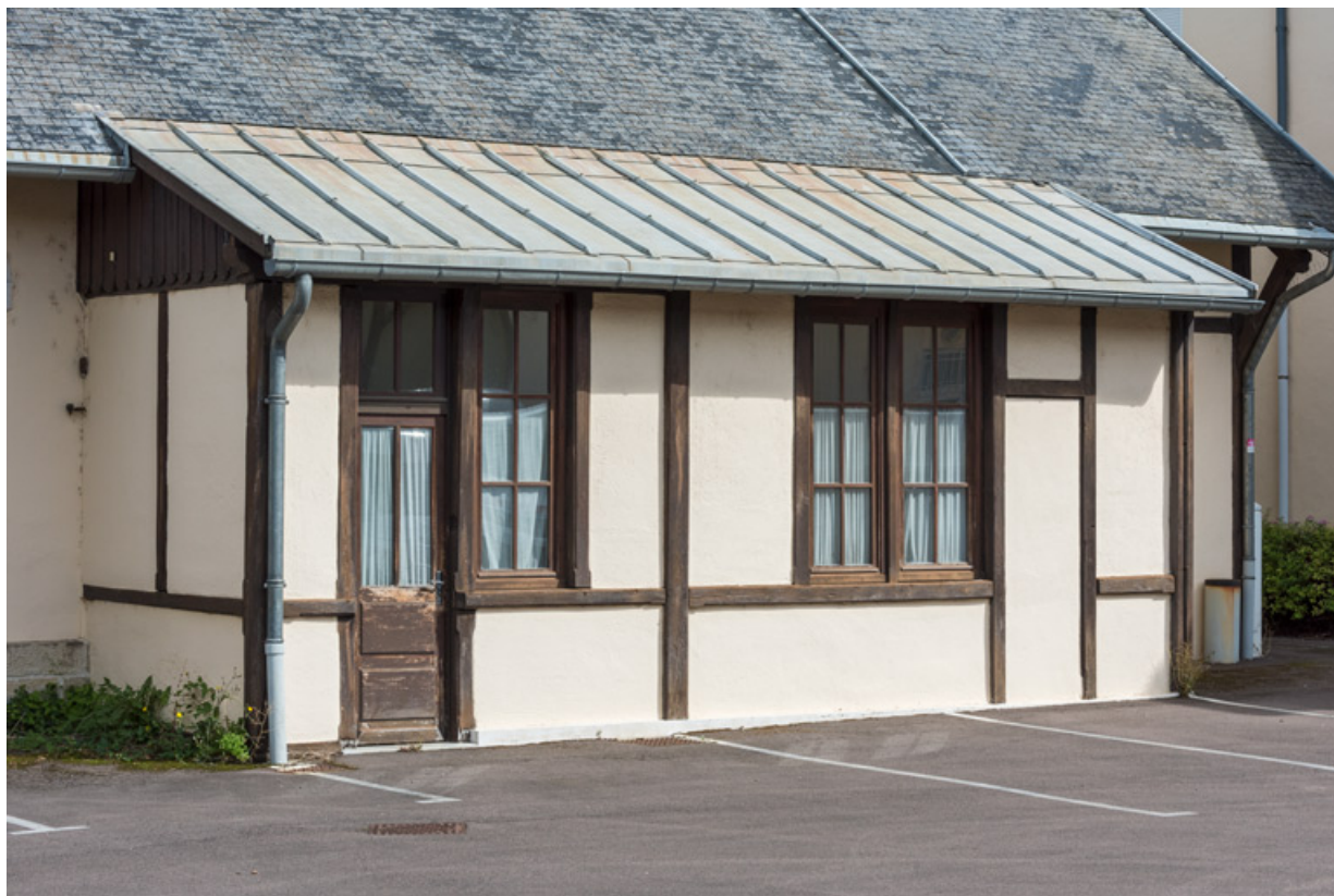
Extension en apprentis (sacristie ?). Vue de trois quarts.