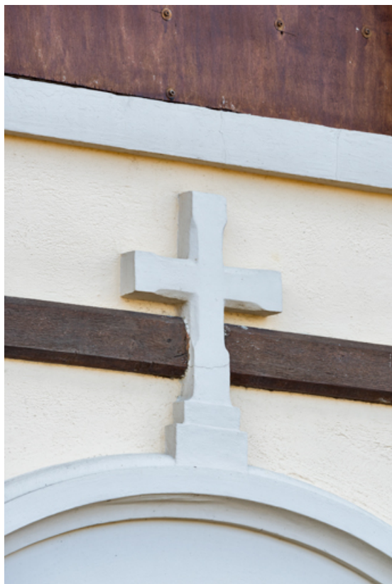
Détail de la croix surmontant la porte de la façade antérieure.