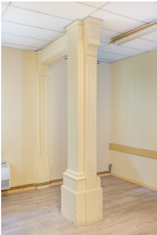
Pilier délimitant l'espace du chœur. Détail.