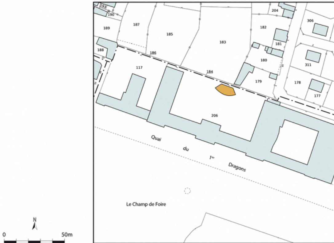
Plan-masse et de situation. Extrait du plan cadastral, 2022, AZ, 1/1 000.