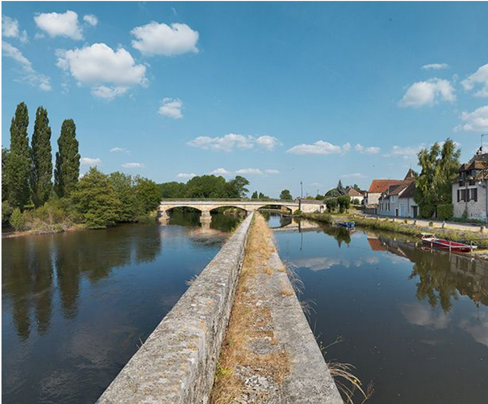
Pont d'Accolay et village sur la droite, vus depuis la digue. A gauche, la Cure. 89, Accolay, lieudit : bief 02 de l'embranchement de Vermenton