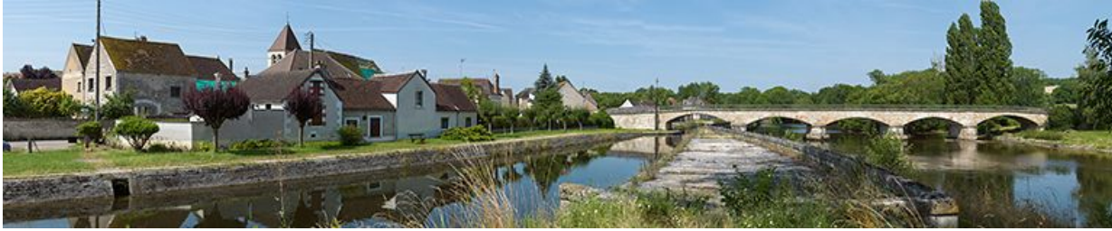
Pont d'Accolay et village sur la gauche, vus depuis la digue. A droite, la Cure. 89, Accolay, lieudit : bief 71 du versant Yonne

N° de l'illustration : 20138900075NUC4AQ