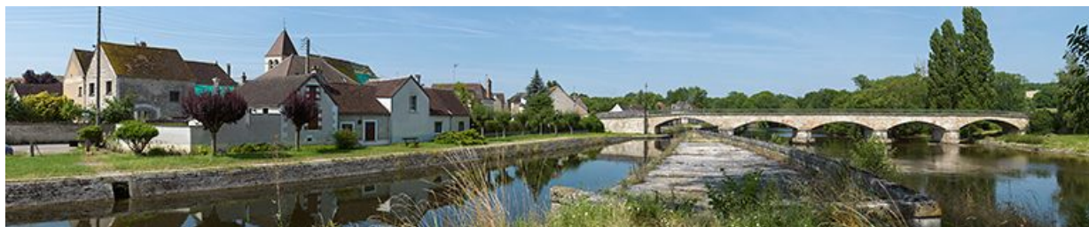
Pont d'Accolay et village sur la gauche, vus depuis la digue. A droite, la Cure.

89, Accolay, lieudit : bief 71 du versant Yonne