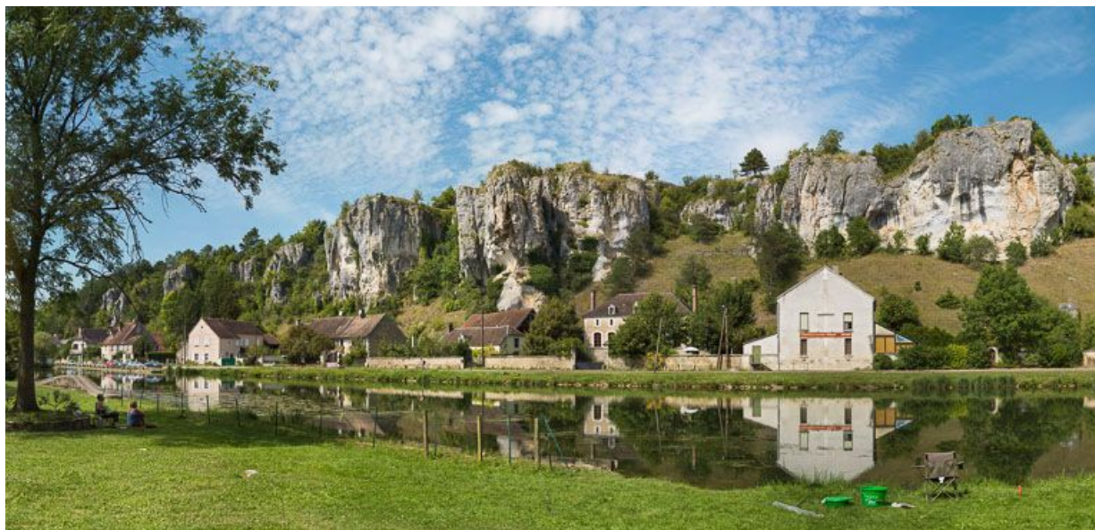
Les rochers du Saussois et le canal.

N° de l'illustration : 20138900119NUC4AQ