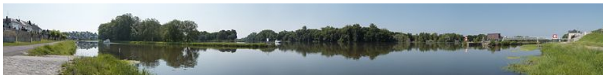
Panorama du confluent entre le canal du Nivernais, la Loire et l'Aron à Saint-Léger-des-Vignes.

N° de l'illustration : 20135800357NUC4AQ