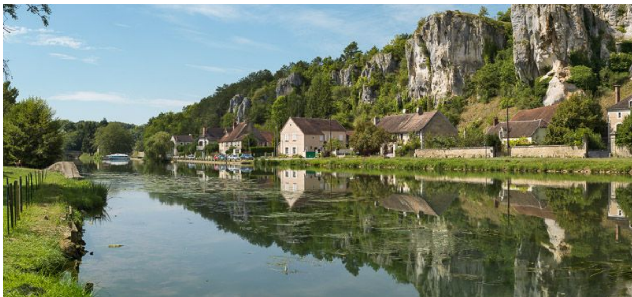
Les rochers du Saussois et le canal.

N° de l'illustration : 20138900120NUC4AQ