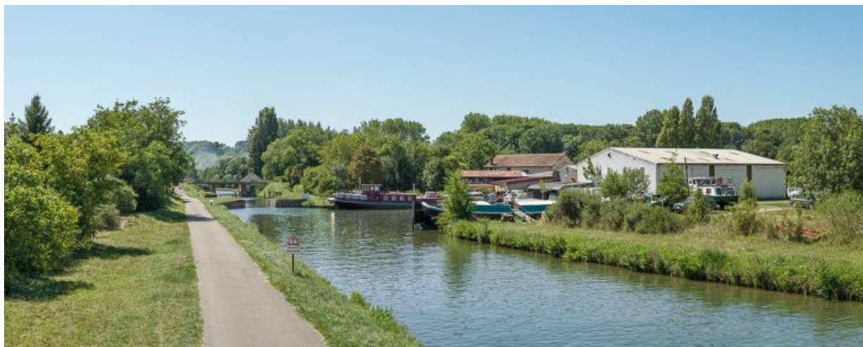
Le port avec les hangars et l'écluse de garde.

N° de l'illustration : 20138900146NUC4AQ