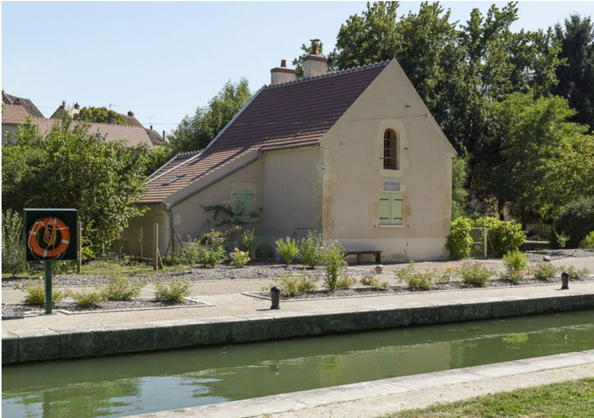
Vue de 3/4 de la maison éclusière et de l'annexe à gauche.

89, Mailly-la-Ville, lieudit : bief 63 du versant Seine