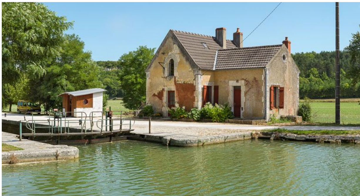
Vue générale du site d'écluse, avec la maison de 3/4.

89, Merry-sur-Yonne, lieudit : bief 60 du versant Seine