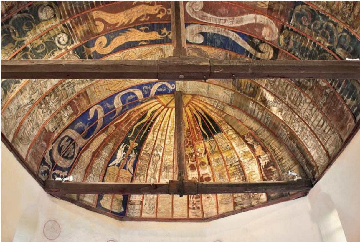
Vue de la voûte lambrissée et de son décor peint.