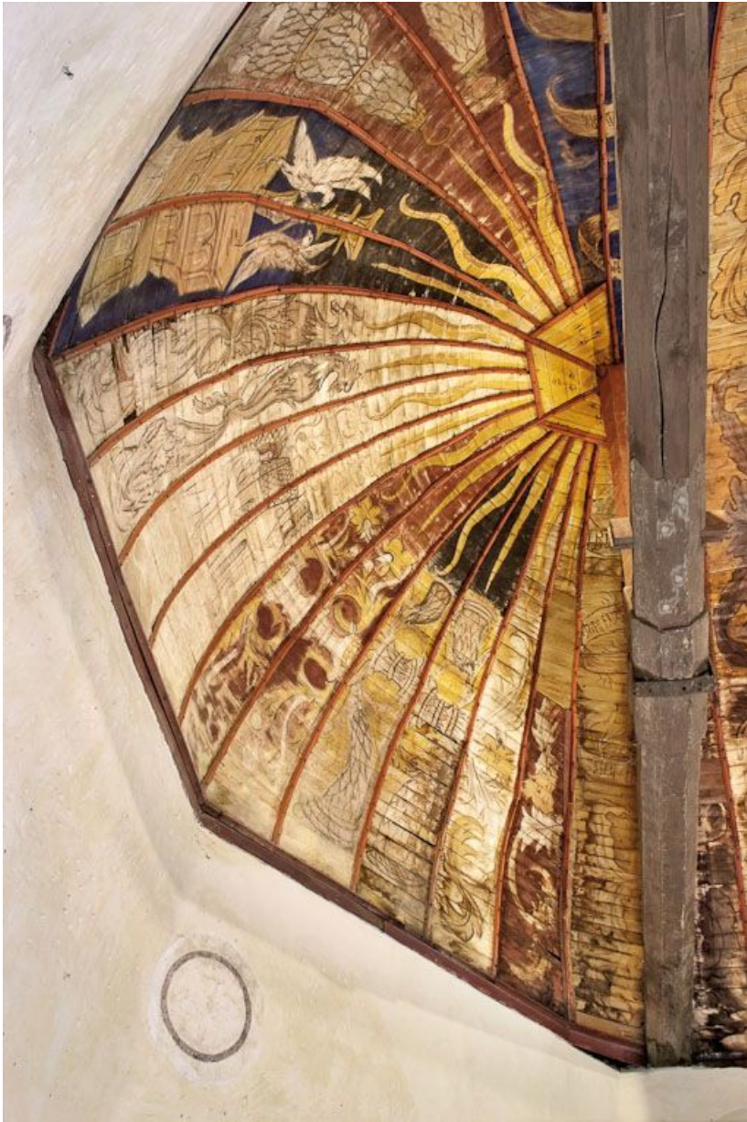
Détail de la voûte lambrissée et de ses décors peints.