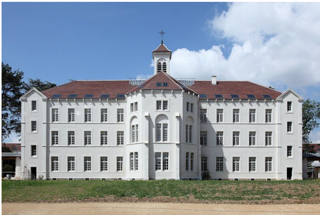
Bâtiment central, façade postérieure.

89, Auxerre, 2-4 avenue Charles-de-Gaulle