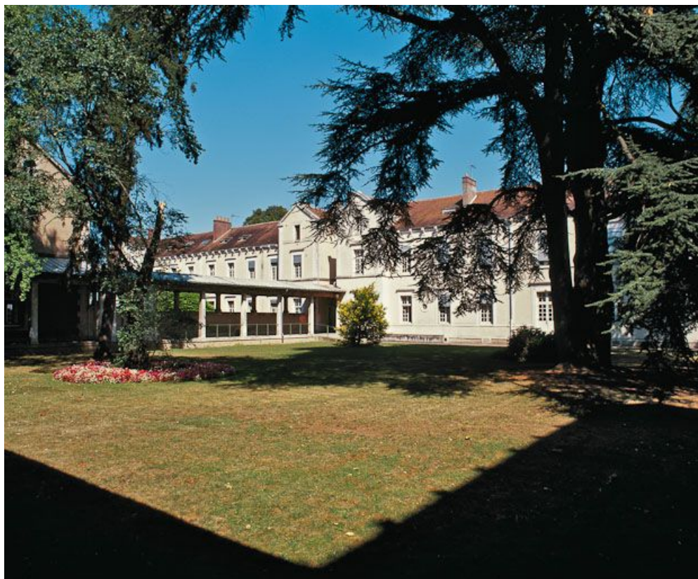
Bâtiment central, partie gauche de la façade en 2001.

89, Auxerre, 2-4 avenue Charles-de-Gaulle