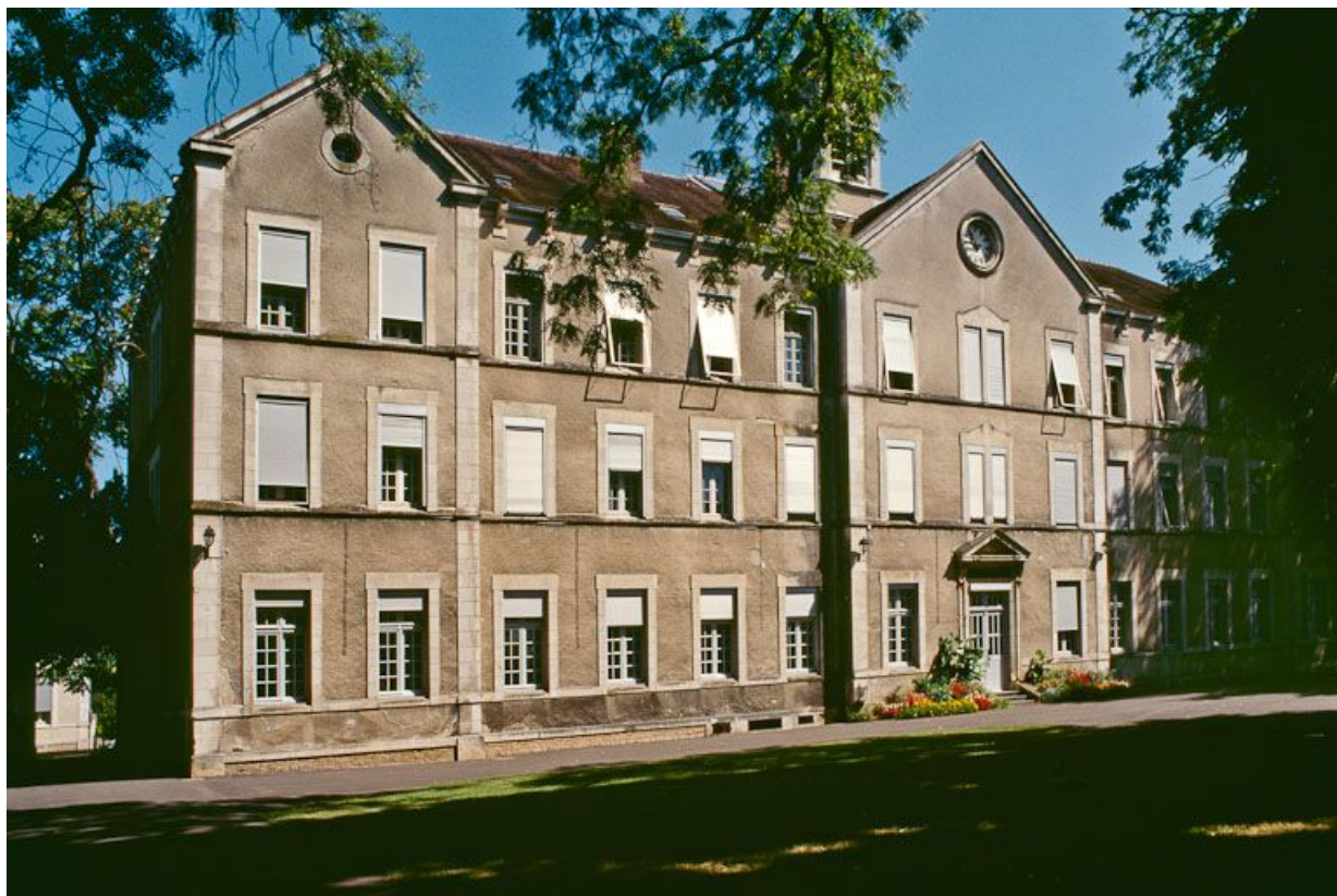
Bâtiment central, partie gauche de la façade.

89, Auxerre, 2-4 avenue Charles-de-Gaulle