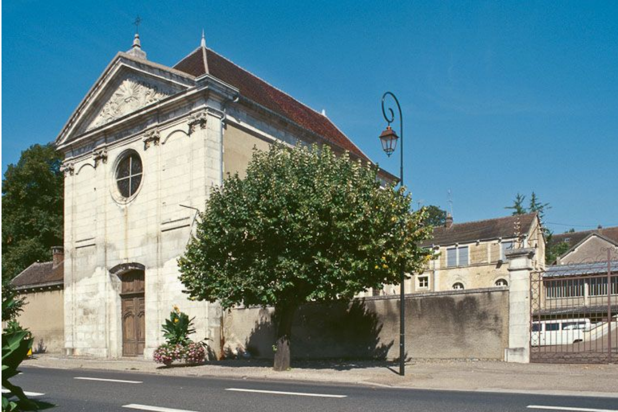
Chapelle, vue de trois-quarts.

89, Auxerre, 2-4 avenue Charles-de-Gaulle