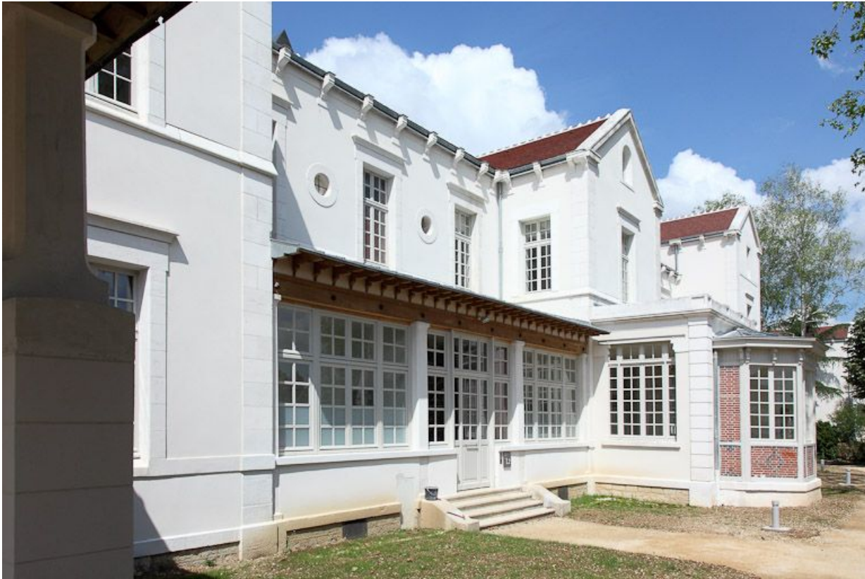
Façade est d'un des bâtiments postérieurs.

89, Auxerre, 2-4 avenue Charles-de-Gaulle