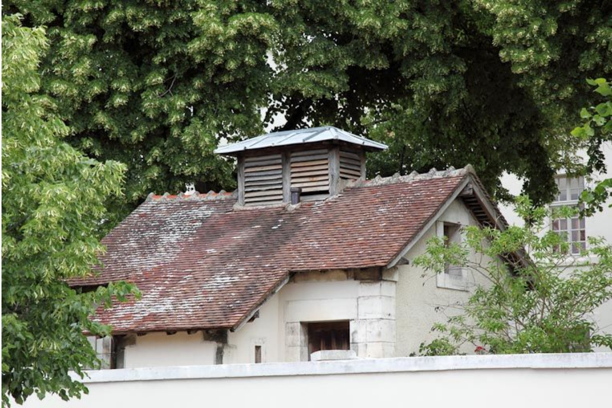
Petite dépendance vue de la rue.

89, Auxerre, 2-4 avenue Charles-de-Gaulle