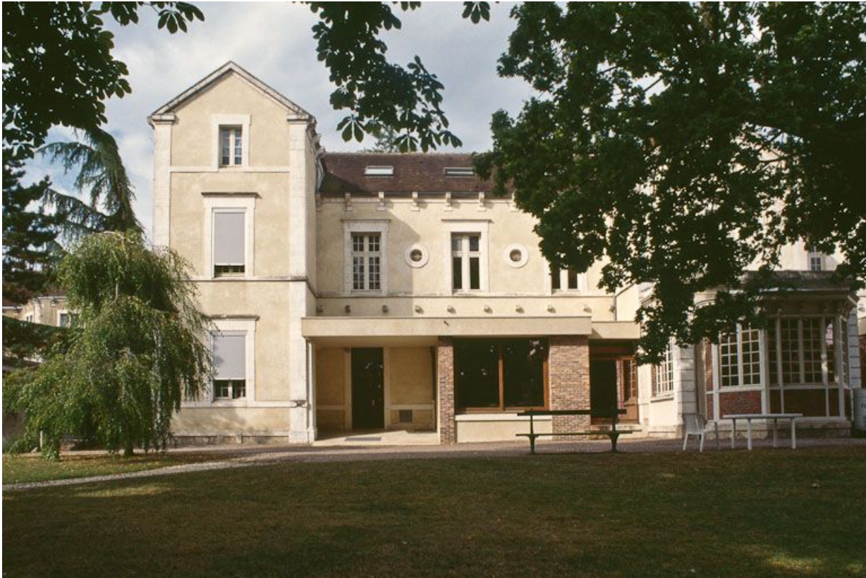
Quartier des femmes, un des bâtiments postérieurs, façade est.

89, Auxerre, 2-4 avenue Charles-de-Gaulle