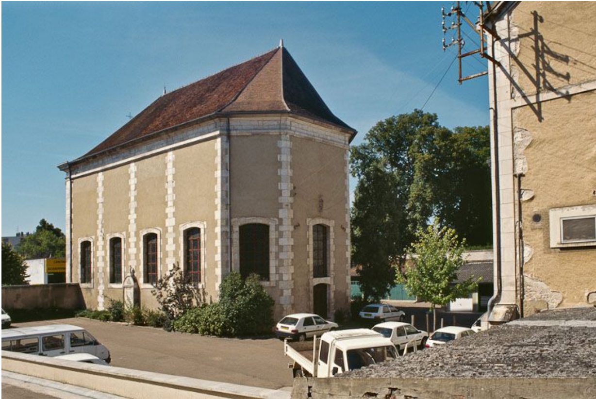
Chapelle, vue de trois-quarts postérieur. 89, Auxerre, 2-4 avenue Charles-de-Gaulle