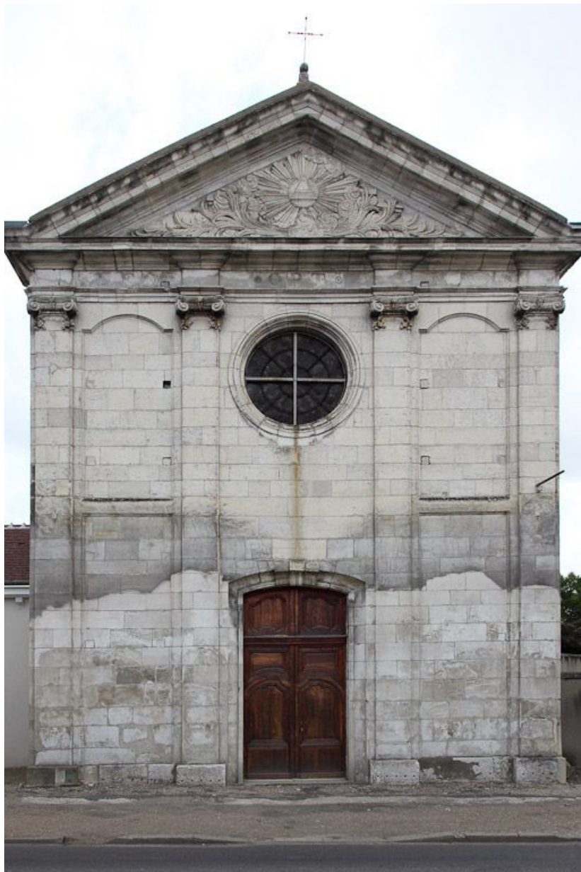
Façade de la chapelle.

89, Auxerre, 2-4 avenue Charles-de-Gaulle