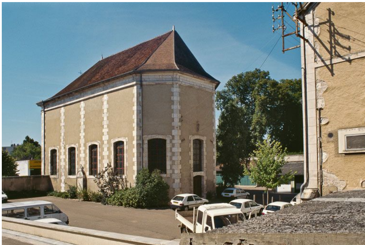
Chapelle, vue de trois-quarts postérieur. 89, Auxerre, 2-4 avenue Charles-de-Gaulle