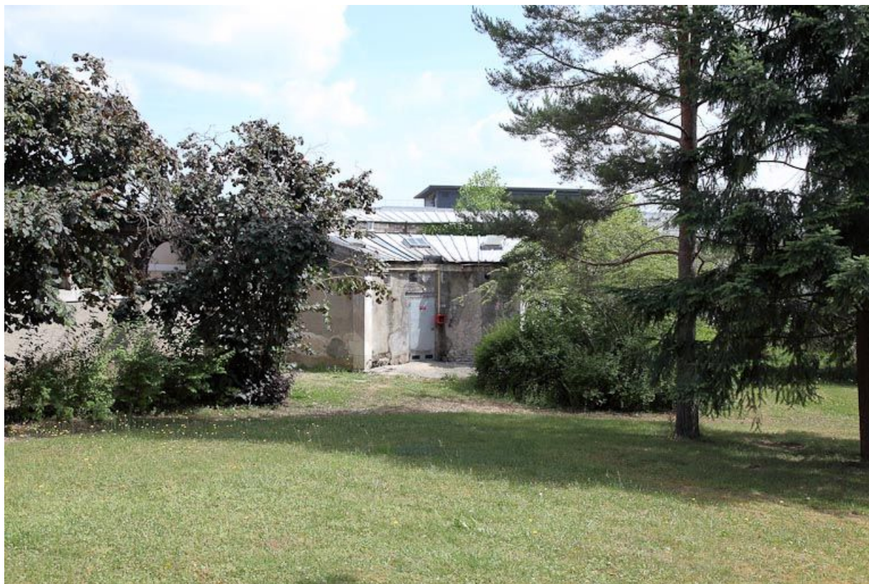
Bâtiment des "agités" de l'ancien quartier des femmes.

89, Auxerre, 2-4 avenue Charles-de-Gaulle