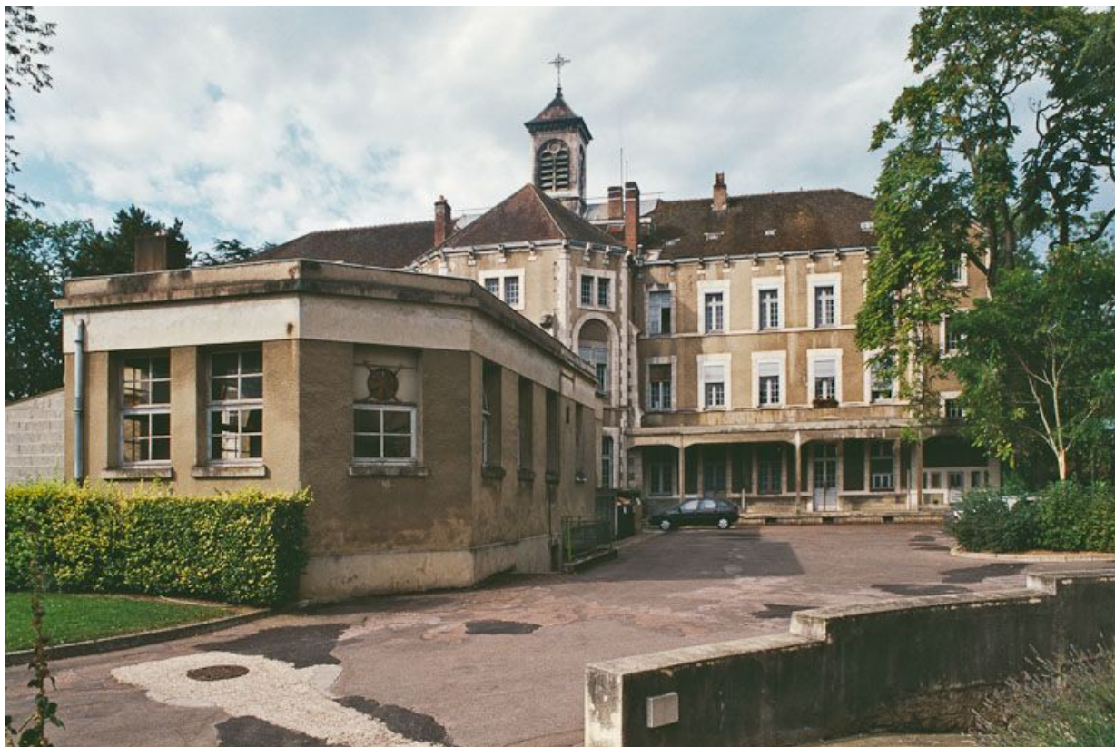
Bâtiment central, façade postérieure et cuisine construite en 1958 (1er plan).

89, Auxerre, 2-4 avenue Charles-de-Gaulle