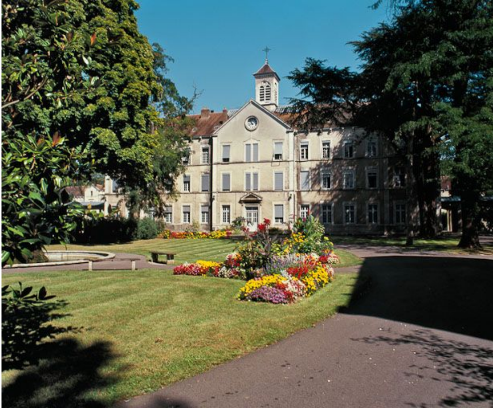
Bâtiment central, administratif.

89, Auxerre, 2-4 avenue Charles-de-Gaulle