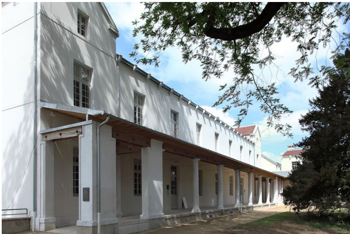
Bâtiment de l'ancien quartier des femmes.

89, Auxerre, 2-4 avenue Charles-de-Gaulle