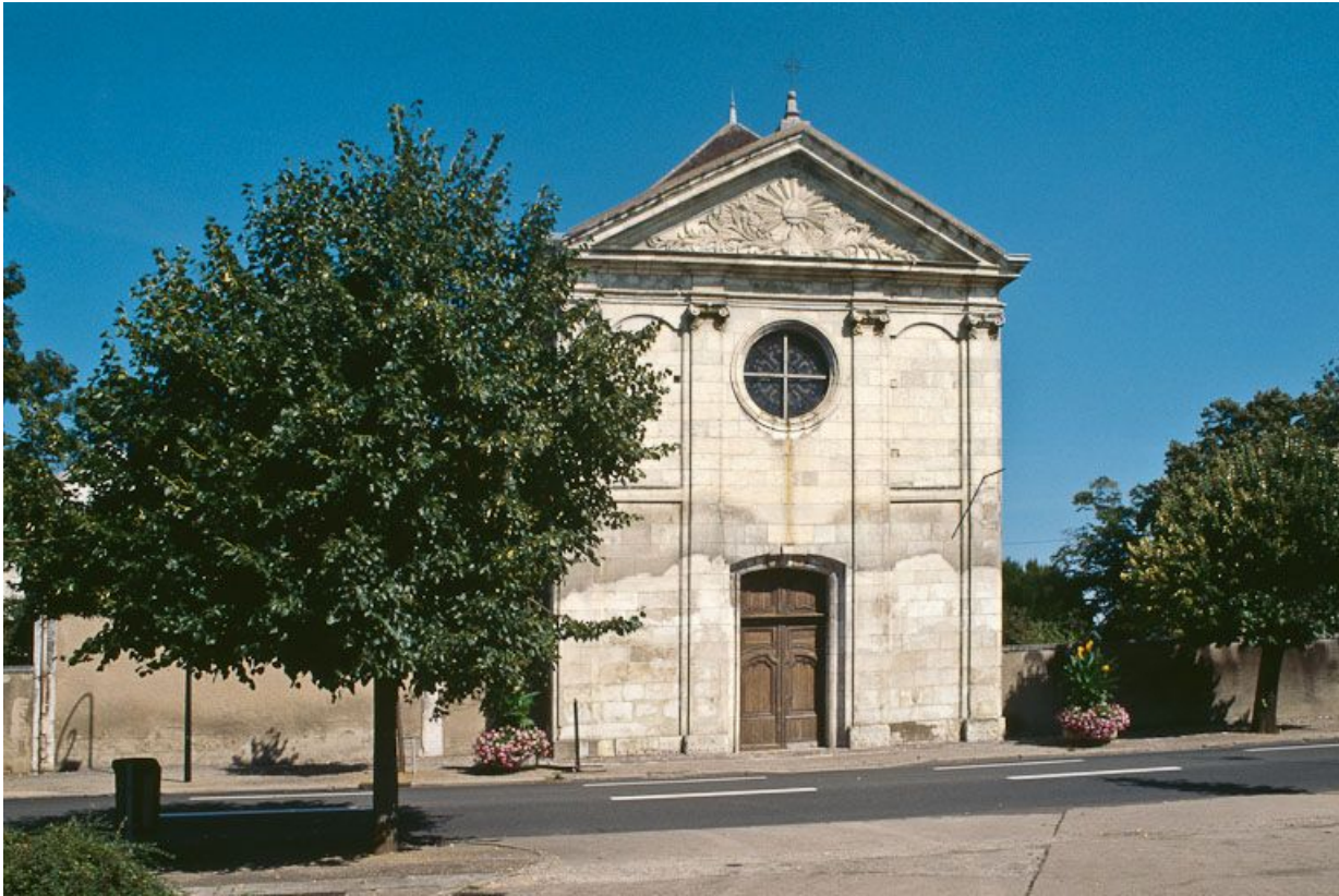
Façade de la chapelle.

89, Auxerre, 2-4 avenue Charles-de-Gaulle