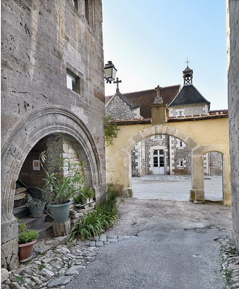
Vue d'ensemble depuis la rue du Couvent.