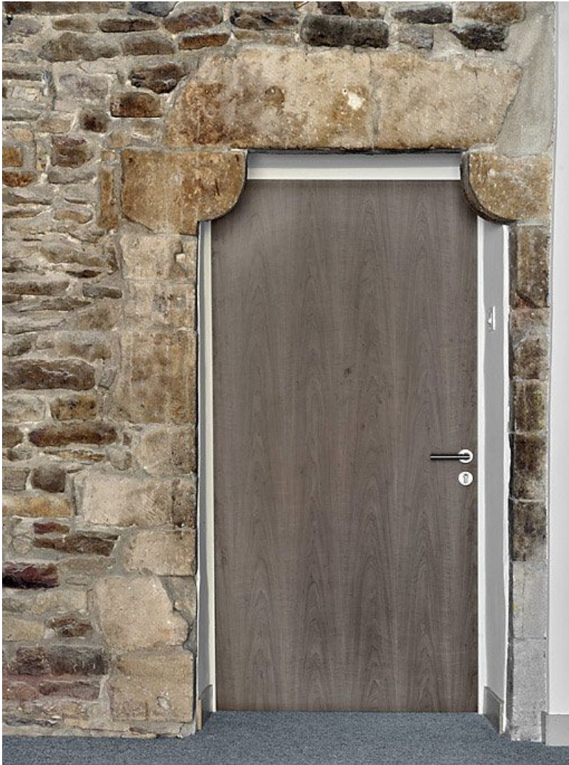
Porte à coussinets située près de la tour d'escalier.