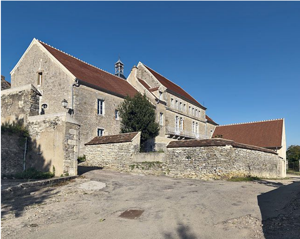
Vue d'ensemble prise du sud-ouest.