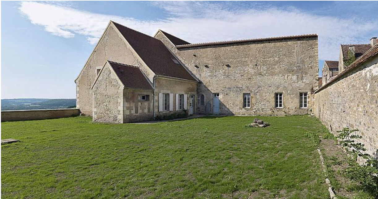
Vue d'ensemble prise de la partie est de la cour.