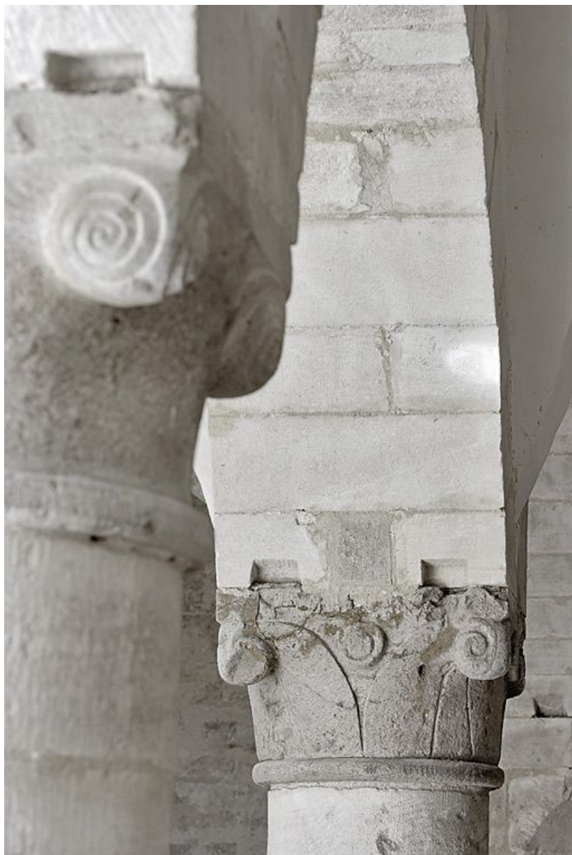
Salle voûtée, détail.