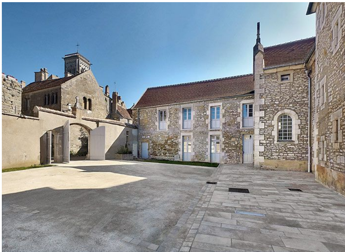
Vue prise de la partie ouest de la cour.