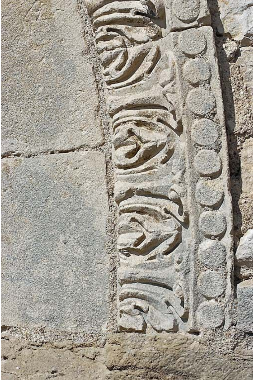
Détail du décor de la porte de la salle voûtée, rue du Château. 89, Vézelay, 4 rue de l' Hôpital