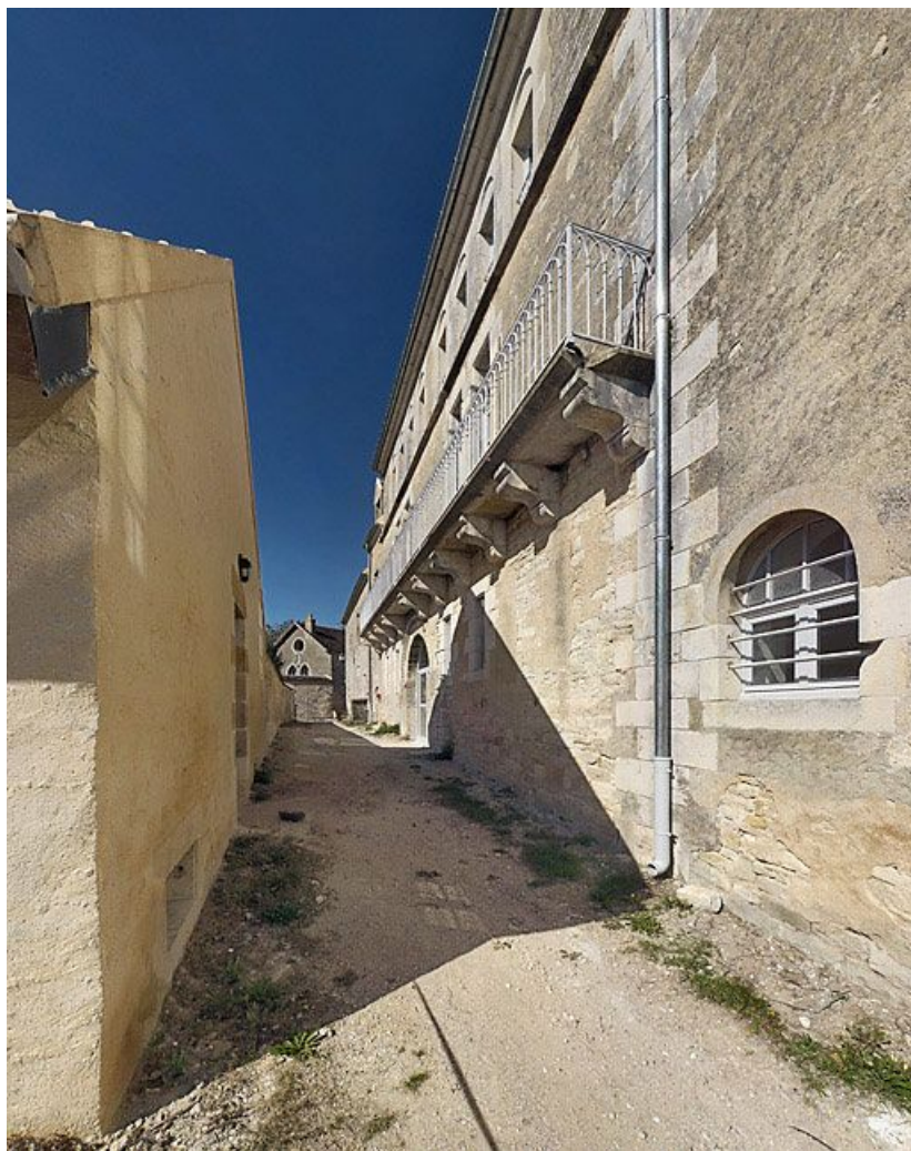
Elévations postérieures, rue du Château.