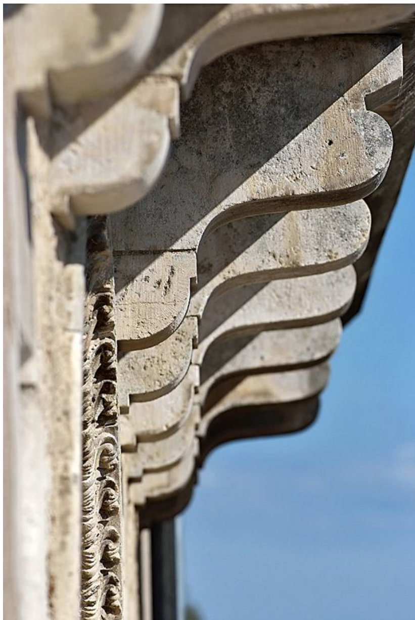
Consoles supportant le balcon de la façade rue du Château.