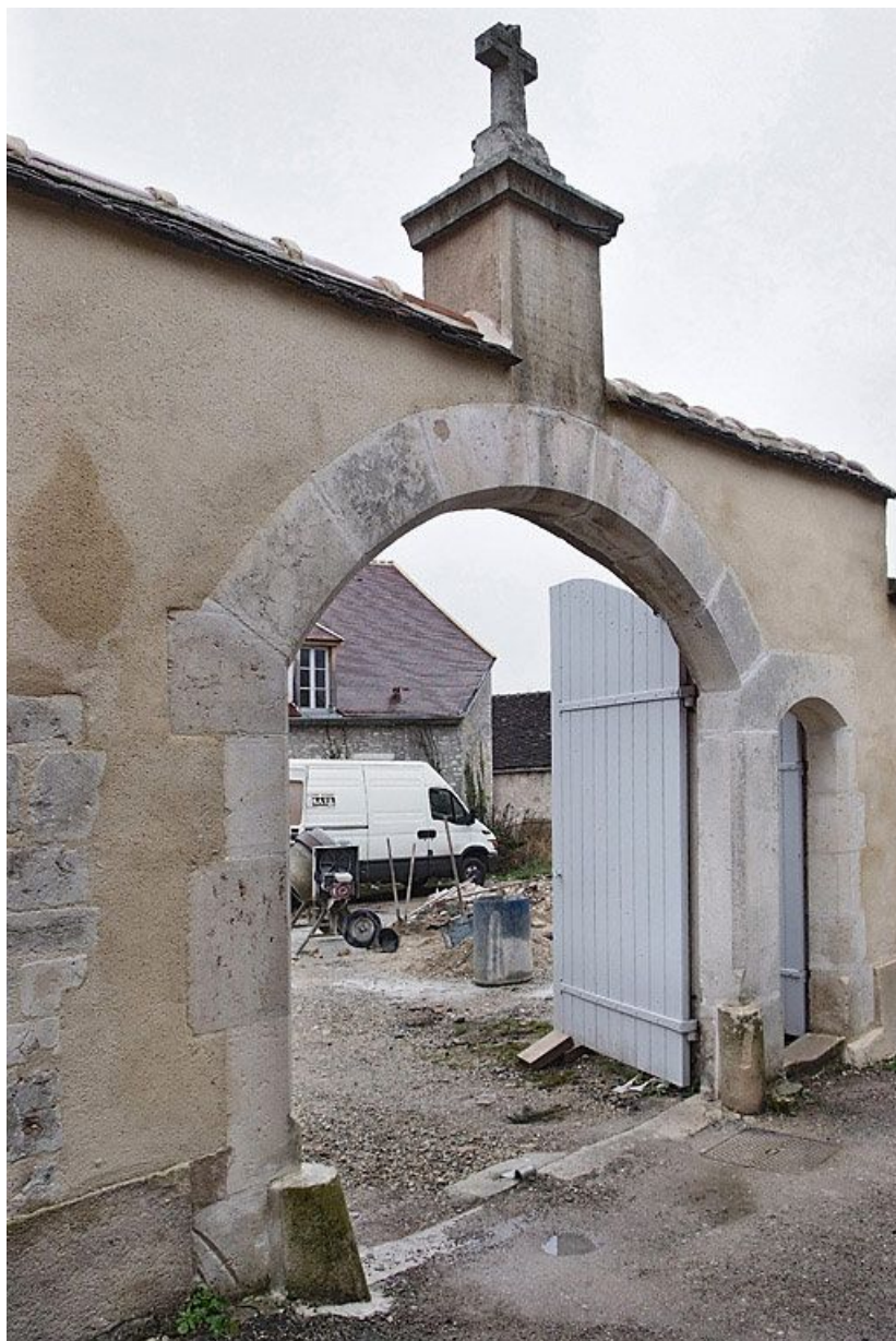
Portail et corps de bâtiment ouest pendant les travaux.