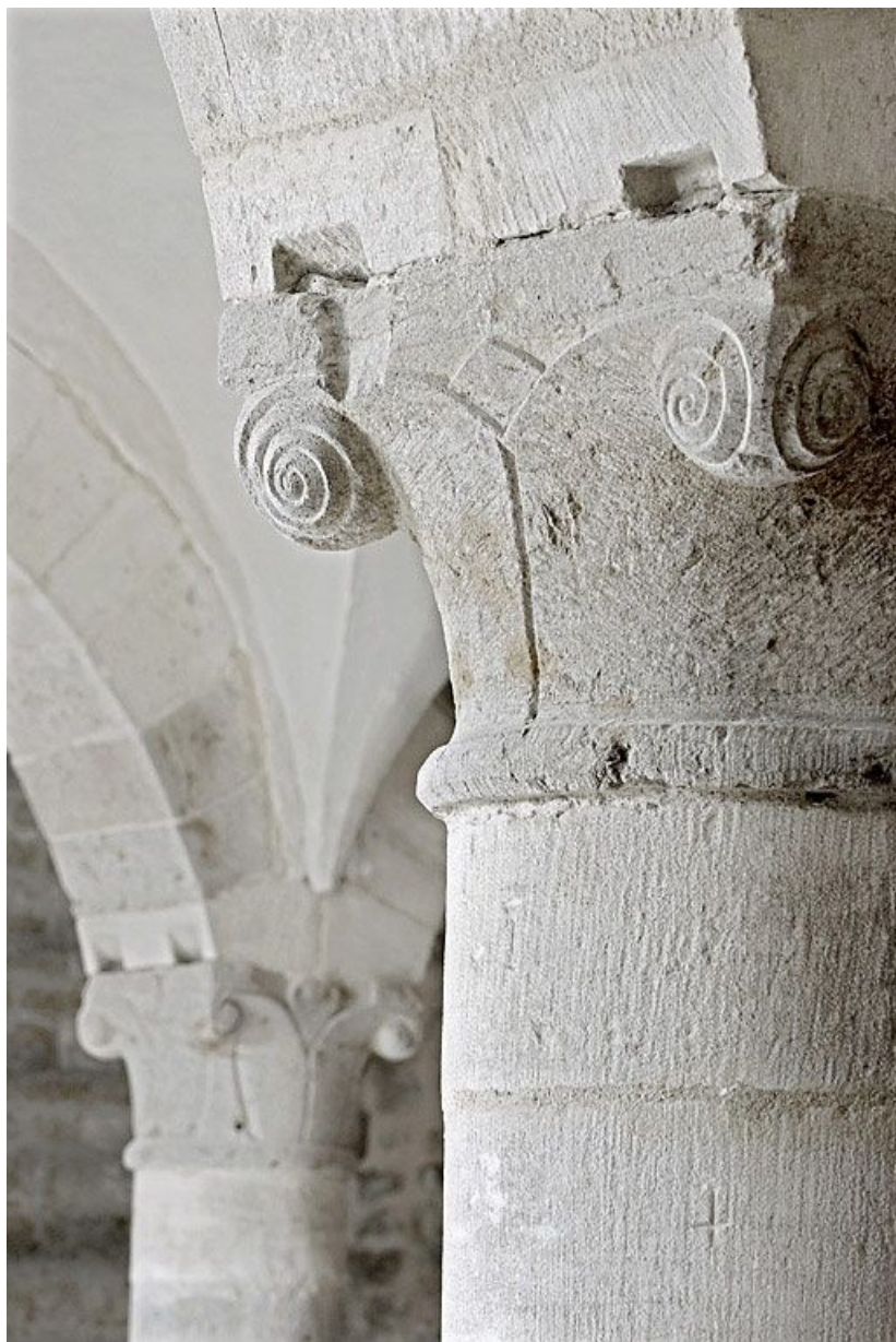
Salle voûtée, détail.