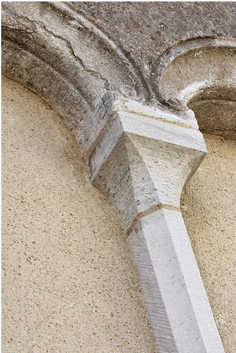
Aile du logis, élévation sur la rue de l'hôpital : détail.