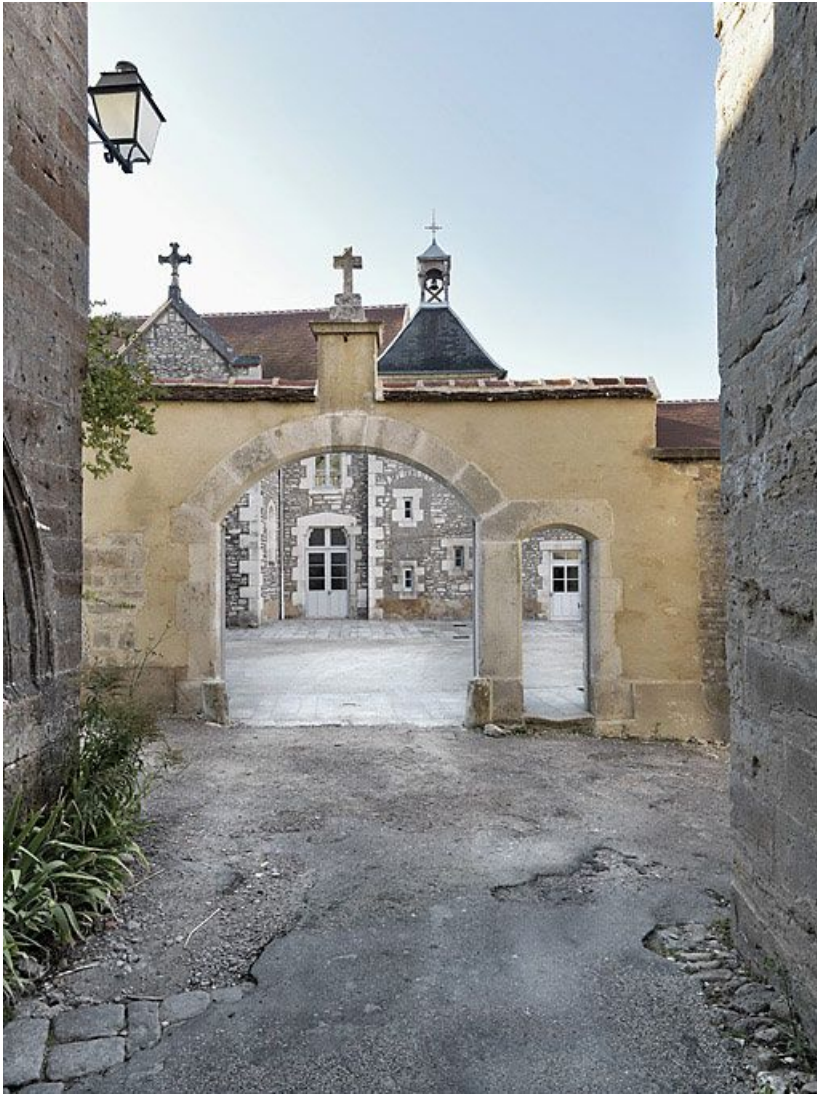
Vue d'ensemble depuis la rue du Couvent.