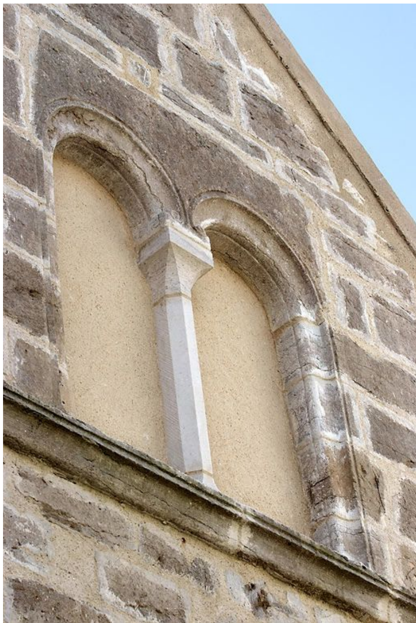
Aile du logis, élévation sur la rue de l'hôpital : détail.