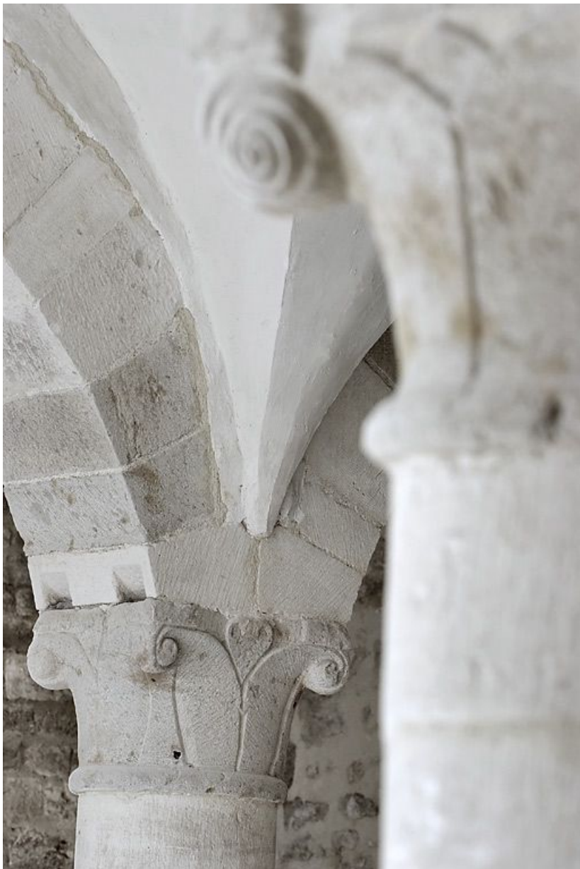
Salle voûtée, détail.