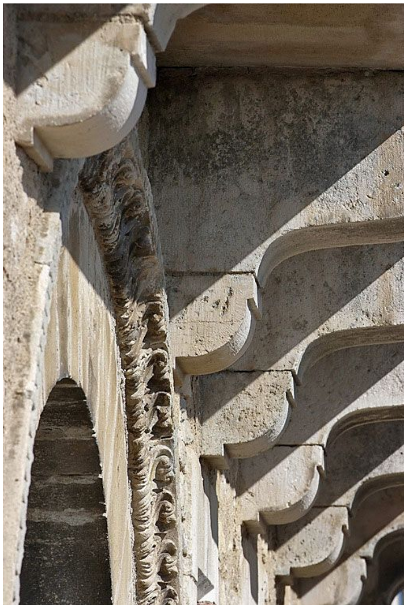
Détail du décor de la porte de la salle voûtée, rue du Château. 89, Vézelay, 4 rue de l' Hôpital