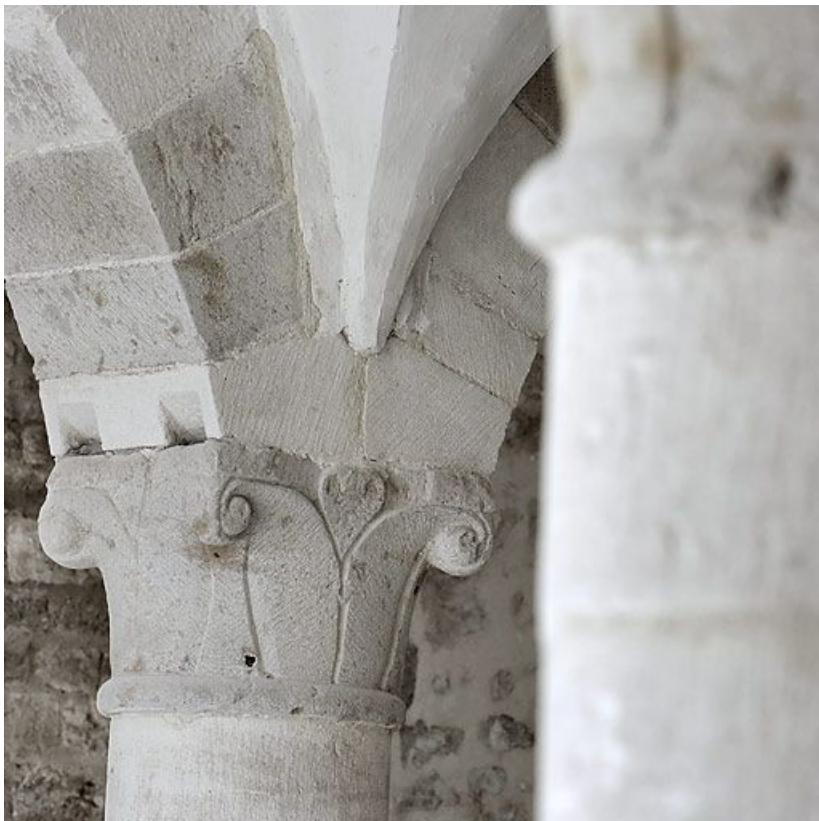
Salle voûtée, détail.