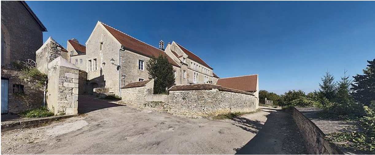
Vue d'ensemble prise du sud-ouest.