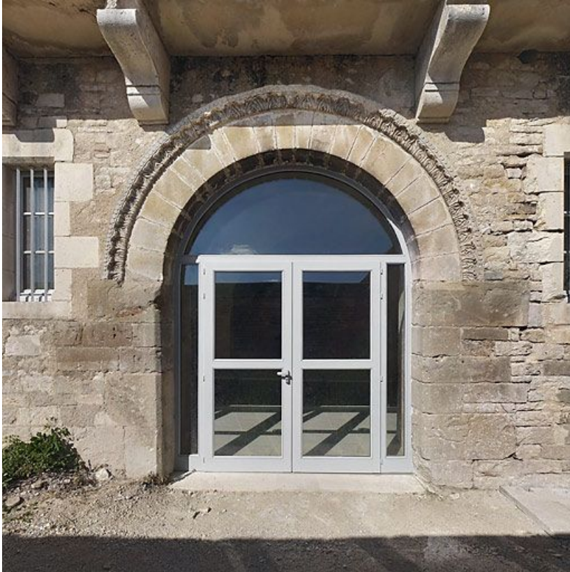
Porte de la salle voûtée, rue du Château.