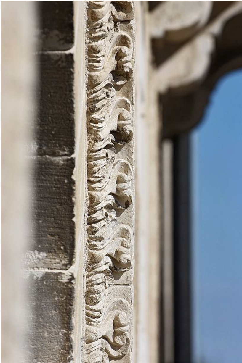
Détail du décor de la porte de la salle voûtée, rue du Château. 89, Vézelay, 4 rue de l' Hôpital