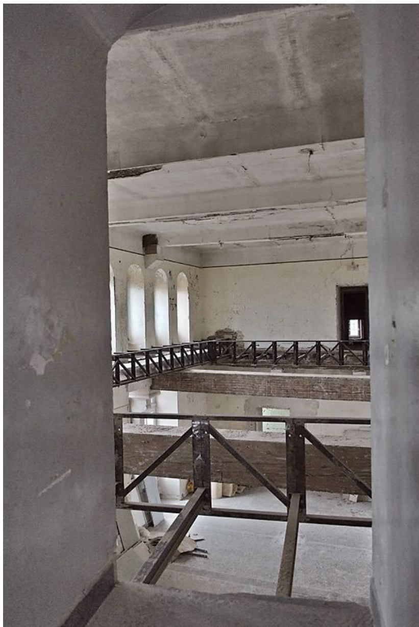
Pièces au-dessus de la salle voûtée pendant les travaux.