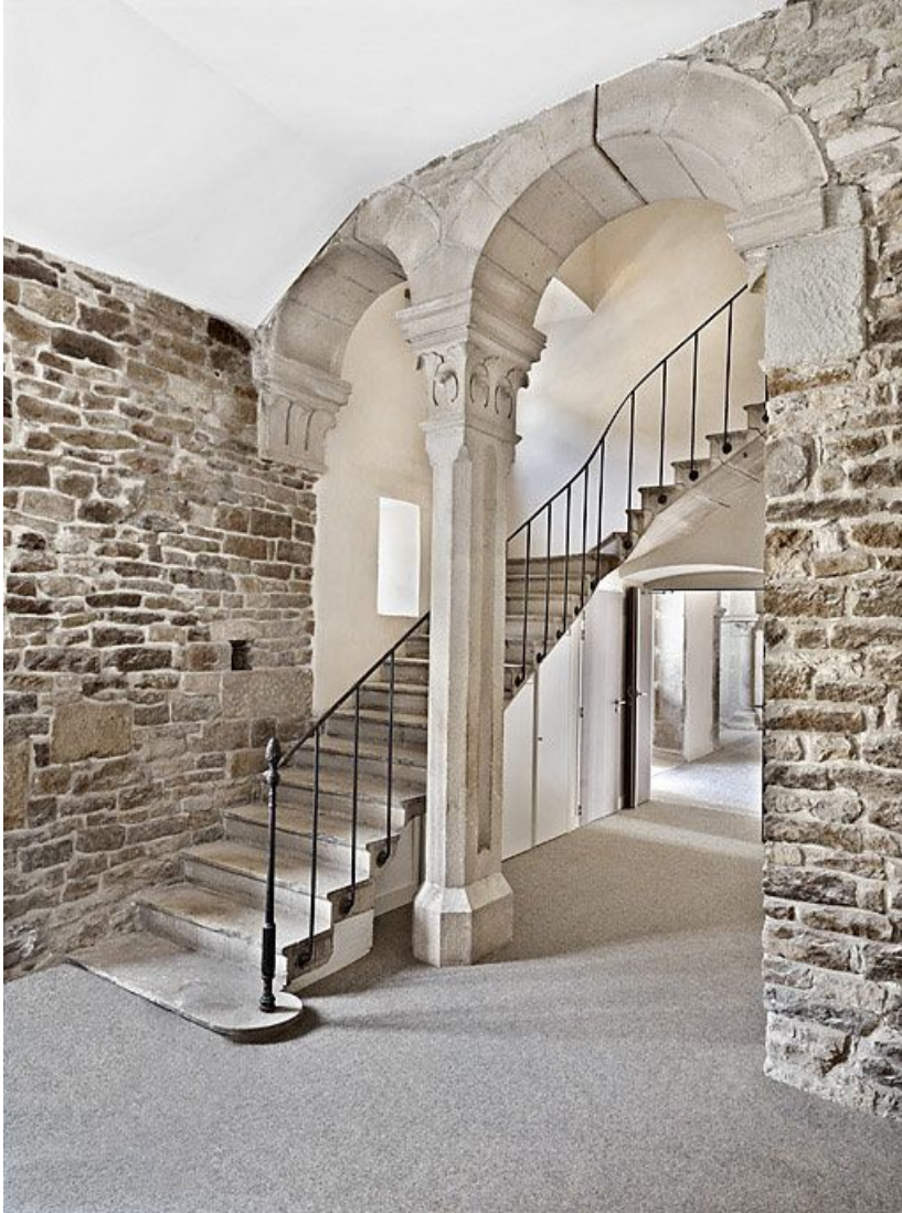
Escalier situé près de la chapelle.