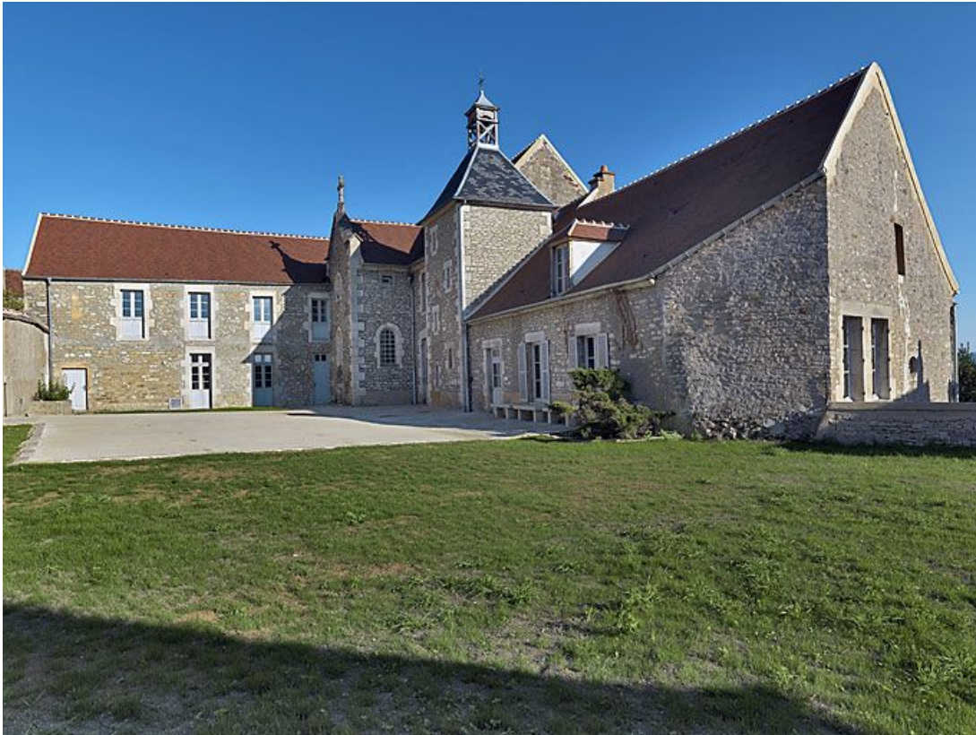
Corps de logis avec aile en retour.