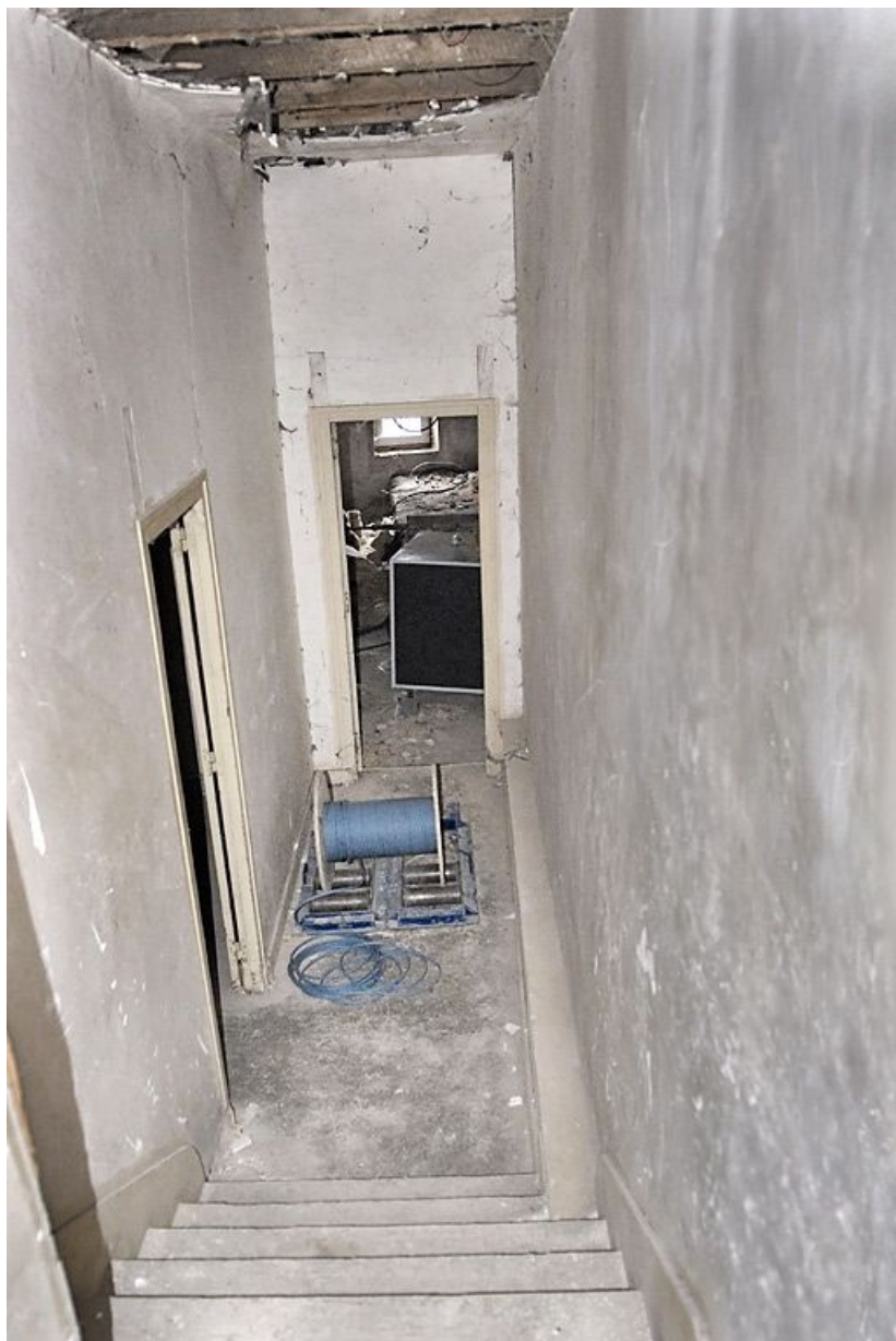
Couloir et escalier pendant les travaux.