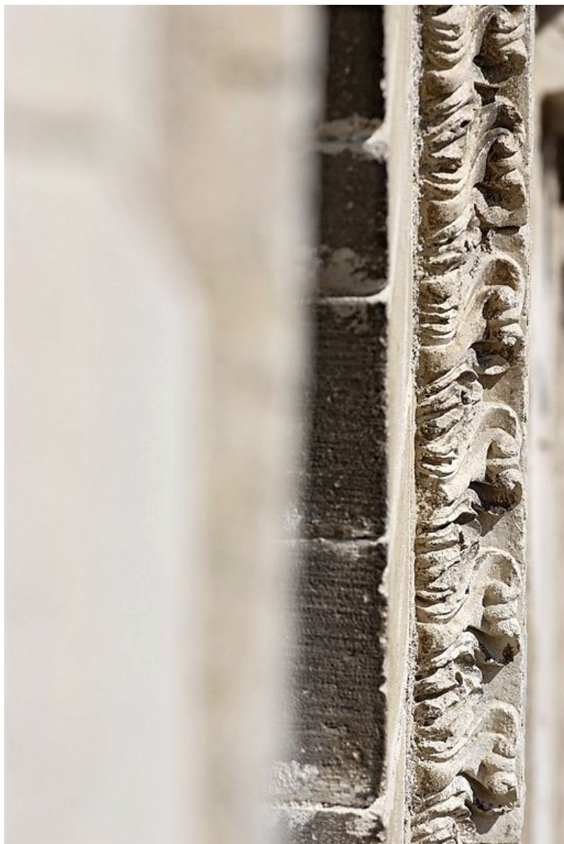
Détail du décor de la porte de la salle voûtée, rue du Château.