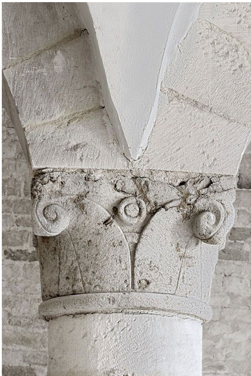
Salle voûtée, détail.