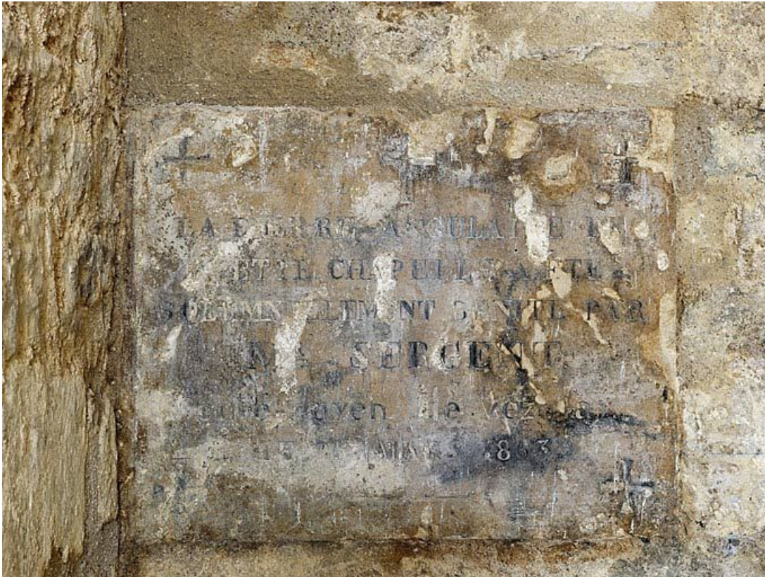
Pierre de fondation de la chapelle.