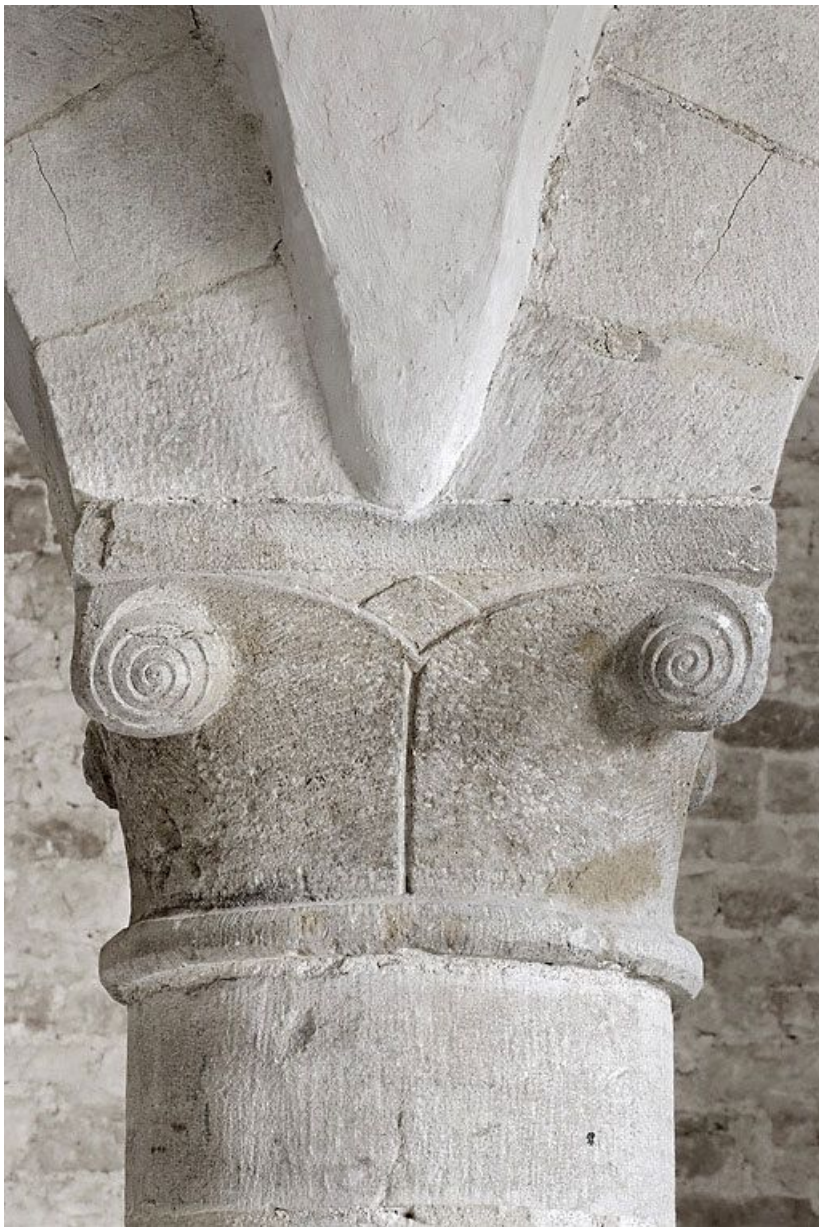
Salle voûtée, détail.