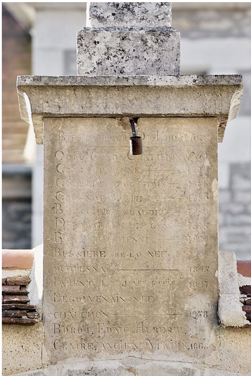
Détail de la croix surmontant le portail.