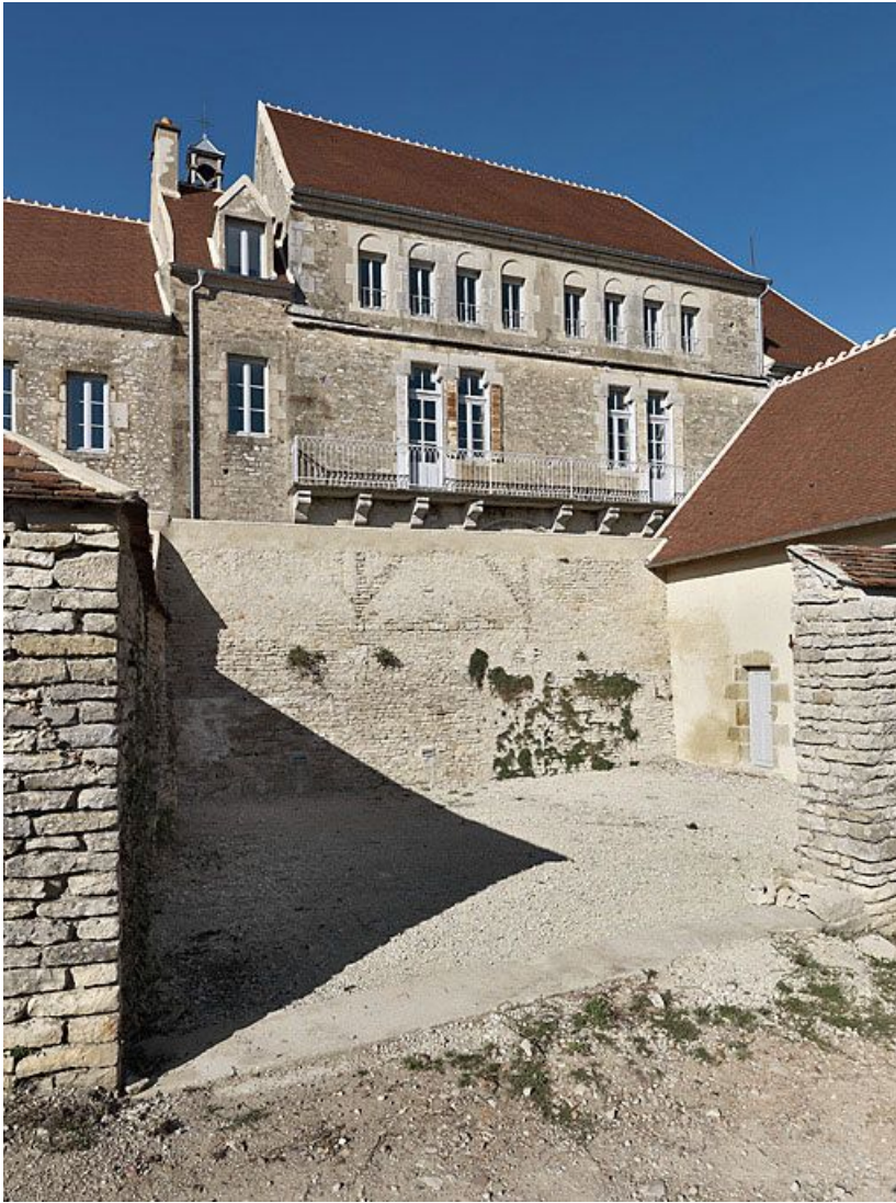
Façade postérieure du corps de bâtiment principal.