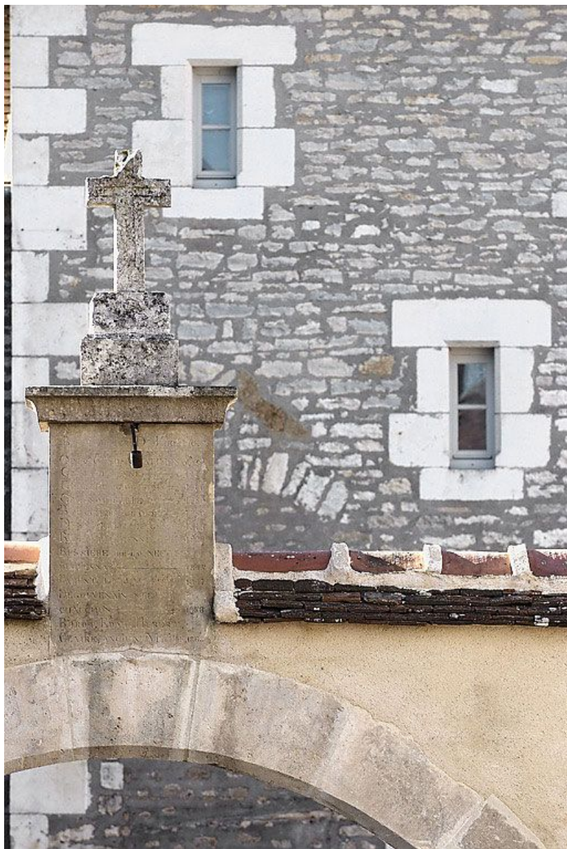
Détail de la croix surmontant le portail.