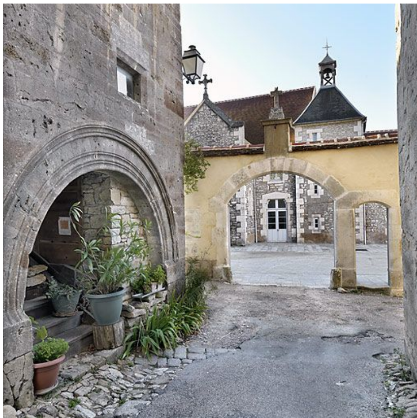
Vue d'ensemble depuis la rue du Couvent.