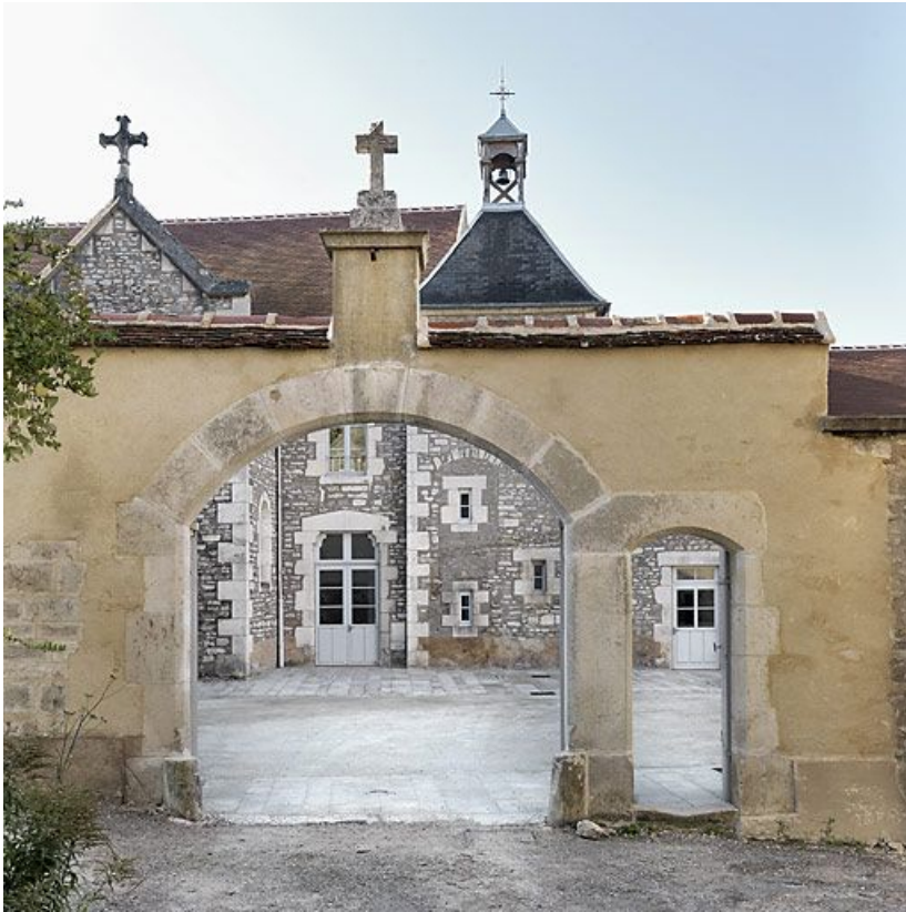
Vue d'ensemble depuis la rue du Couvent.