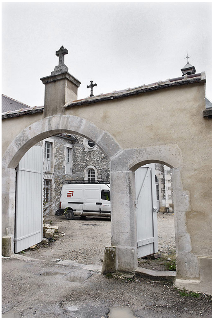
Vue d'ensemble avec le portail d'entrée.