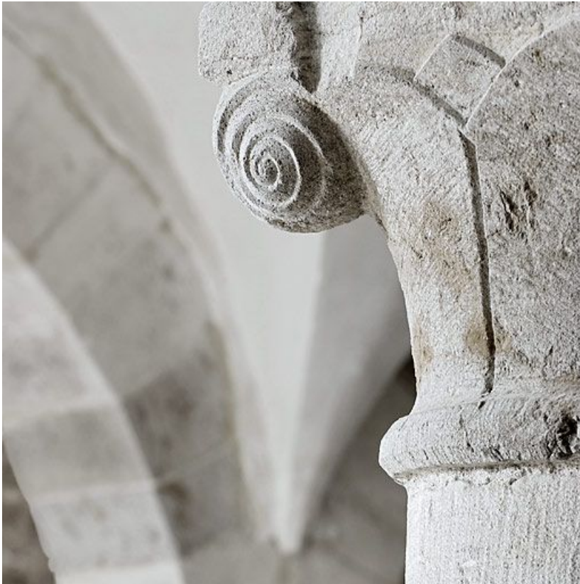
Salle voûtée, détail.