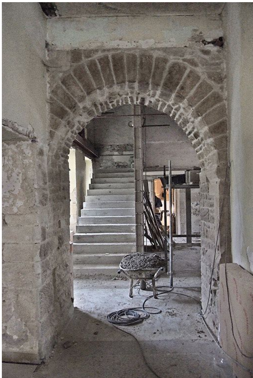
Couloir et escalier pendant les travaux.