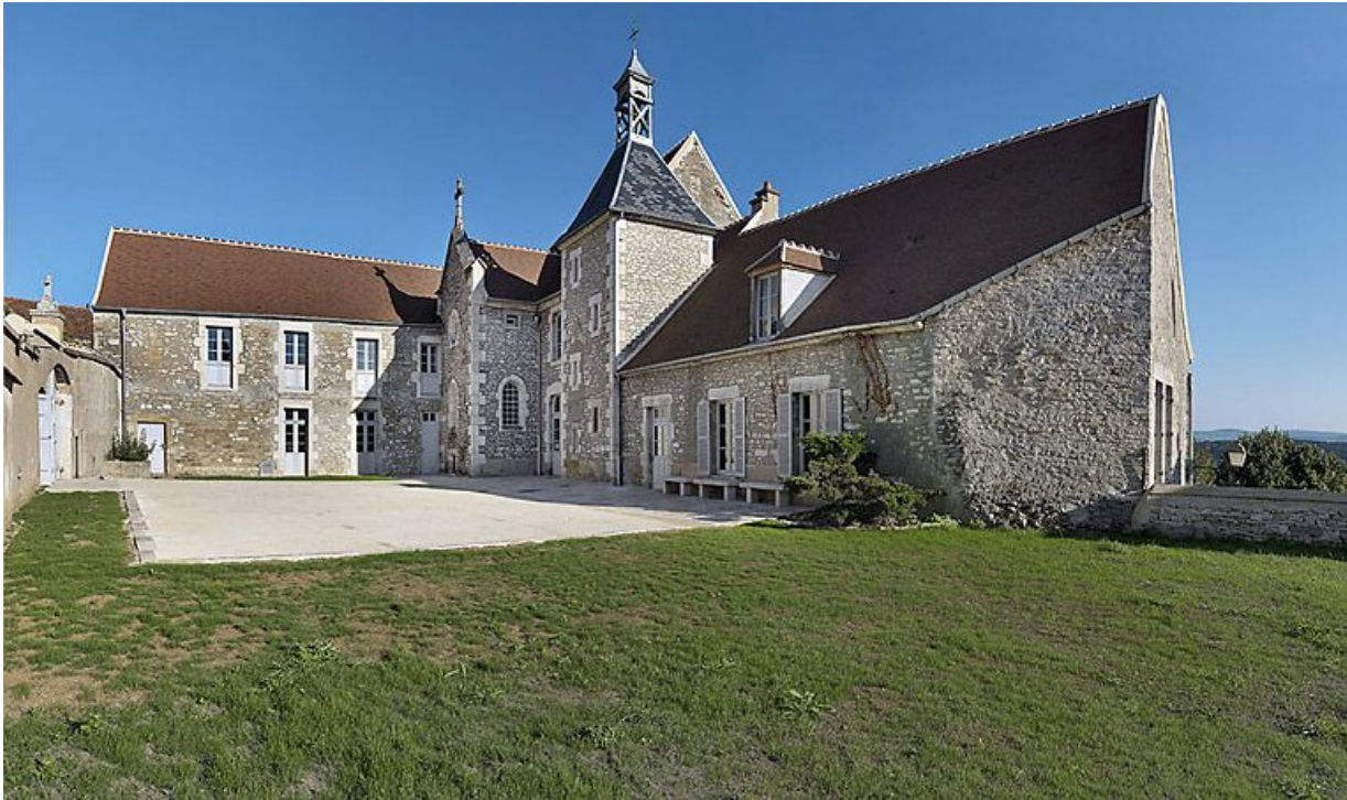
Corps de logis avec aile en retour.