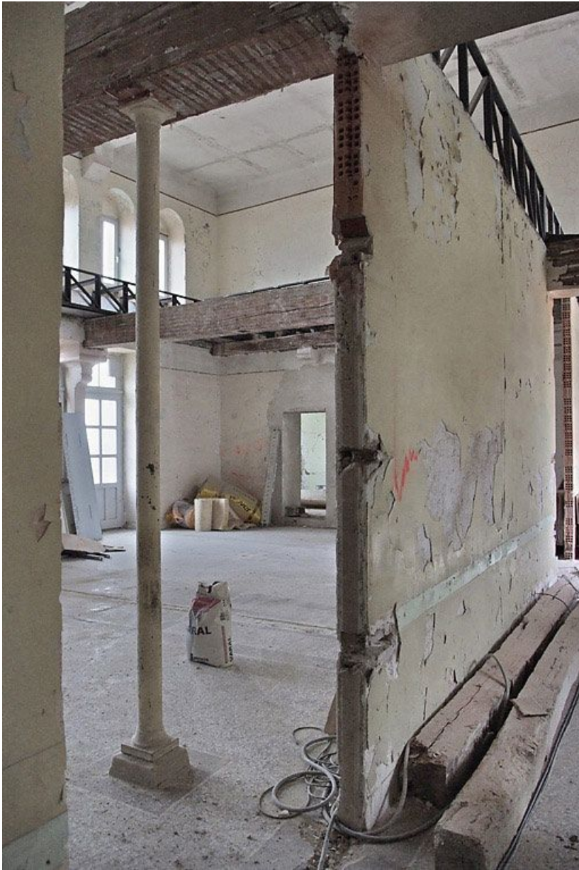
Pièces au-dessus de la salle voûtée pendant les travaux.