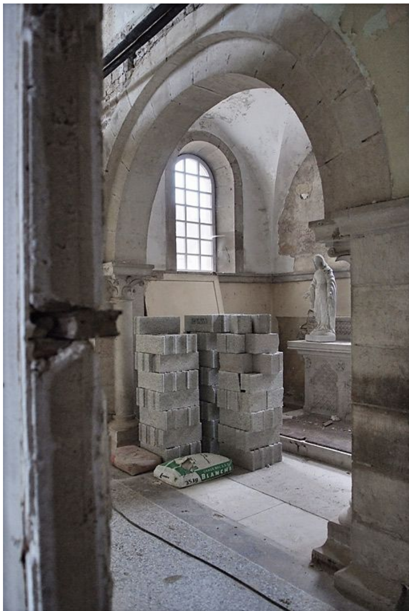
La chapelle pendant les travaux.