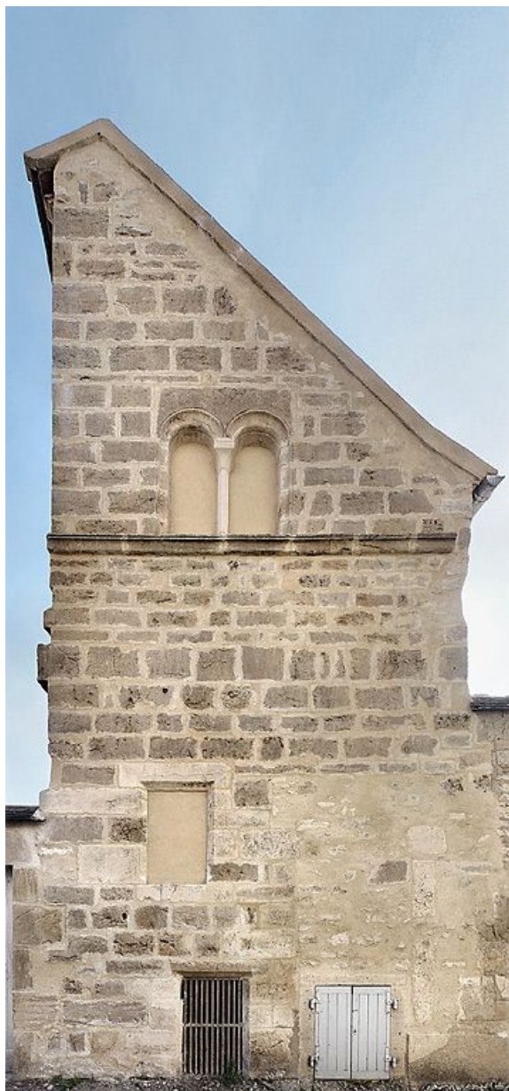
Aile du logis, élévation sur la rue de l'hôpital : détail. 89, Vézelay, 4 rue de l' Hôpital