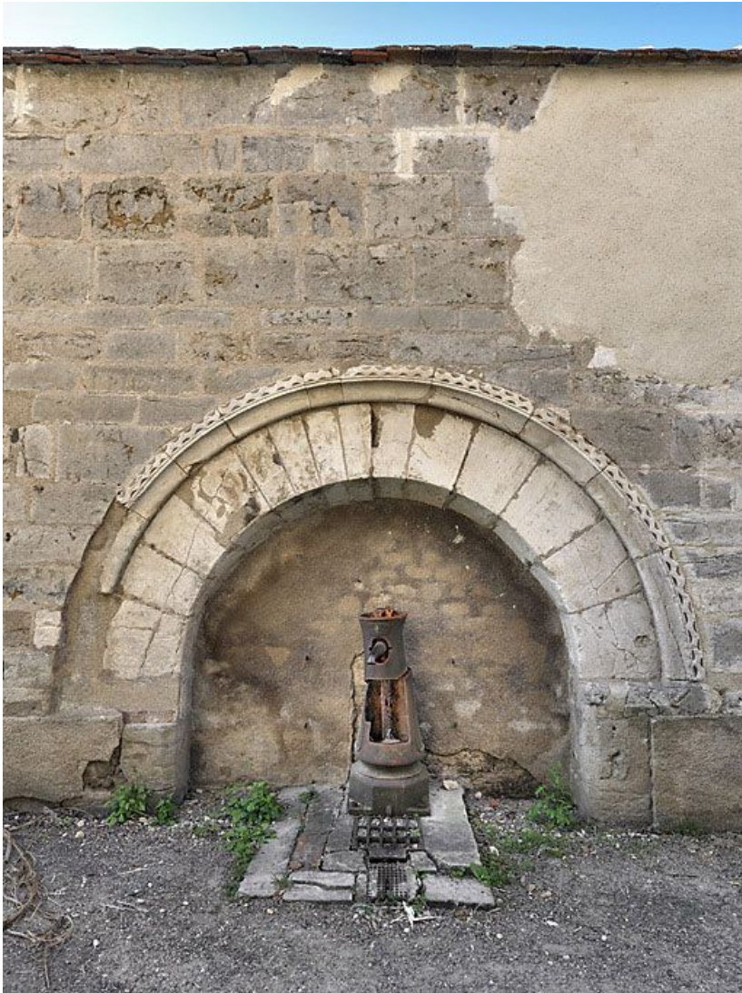
Fontaine dans le mur de clôture rue de l'hôpital.