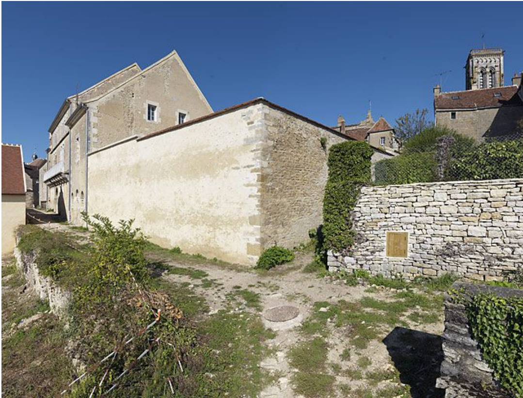
Vue d'ensemble prise du sud-est.