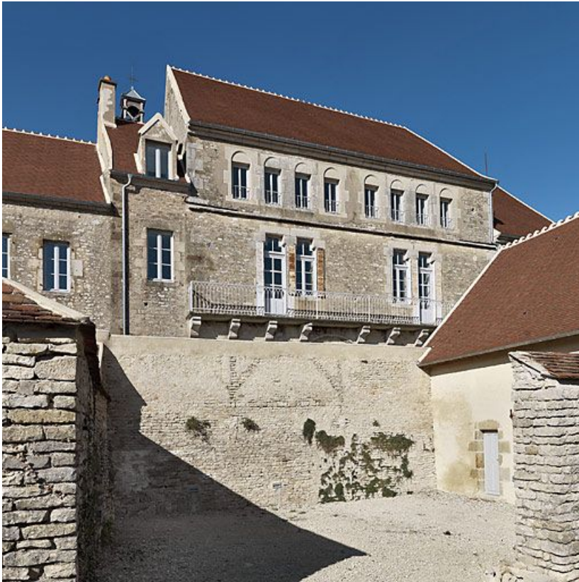
Façade postérieure du corps de bâtiment principal.