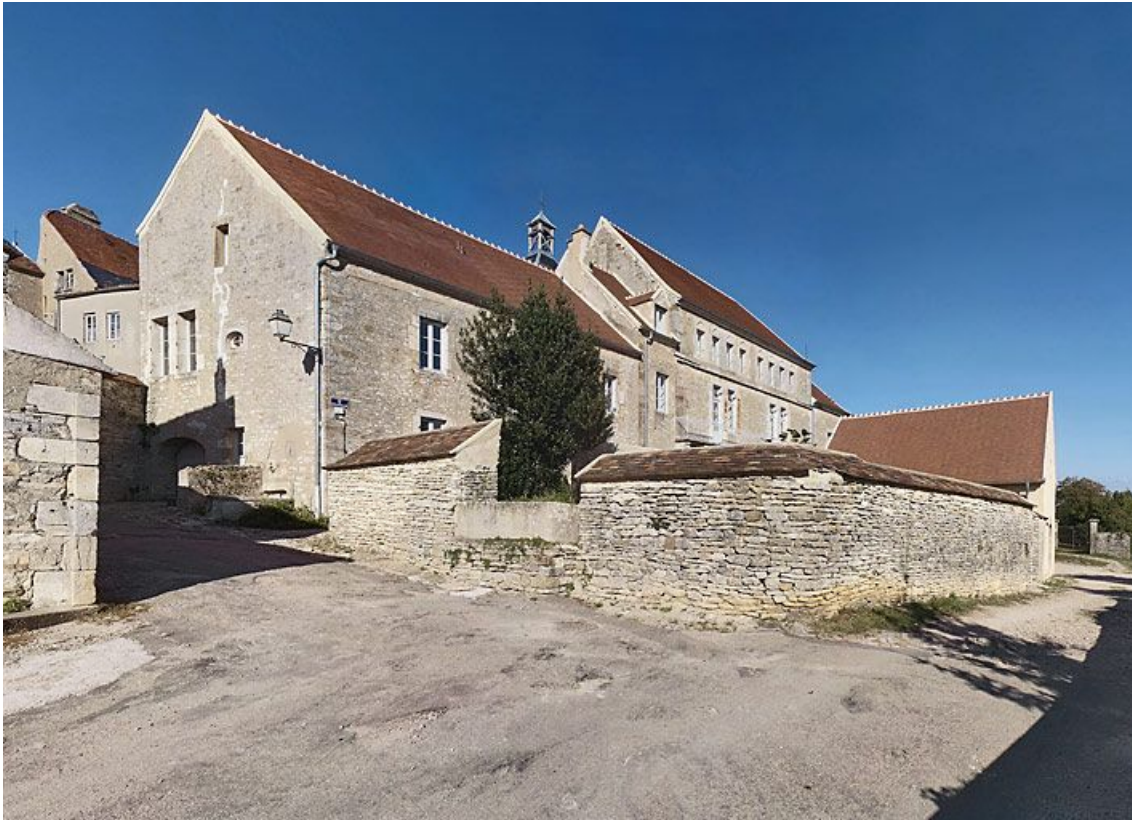
Vue d'ensemble prise du sud-ouest.