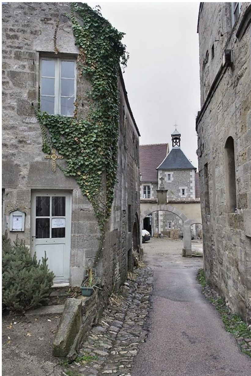
Vue d'ensemble depuis la rue du Couvent.