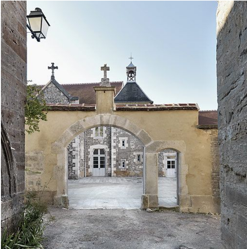
Vue d'ensemble depuis la rue du Couvent.