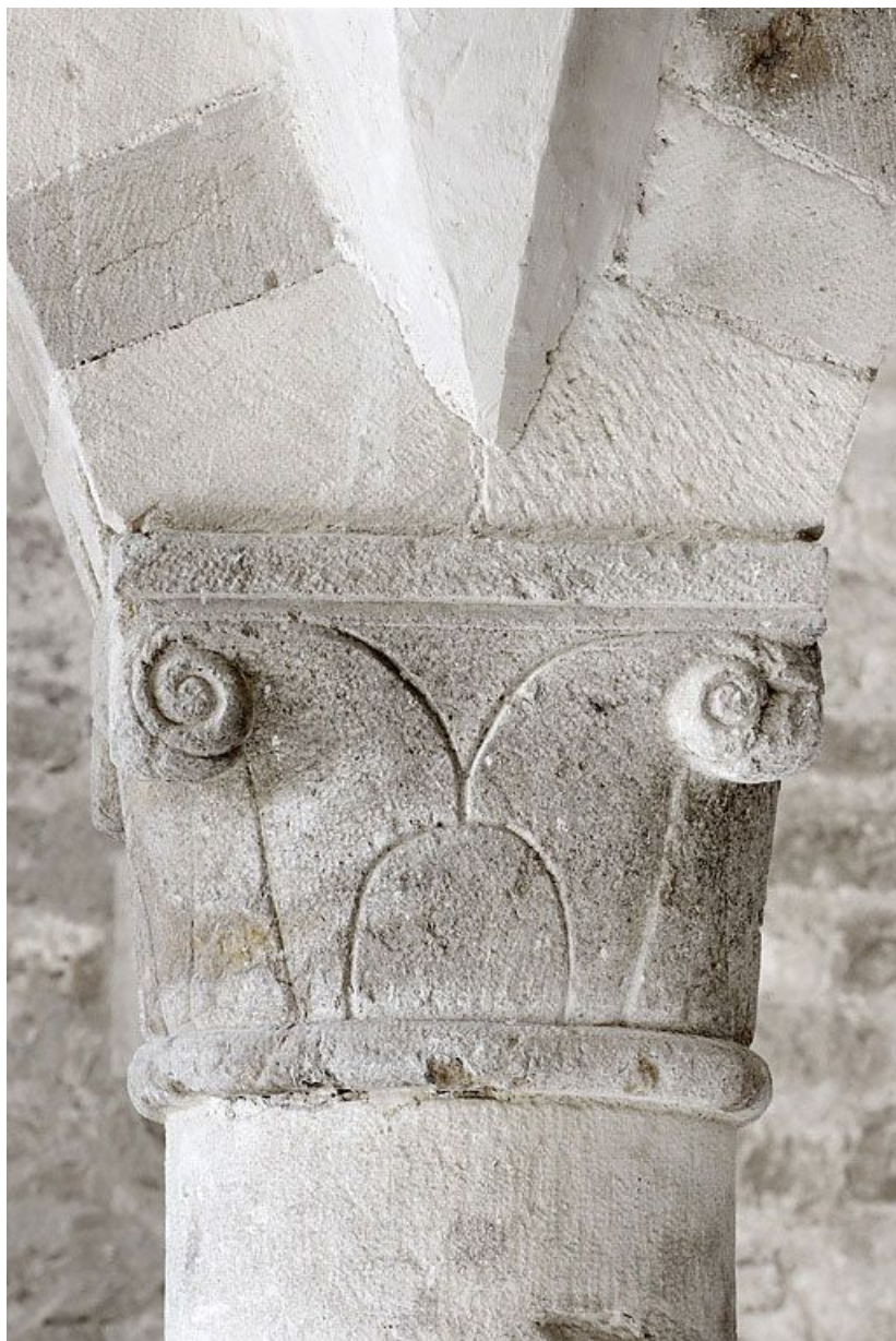
Salle voûtée, détail.