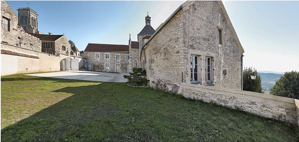
Vue d'ensemble prise de la partie ouest de la cour.