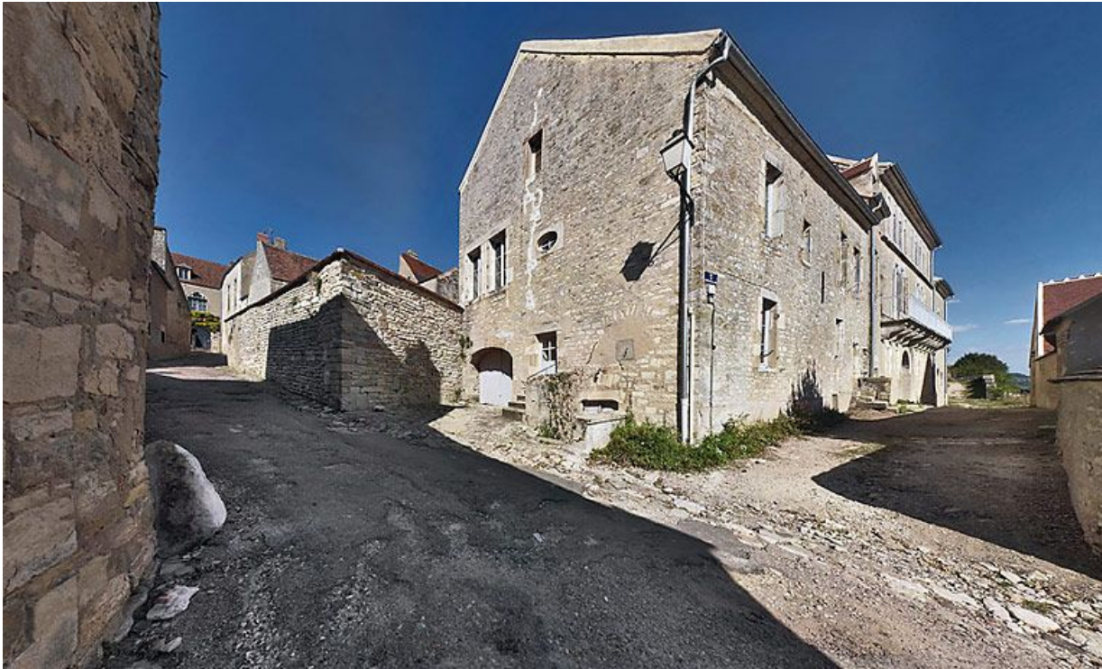
Vue d'ensemble des façades postérieures.