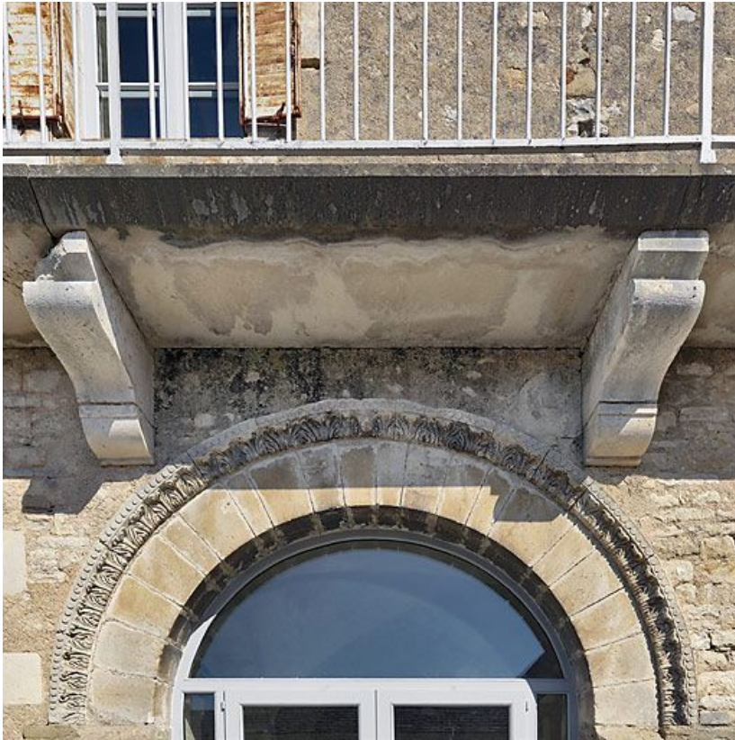
Détail de l'arc de la porte de la salle voûtée, rue du Château.