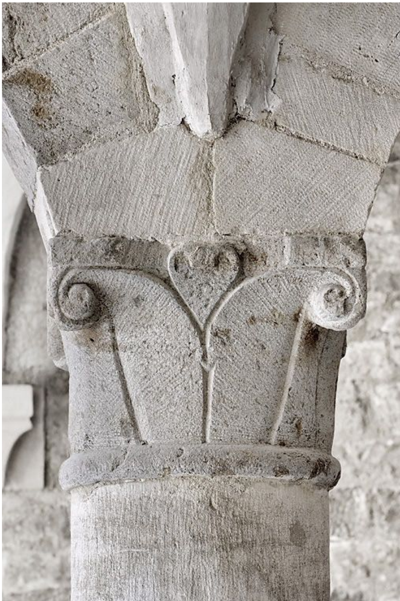
Salle voûtée, détail.