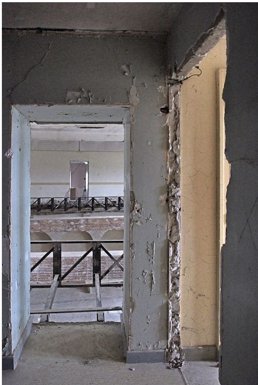
Pièce au-dessus de la salle voûtée pendant les travaux.