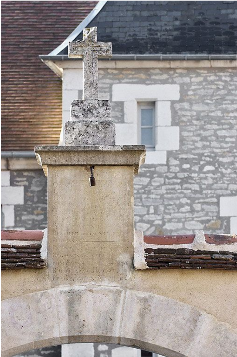
Détail de la croix surmontant le portail.