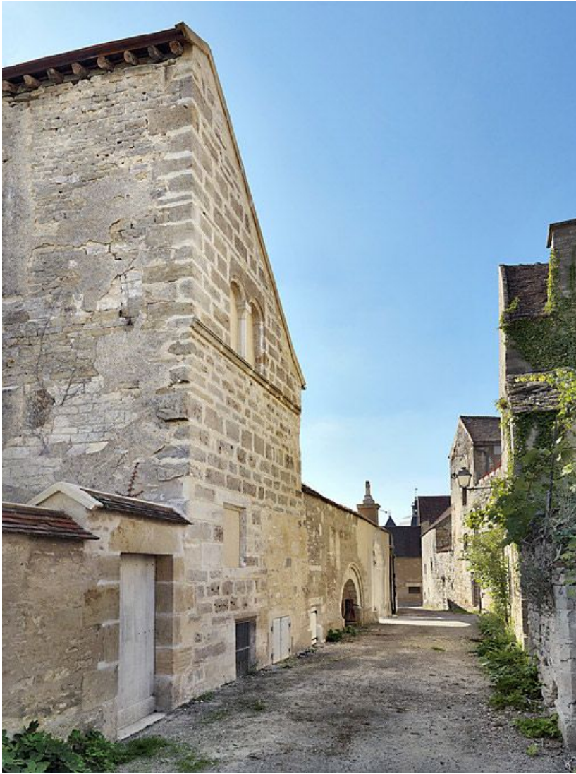
Aile du logis, élévation sur la rue de l'hôpital.