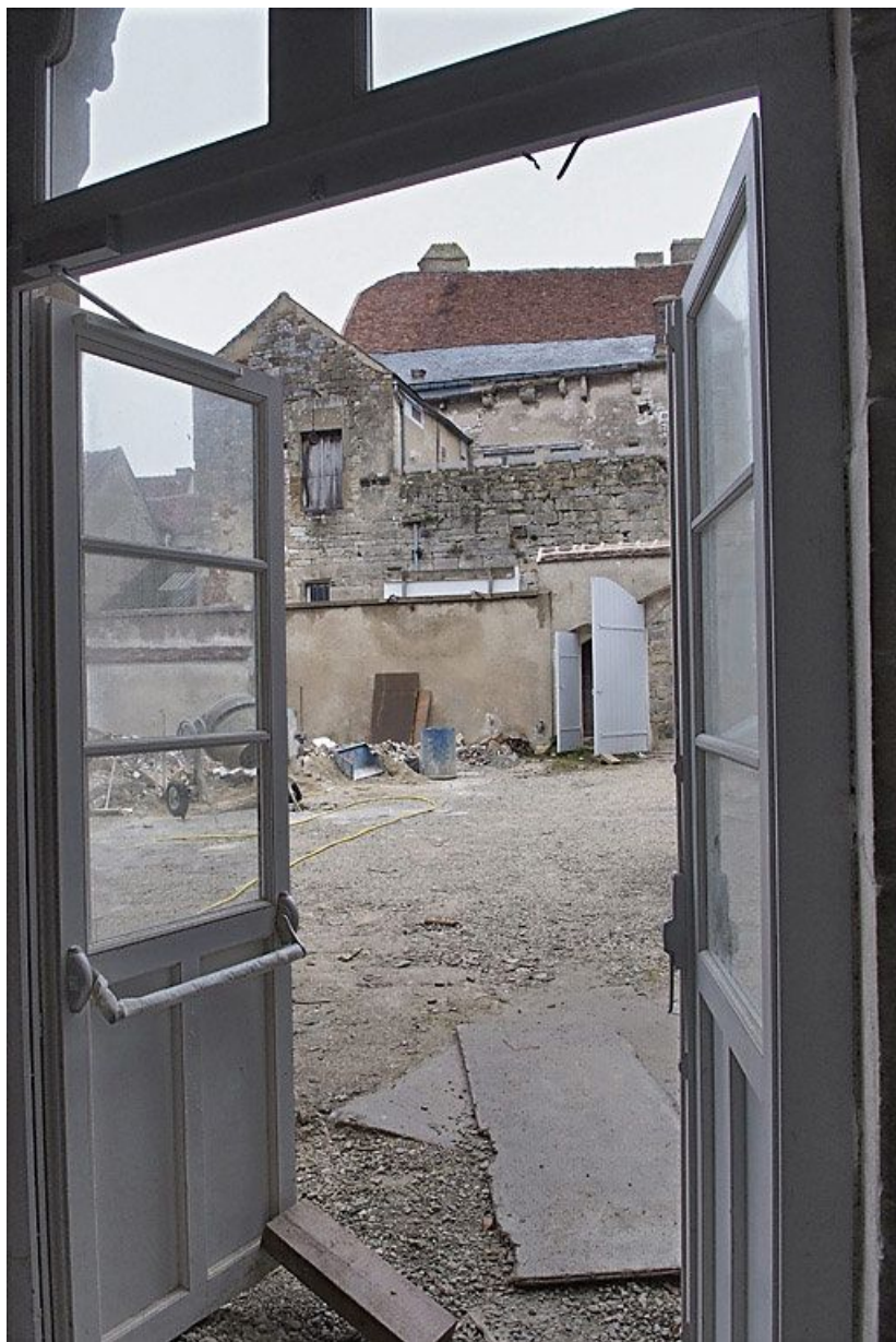
Vue de la cour pendant les travaux.