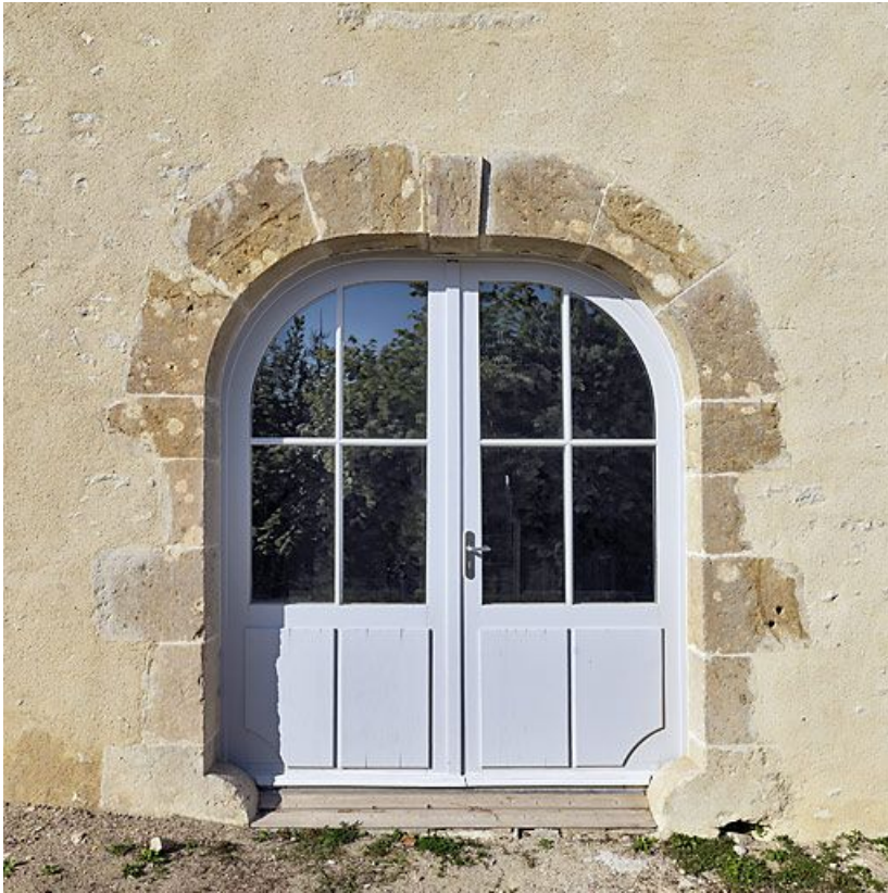
Porte du bâtiment situé de l'autre côté de la rue du Château.