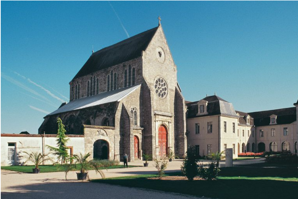
Vue de l'église et d'une partie du bâtiment en U.