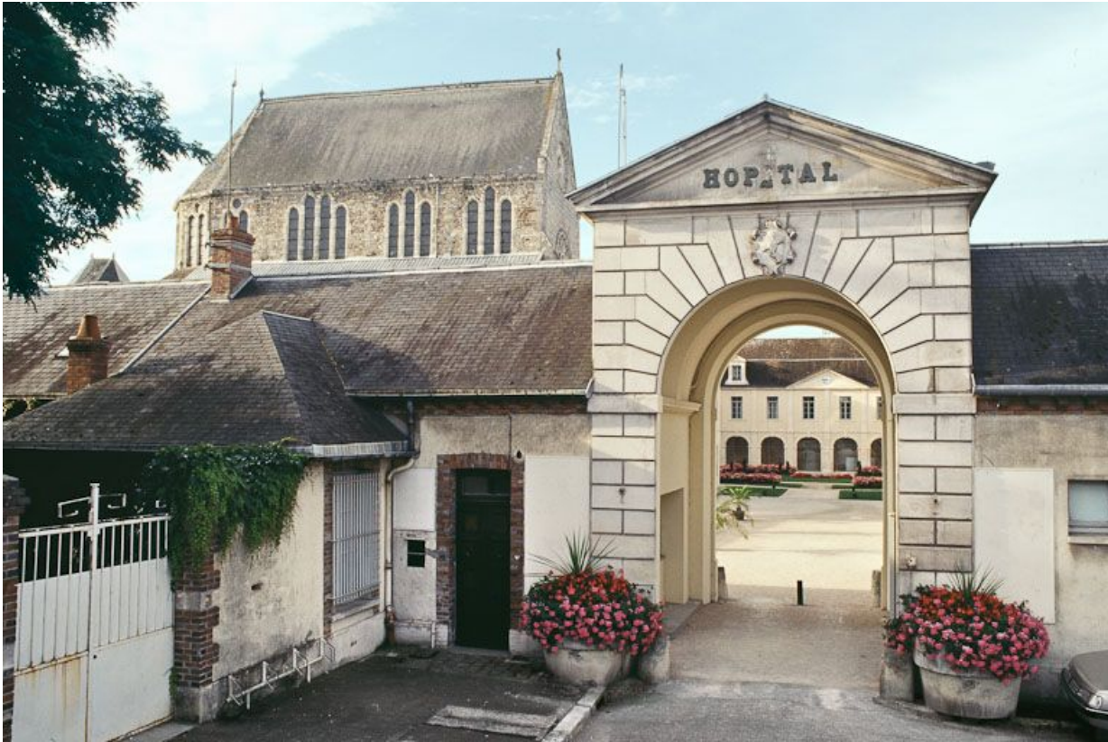
Vue d'ensemble avec le passage couvert donnant dans la cour intérieure.