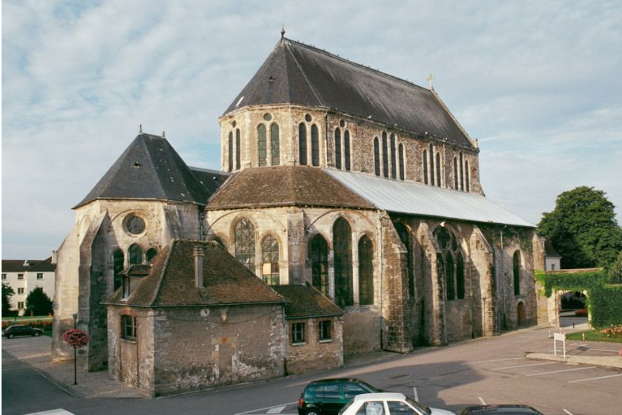
Vue des élévations nord et est de l'église.