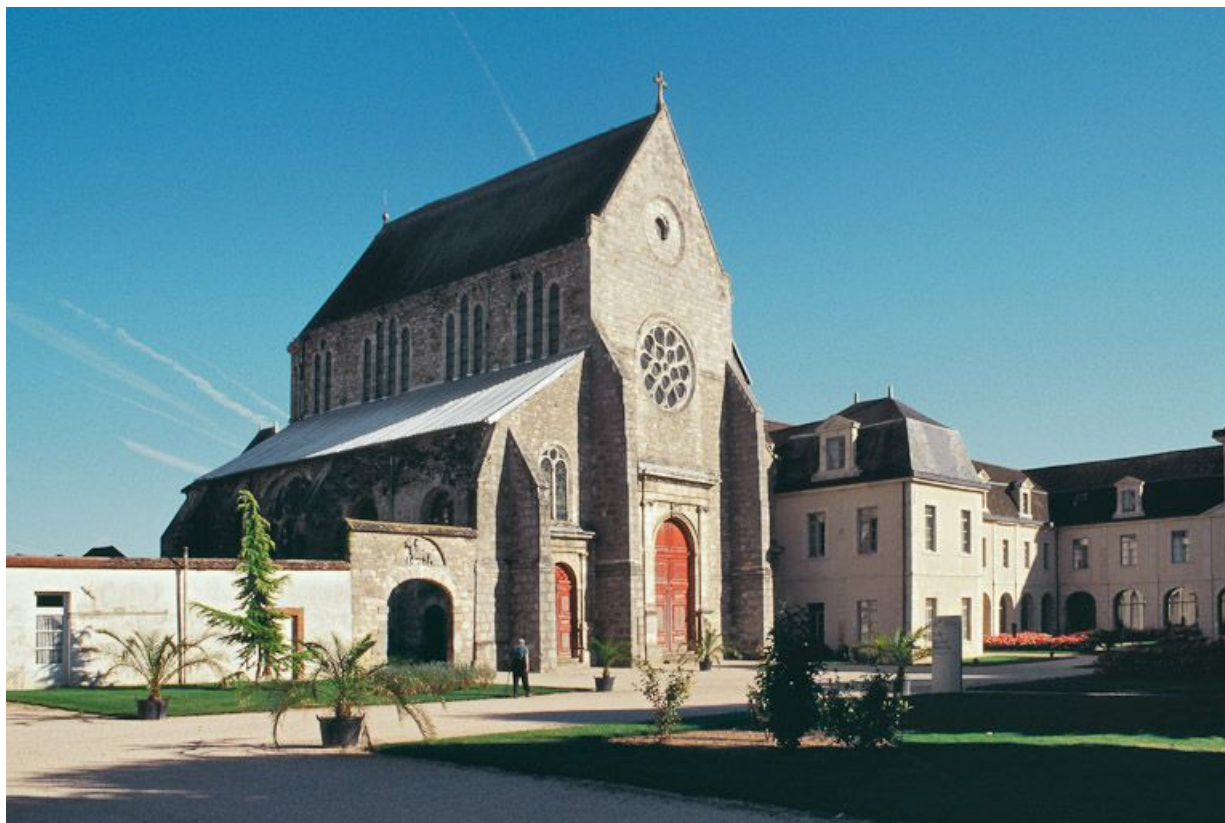
Vue de l'église et d'une partie du bâtiment en U.