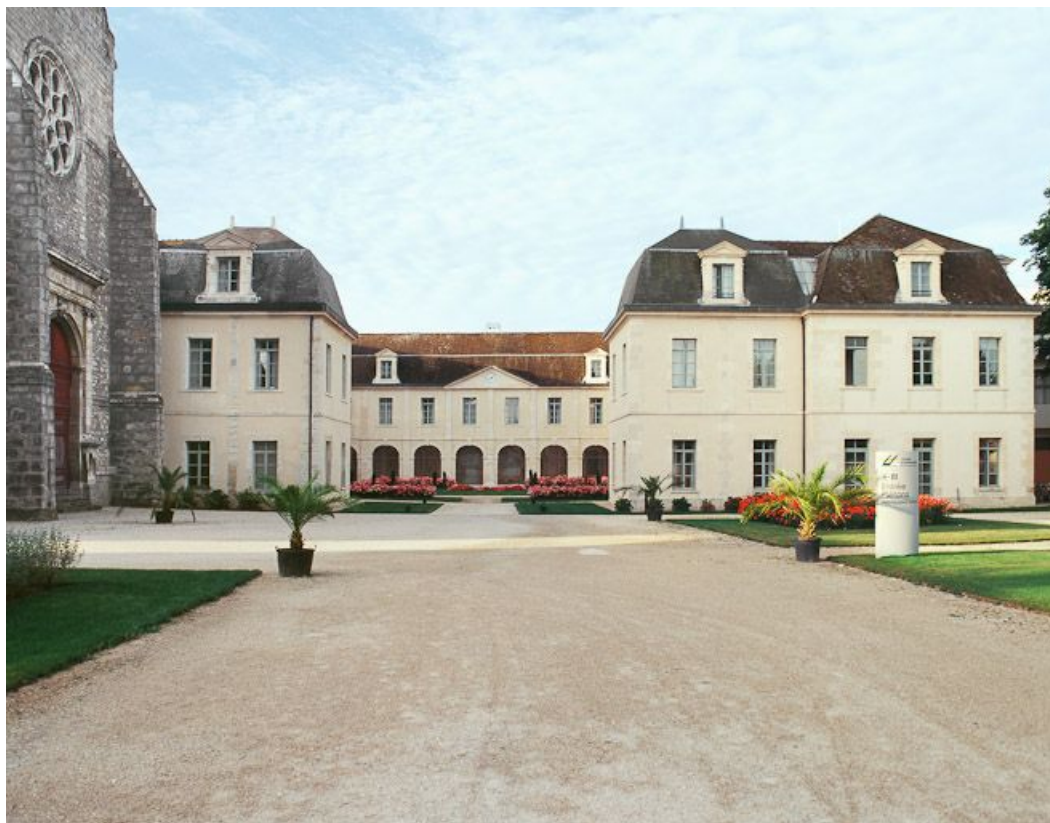
Vue d'ensemble depuis l'entrée de la cour intérieure.