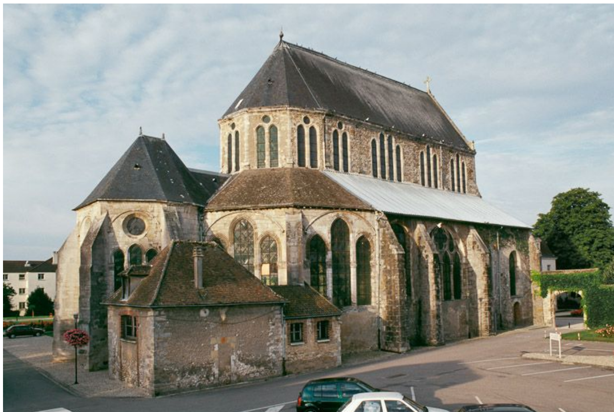
Vue des élévations nord et est de l'église.