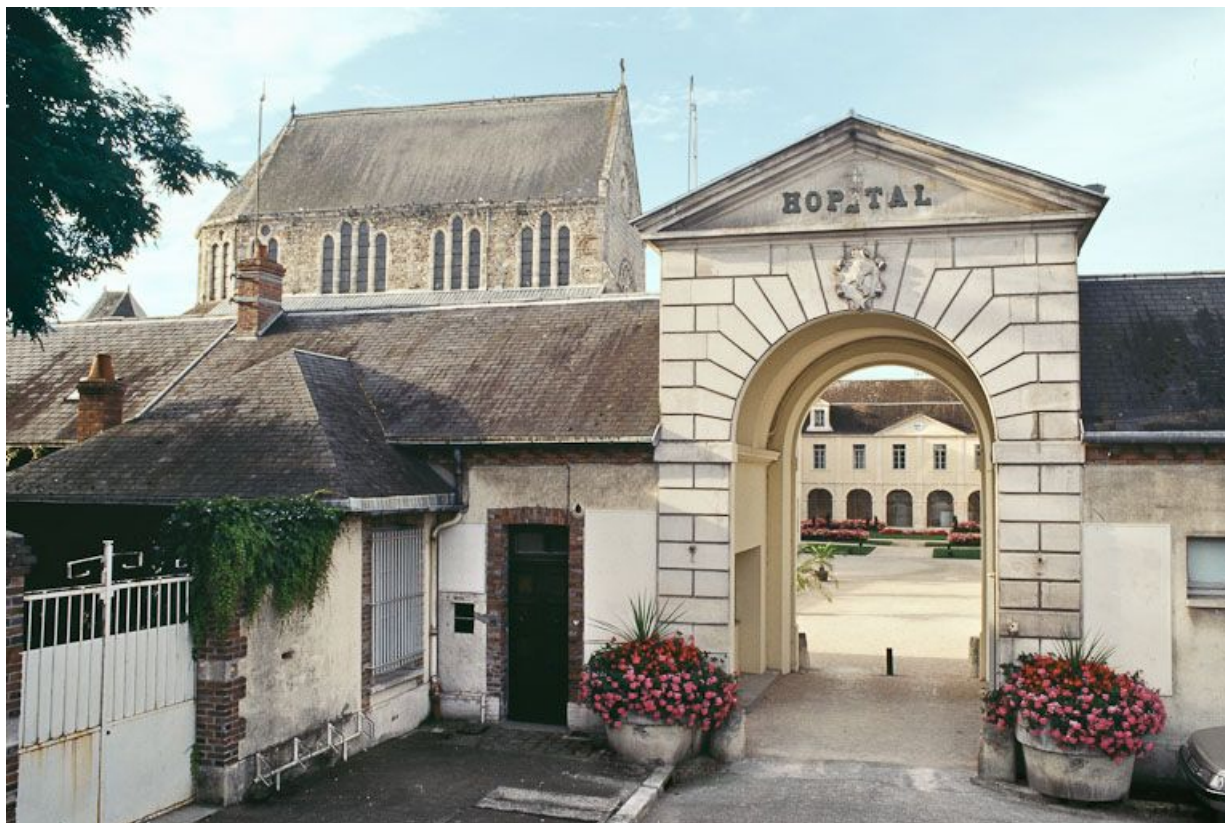
Vue d'ensemble avec le passage couvert donnant dans la cour intérieure.