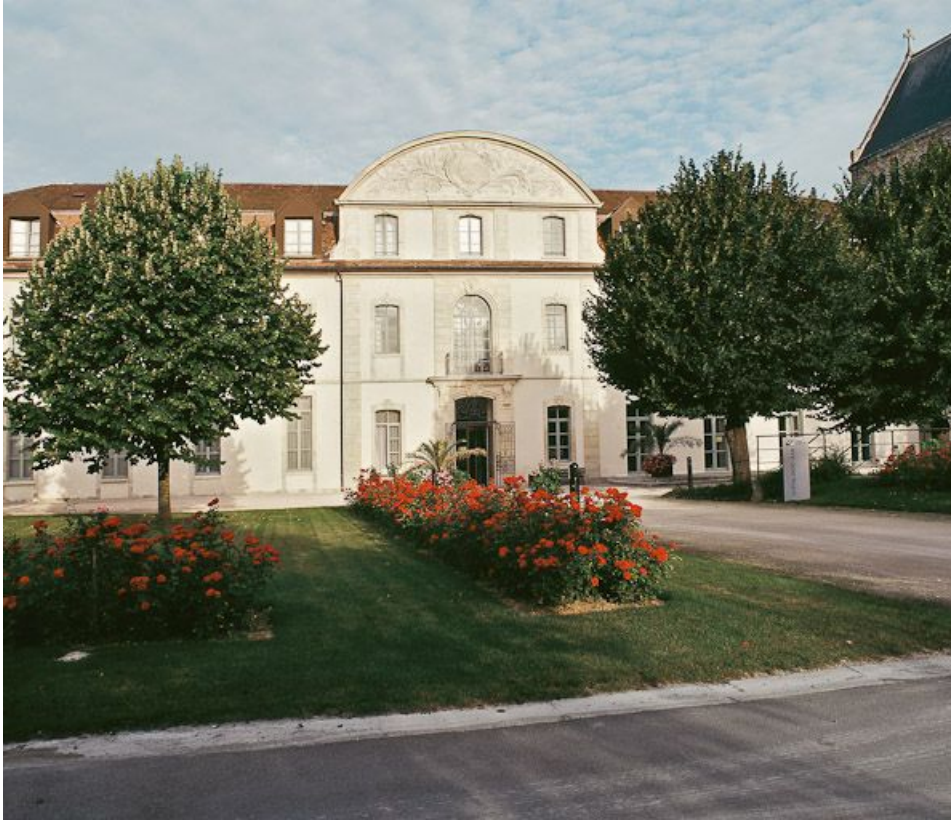
Façade est du corps gauche du bâtiment en U.