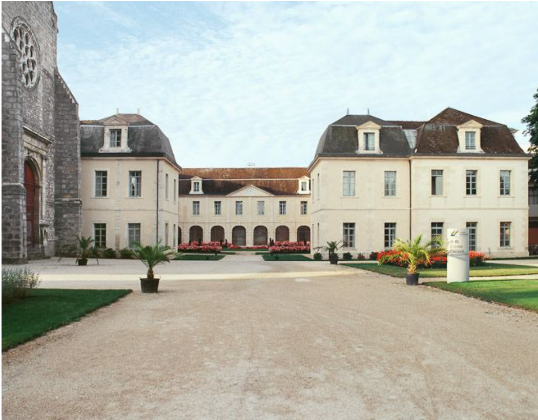
Vue d'ensemble depuis l'entrée de la cour intérieure.