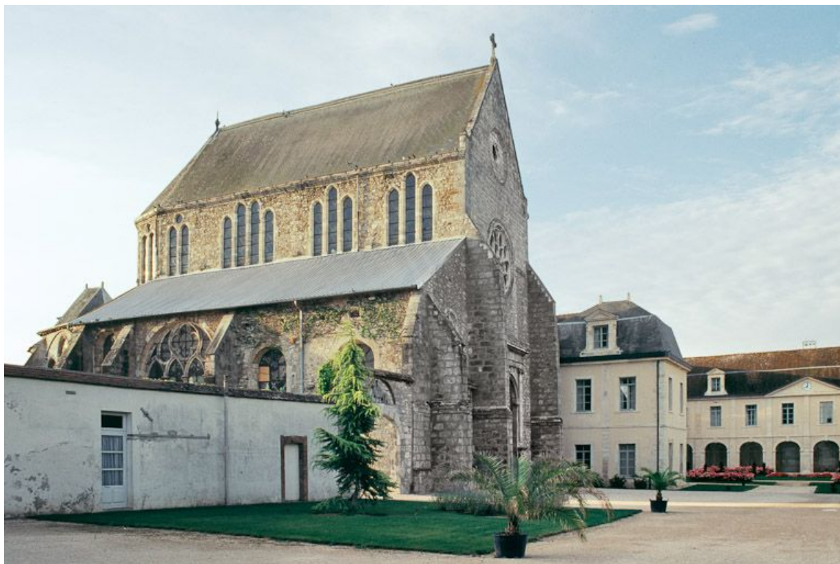
Vue de l'église et d'une partie du bâtiment en U.