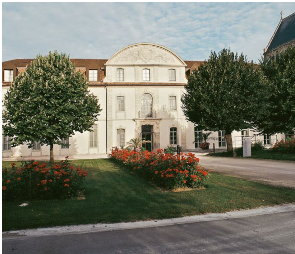
Façade est du corps gauche du bâtiment en U.