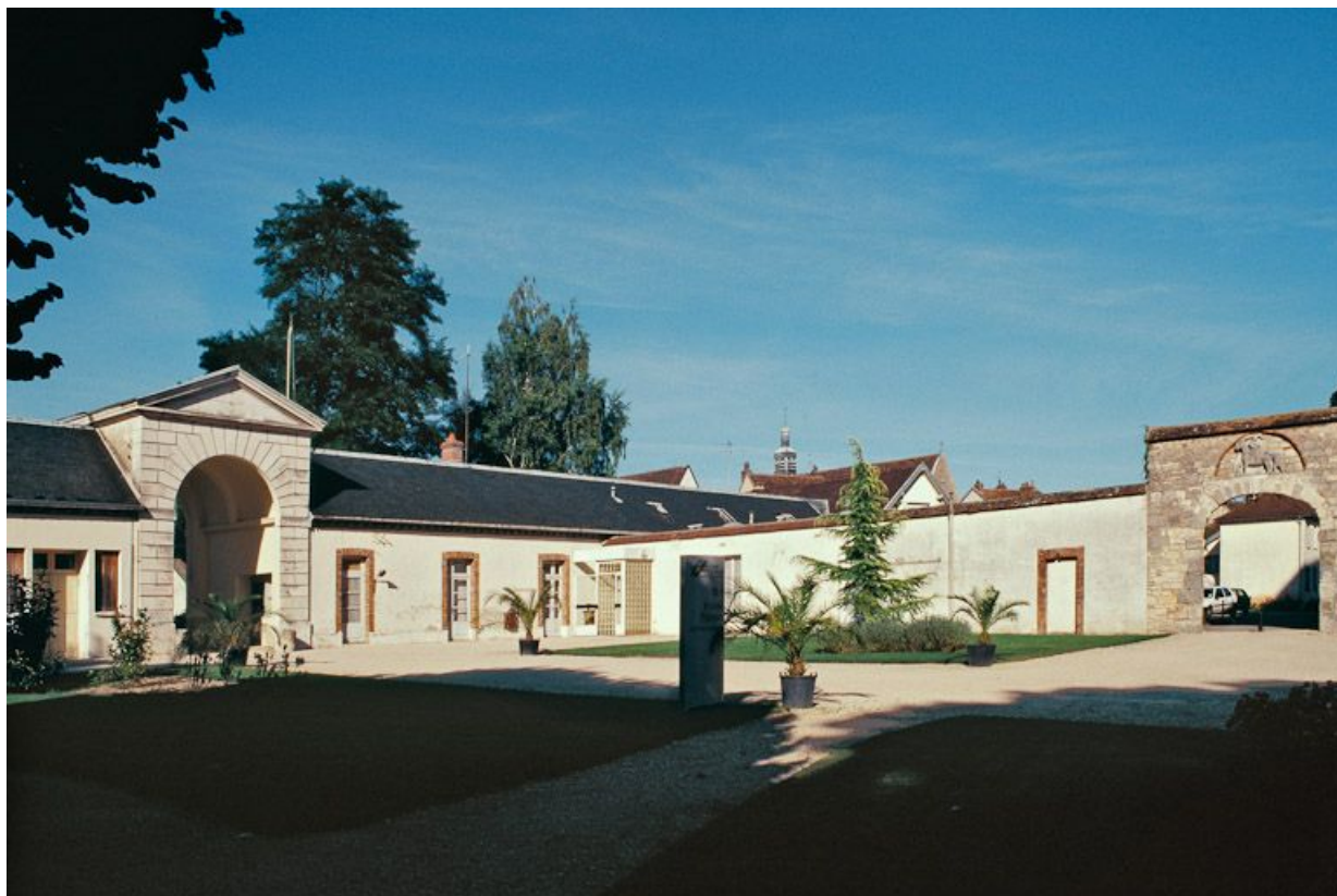
Vue d'ensemble de la première cour.