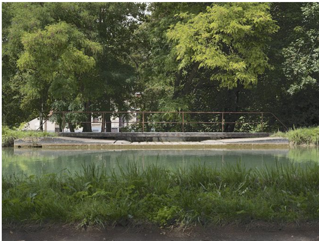
Détail du chemin de halage qui est prolongé par une passerelle métallique avec la maçonnerie du déversoir de superficie rive droite.

89, Migennes, lieudit : bief 113 du versant Yonne