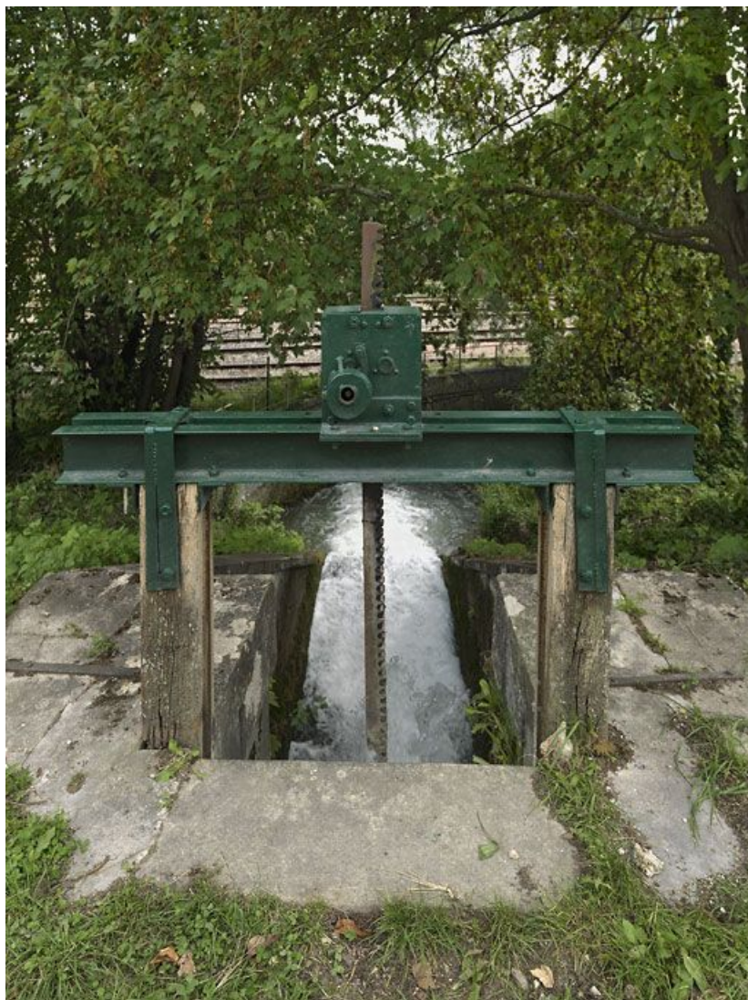
Détail de la vanne du déversoir de fond rive gauche.

89, Migennes, lieudit : bief 113 du versant Yonne