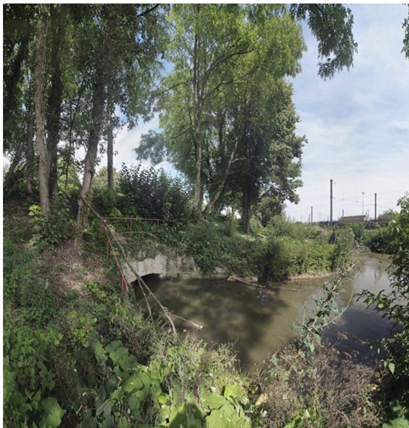
Sortie de l'aqueduc du ruisseau du Préblin et de sa jonction avec la rigole d'évacuation du déversoir.

89, Migennes, lieudit : bief 113 du versant Yonne