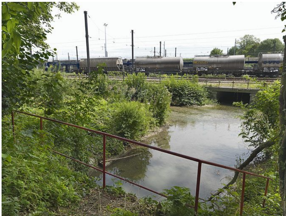
Sortie de l'aqueduc du ruisseau du Préblin, la rigole d'évacuation du canal le rejoint sur la gauche pour passer sous les voies ferrées.

89, Migennes, lieudit : bief 113 du versant Yonne