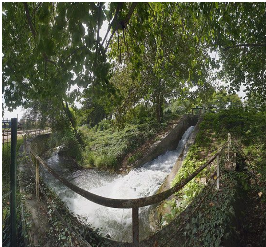
Vue d'ensemble de la rigole d'évacuation et de la vanne du déversoir de fond. 89, Migennes, lieudit : bief 113 du versant Yonne