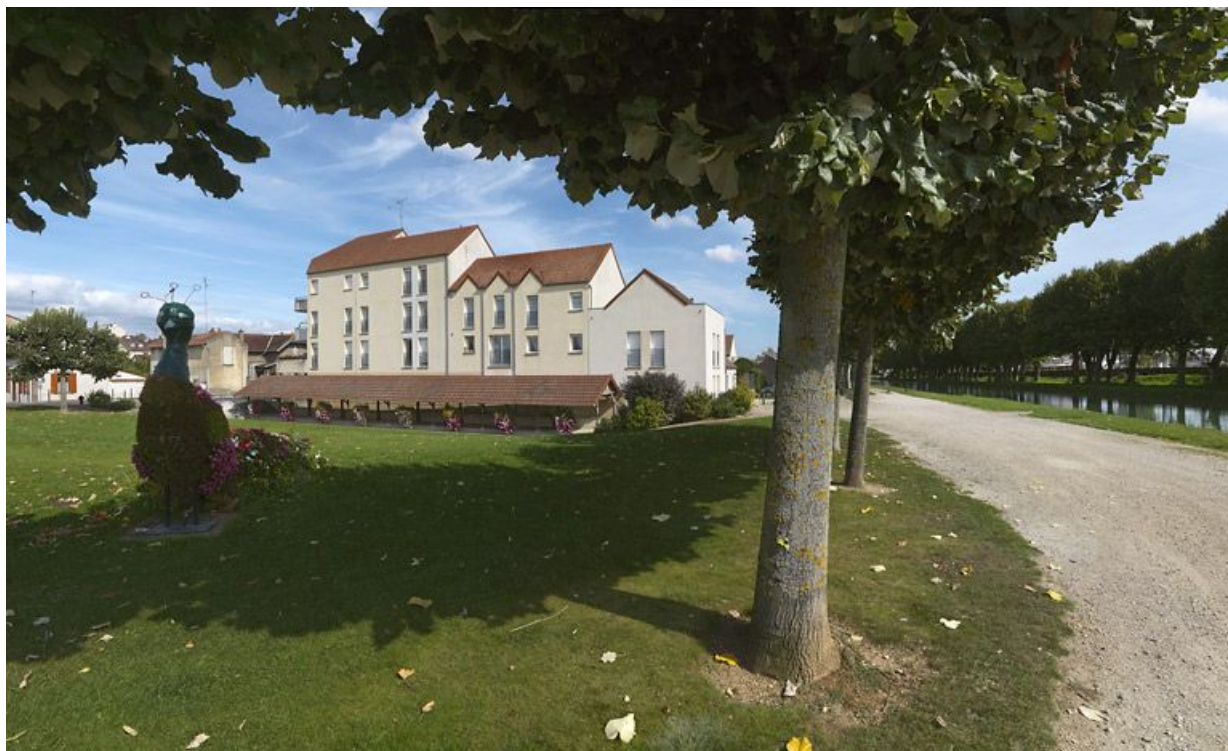
Vue d'ensemble : on voit nettement que le lavoir à gauche est en contrebas du canal, à droite de l'image. 89, Migennes, lieudit : bief 114-115 du versant Yonne