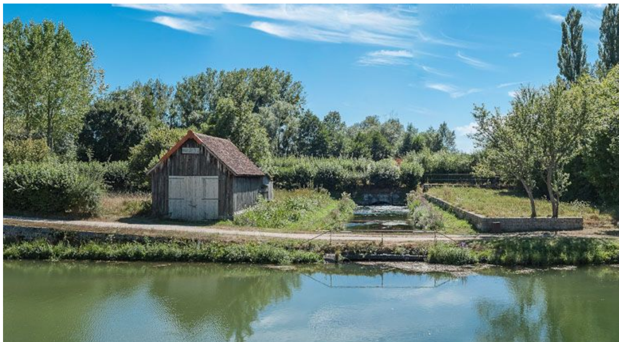
Le bassin lié à la prise d'eau d'Ancy-le-Franc. Remise à gauche du bassin.

89, Ancy-le-Franc, lieudit : bief 81 du versant Yonne