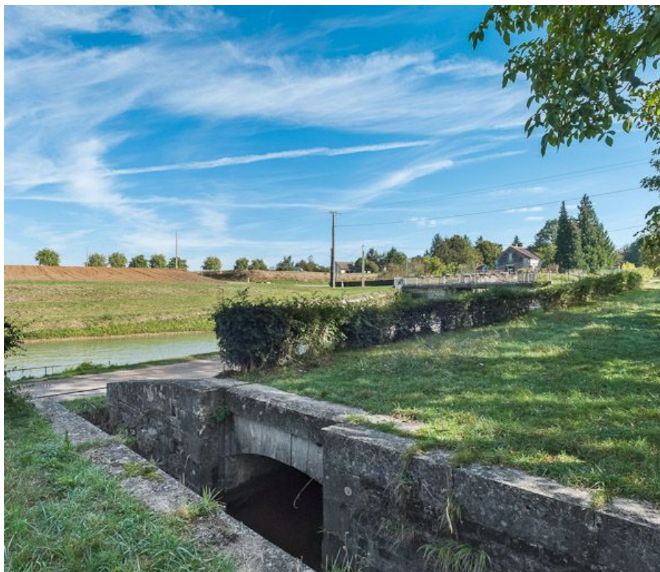
Détail de la maçonnerie de l'ancienne prise d'eau dans la rigole. Ecluse en arrière-plan.

89, Germigny, lieudit : bief 106-107 du versant Yonne