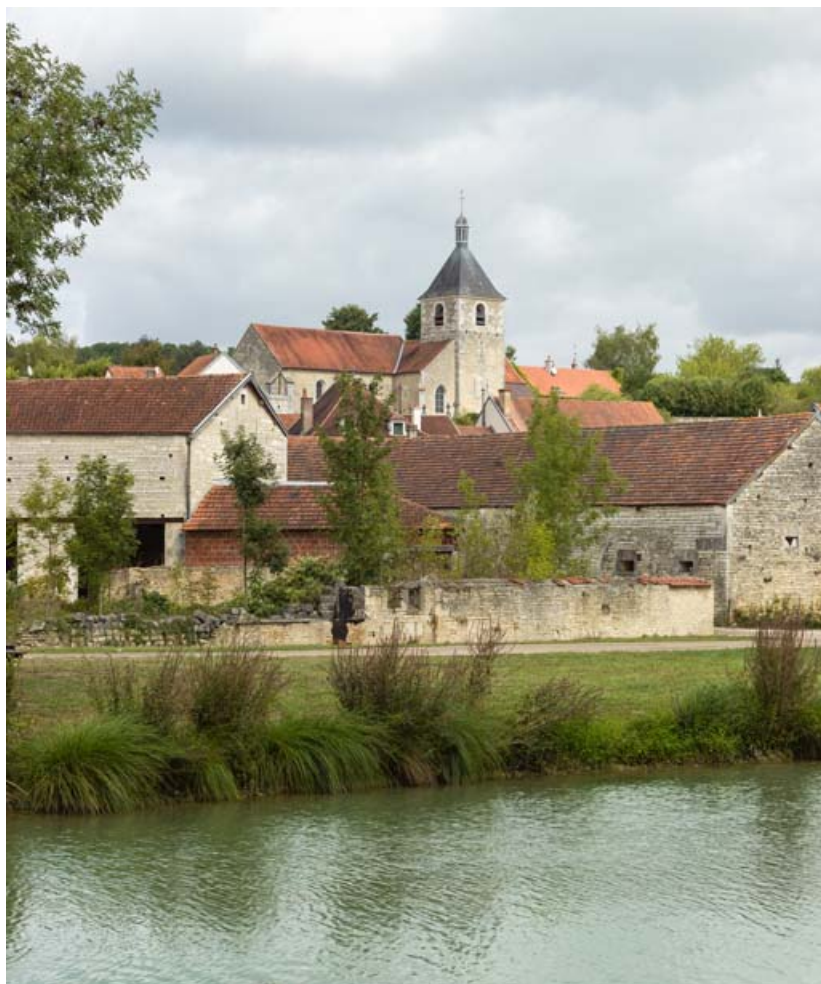
Vue rapprochée de l'église depuis le chemin de halage.