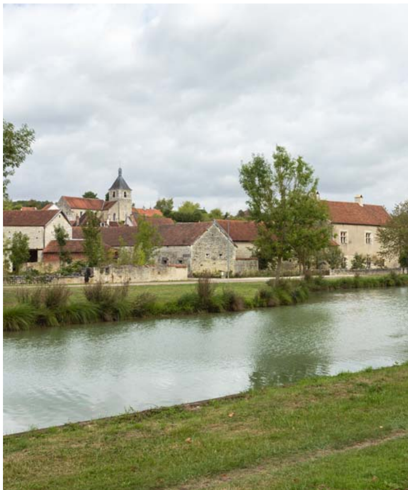
L'église vue du chemin de halage.