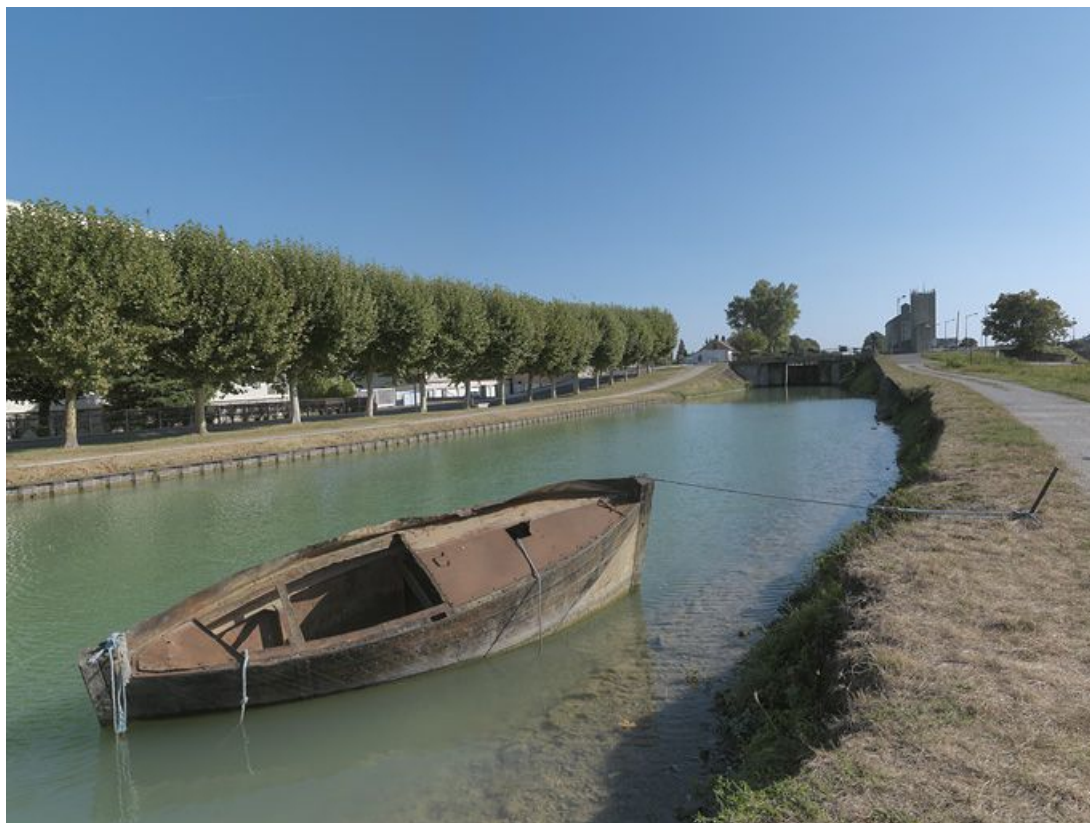
Bateau-écluse ou bateau-porte amarré dans le bief 114-115, en aval du pont sur l'écluse 113. 89, Migennes, lieudit : bief 114-115 du versant Yonne