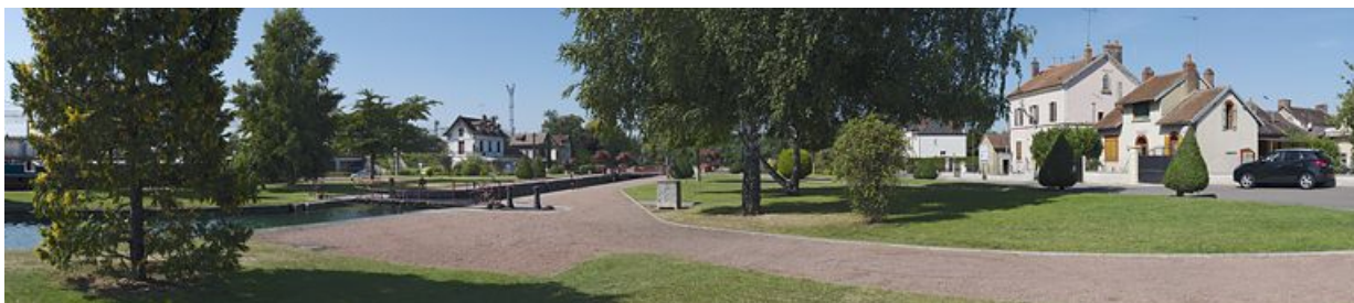
Panorama sur le site de l'écluse 114-115 du versant Yonne, dite de Laroche, à Migennes. De gauche à droite : site d'écluse, maisons de garde et de perception.