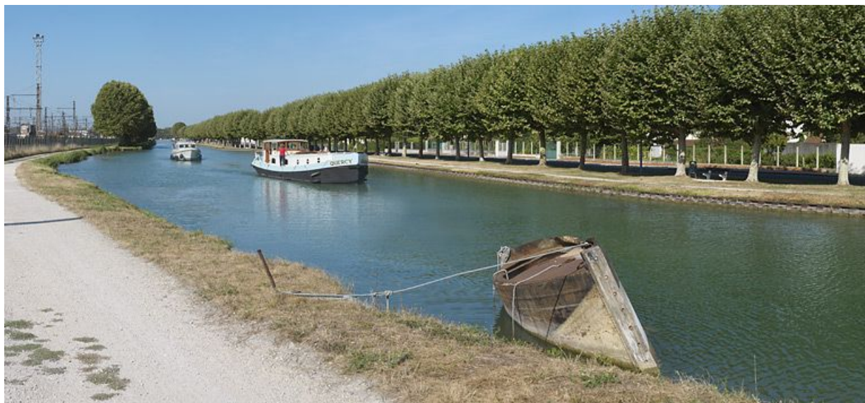
Bateau-écluse ou bateau-porte amarré dans le bief 114-115, en aval du pont sur l'écluse 113. 89, Migennes, lieudit : bief 114-115 du versant Yonne