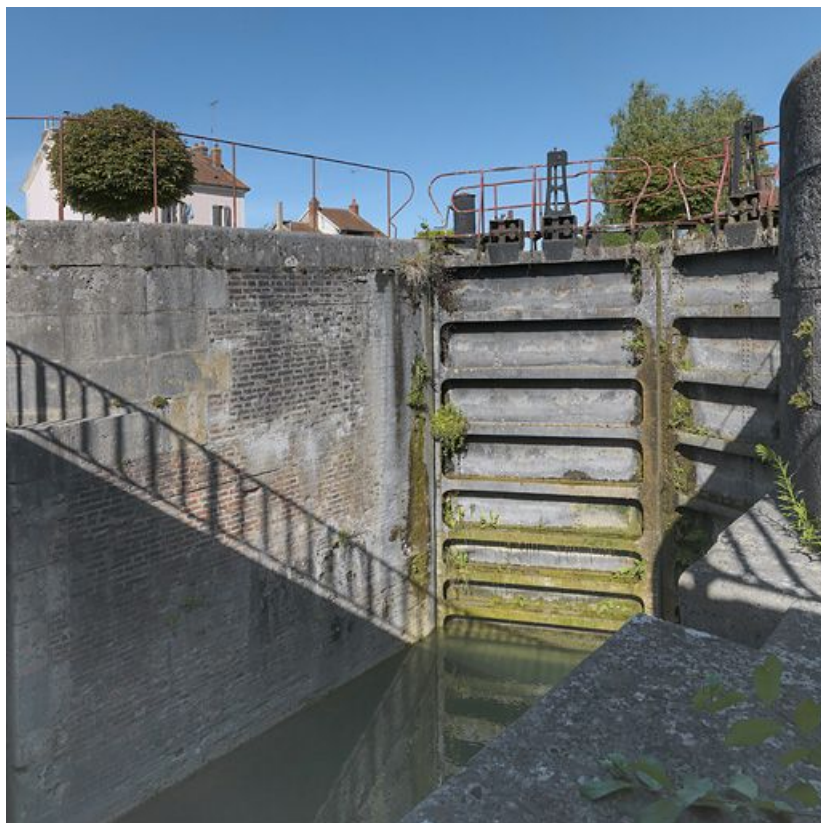
Site de l'écluse 114-115 du versant Yonne, dite de Laroche, à Migennes, vu d'amont : pris d'en bas, portes fermées 89, Migennes, lieudit : bief 114-115 du versant Yonne