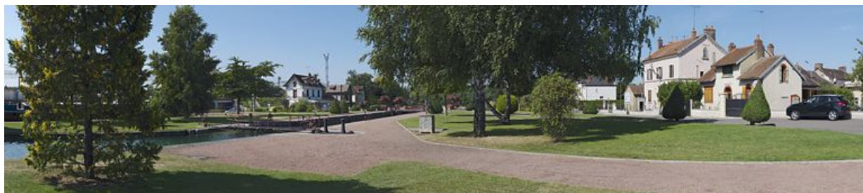
Panorama sur le site de l'écluse 114-115 du versant Yonne, dite de Laroche, à Migennes. De gauche à droite : site d'écluse, maisons de garde et de perception.

89, Migennes, lieudit : bief 114-115 du versant Yonne