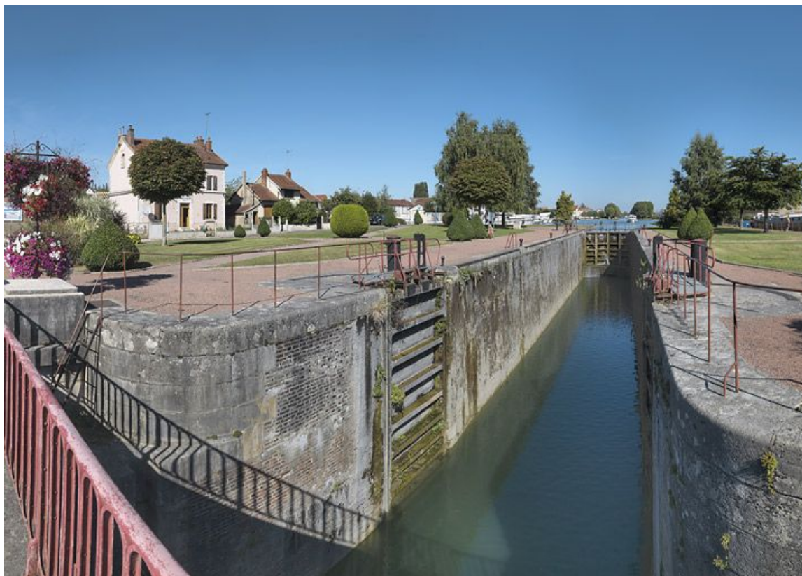
A Migennes, site de l'écluse 114-115 du versant Yonne, dite de Laroche, vu d'amont : portes et bajoyers. 89, Migennes, lieudit : bief 114-115 du versant Yonne