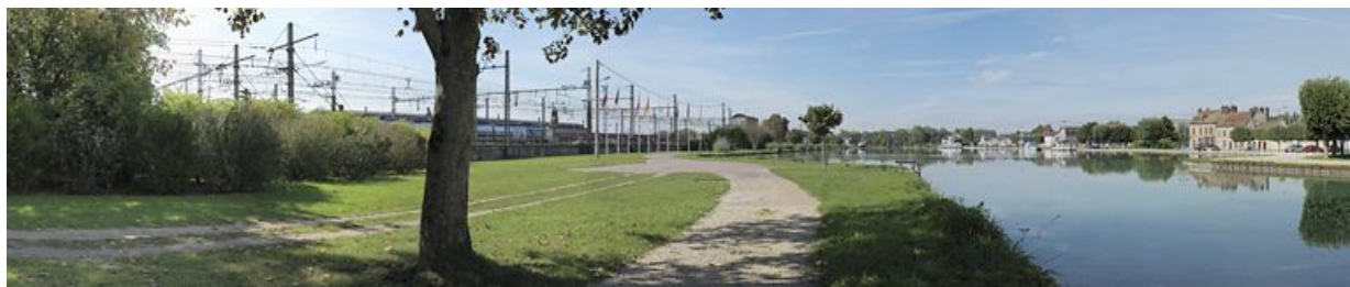
Vue d'ensemble du bassin prise d'amont : le site SNCF de Migennes est à droite de l'image, la ville de Migennes à gauche. 89, Migennes, lieudit : bief 114-115 du versant Yonne