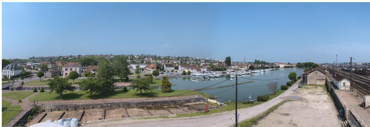
Grand panorama sur le port. De gauche à droite : le site d'écluse, flèche de l'église du Christ-Roi, port, le site SNCF. La cale sèche. 89, Migennes, lieudit : bief 114-115 du versant Yonne

N° de l'illustration : 20128900659NUC4AQ