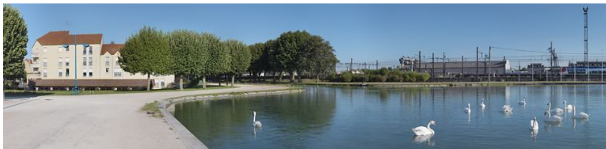
Entrée du port, vue du toit du lavoir. Le site SNCF à droite.

89, Migennes, lieudit : bief 114-115 du versant Yonne