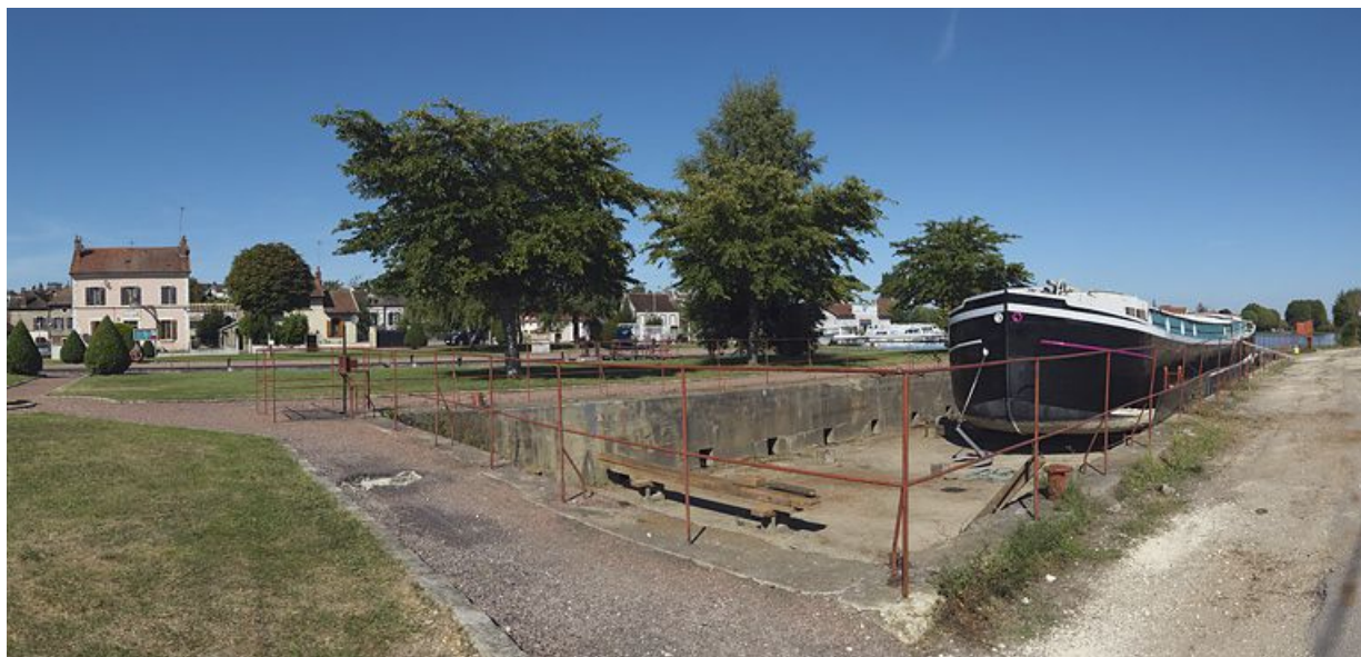
La cale sèche. A l'arrière-plan, les deux maisons du site d'écluse.

89, Migennes, lieudit : bief 114-115 du versant Yonne