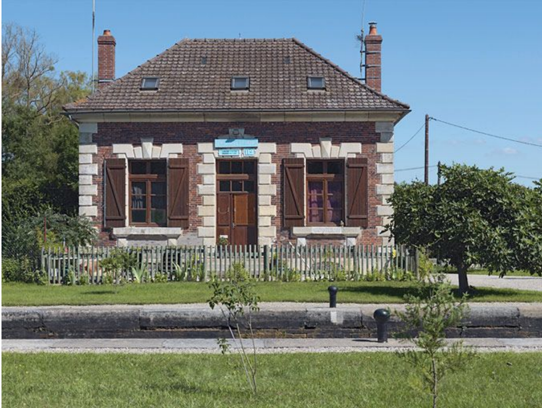
Maison éclusière : vue de face.

89, Brienon-sur-Armançon, lieudit : bief 112 du versant Yonne