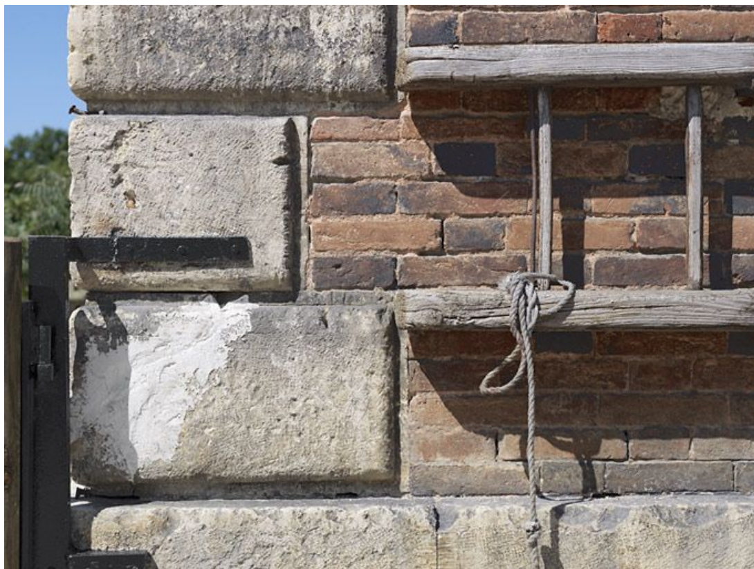
Maison éclusière : détail de la chaîne d'angle et de l'échelle fixée sur le côté.

89, Brienon-sur-Armançon, lieudit : bief 112 du versant Yonne