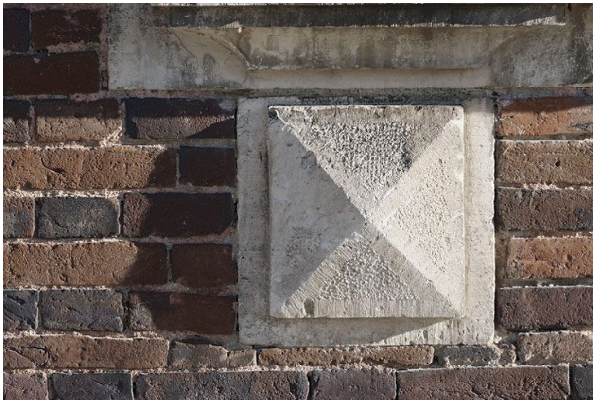
Maison éclusière : détail de la console en pointe de diamant sous la fenêtre.

89, Brienon-sur-Armançon, lieudit : bief 112 du versant Yonne