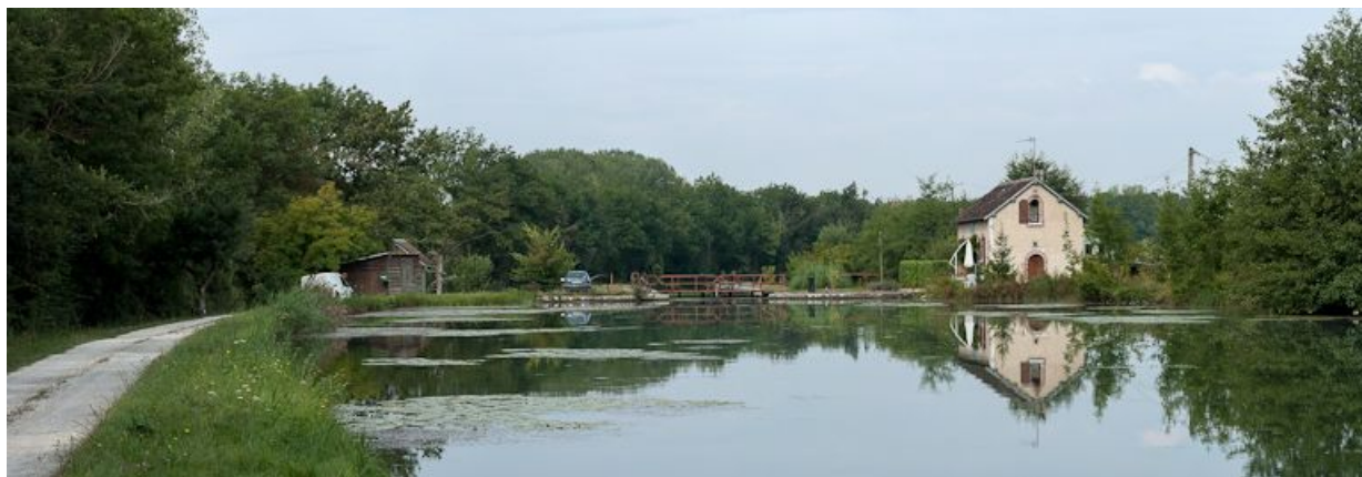
Vue d'ensemble du site d'écluse, avec à droite, la maison éclusière.

89, Flogny-la-Chapelle, lieudit : bief 101 du versant Yonne