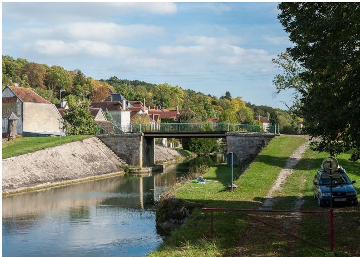
Vue d'ensemble du pont routier, avec le village à gauche.

89, Tronchoy, lieudit : bief 99 du versant Yonne