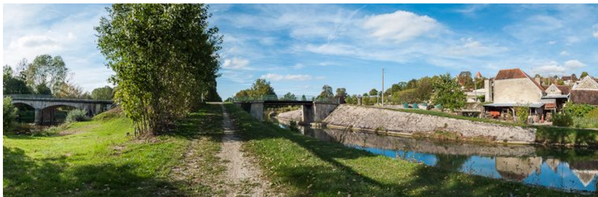
Vue d'ensemble du pont sur canal avec à gauche un pont sur l'Armançon.

89, Tronchoy, lieudit : bief 99 du versant Yonne