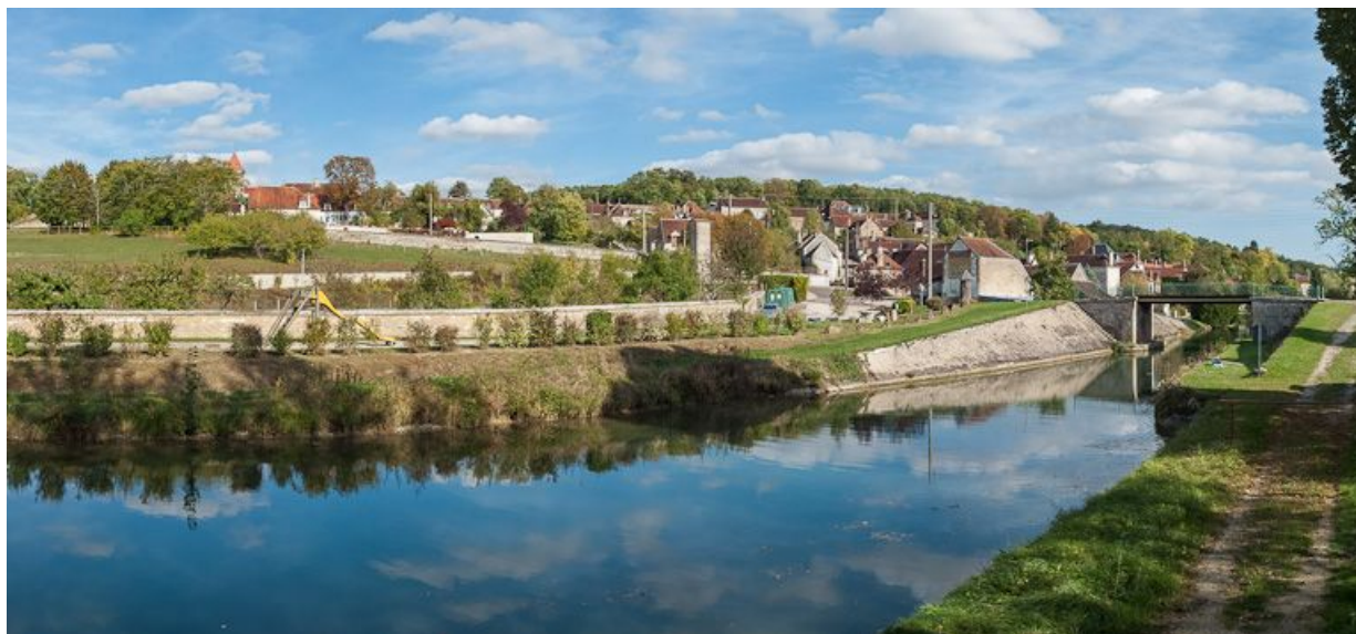
Vue d'ensemble du village. Dans le fond à droite, le pont.

89, Tronchoy, lieudit : bief 99 du versant Yonne