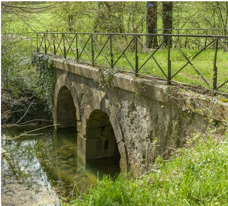
Pont en pierre sur l'Armançon prolongeant le pont sur canal d'Epineuil.

89, Tonnerre, lieudit : bief 97 du versant Yonne