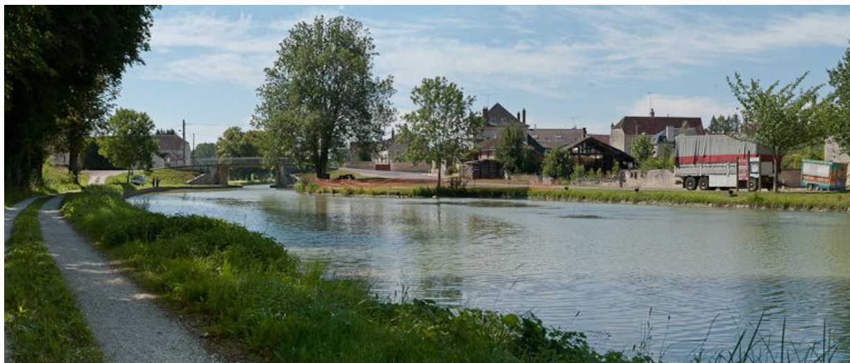
Vue du port au premier plan et du pont à l'arrière-plan.