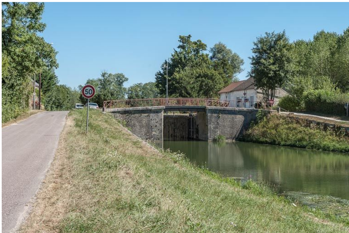
Vue d'ensemble du pont sur écluse, prise d'aval. 89, Ancy-le-Franc, lieudit : bief 80 du versant Yonne

N° de l'illustration : 20128900476NUC2AQ