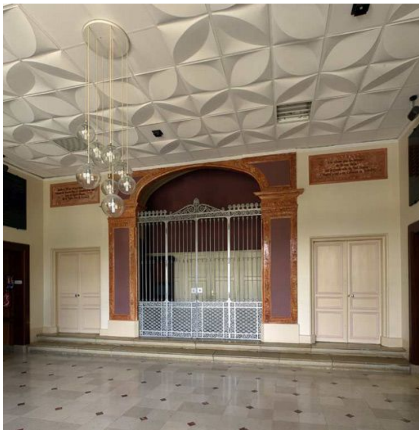
Pavillon Dormois : corps central, salle d'accueil et entrée de la chapelle. 89, Tonnerre Hôpital