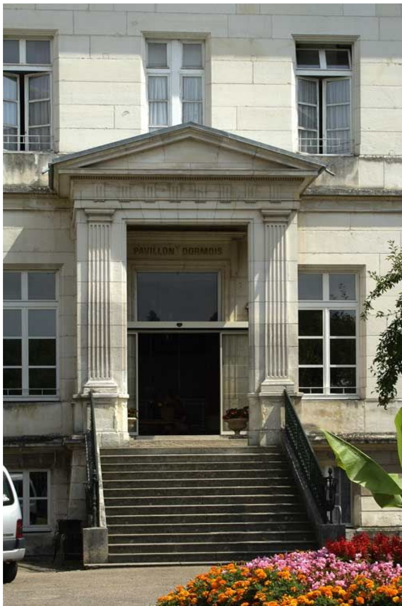
Pavillon Dormois : détail de la porte d'entrée de la façade antérieure. 89, Tonnerre Hôpital