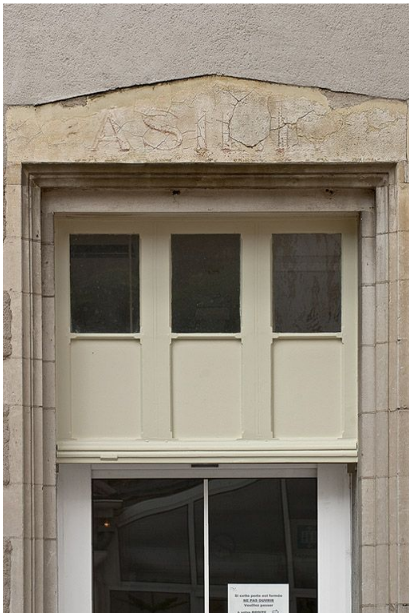
Détail de l'encadrement de la porte d'entrée de la façade sud du bâtiment de l'angle nord-est. 89, Villeneuve-sur-Yonne, 87-89 rue Carnot