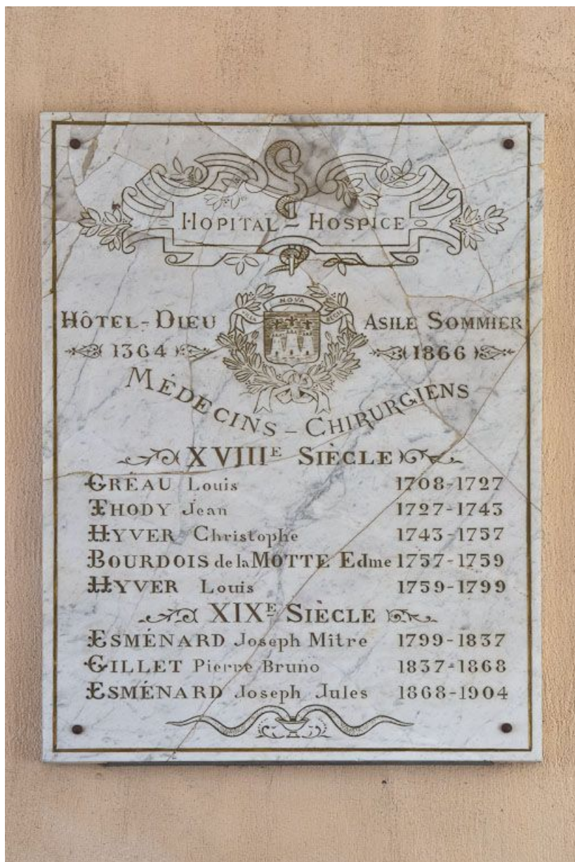
Plaque commémorative des médecins de l'hôpital.

89, Villeneuve-sur-Yonne, 87-89 rue Carnot