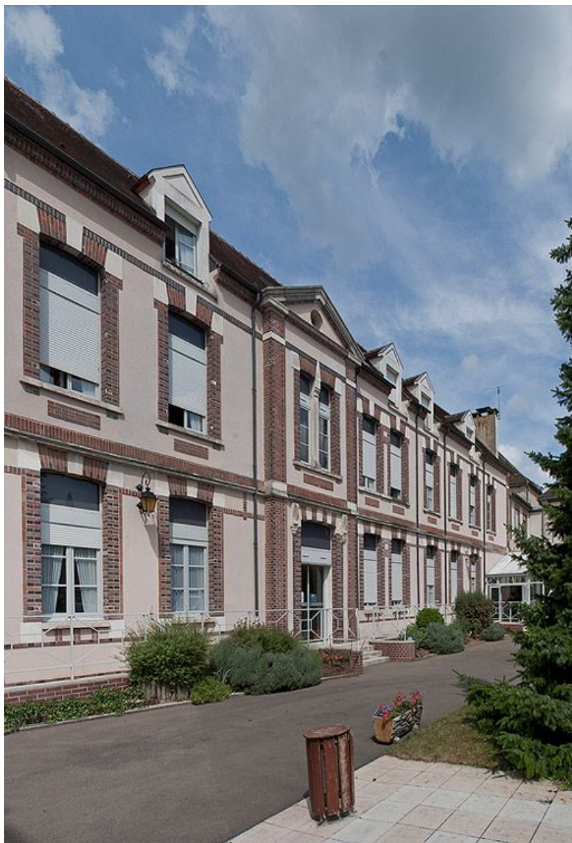
Bâtiment nord, façade sur cour.

89, Villeneuve-sur-Yonne, 87-89 rue Carnot