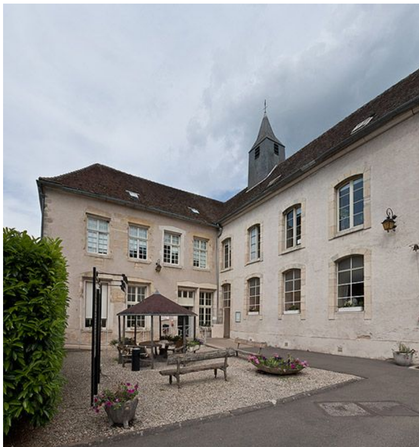
Angle de la cour formé par la façade sud du bâtiment nord-est et celle du bâtiment est. 89, Villeneuve-sur-Yonne, 87-89 rue Carnot