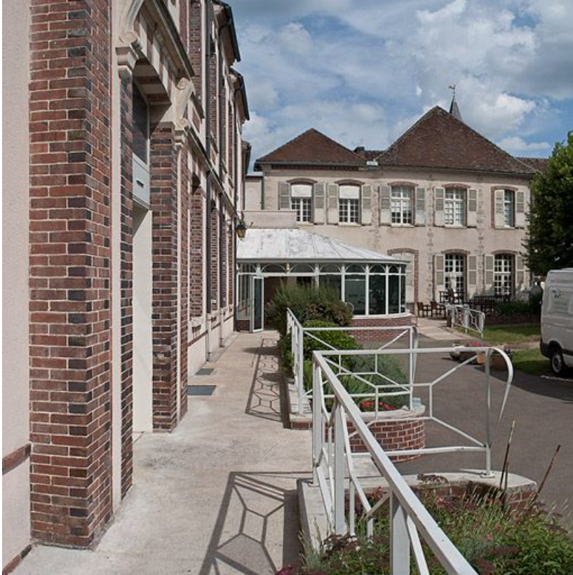
Façade sur cour du bâtiment situé dans l'angle nord-est.

89, Villeneuve-sur-Yonne, 87-89 rue Carnot