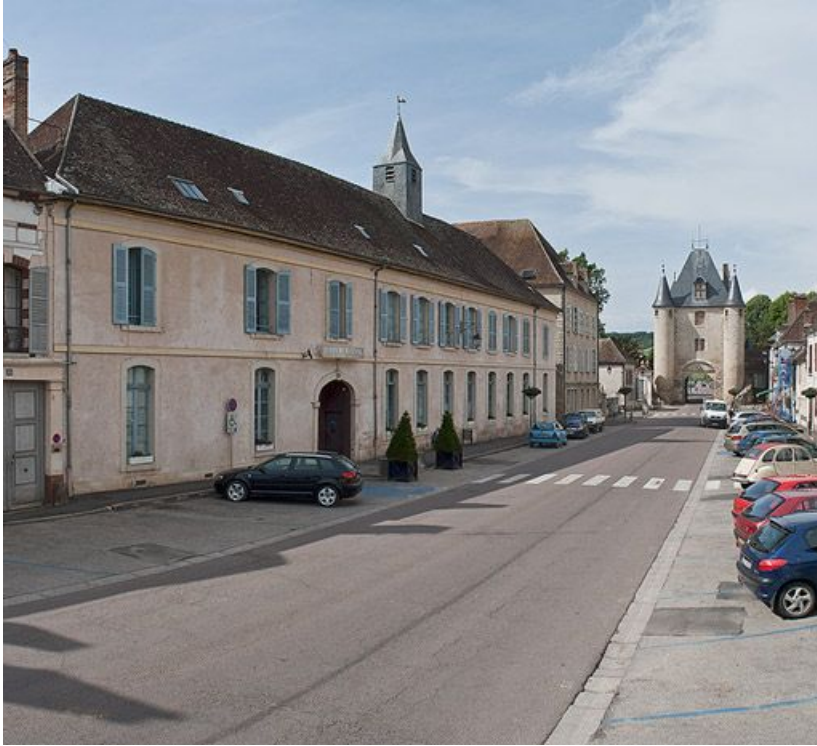
Bâtiment est, façade sur rue.

89, Villeneuve-sur-Yonne, 87-89 rue Carnot