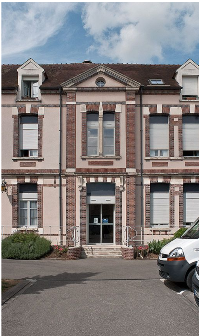
Bâtiment nord, travée centrale sur cour. 89, Villeneuve-sur-Yonne, 87-89 rue Carnot