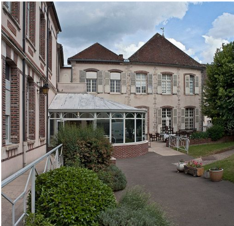
Façade sur cour du bâtiment situé dans l'angle nord-est.

89, Villeneuve-sur-Yonne, 87-89 rue Carnot