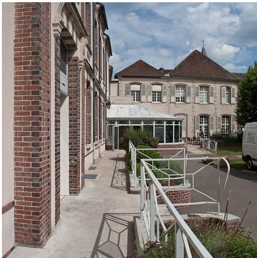
Façade sur cour du bâtiment situé dans l'angle nord-est.

89, Villeneuve-sur-Yonne, 87-89 rue Carnot