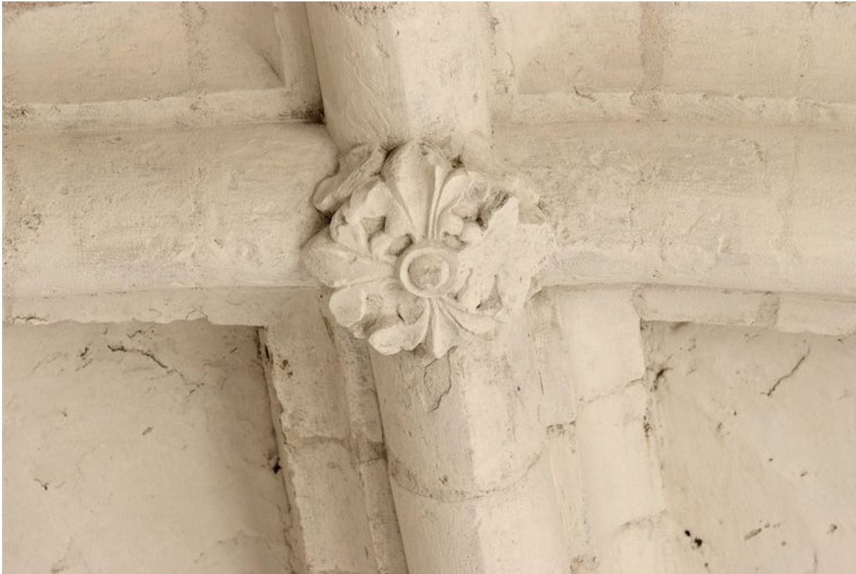
Clé sculptée de la voûte d'ogives de la chapelle.

89, Saint-Julien-du-Sault Chemin rural de la Ferme de la Maladrerie à Charmoy, lieudit : la Maladrerie