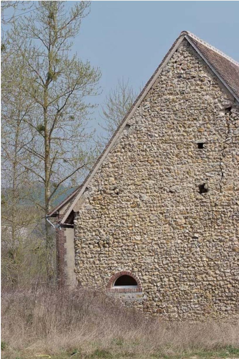
Mur-pignon du bâtiment à gauche en entrant, appareil en silex.

89, Saint-Julien-du-Sault Chemin rural de la Ferme de la Maladrerie à Charmoy, lieudit : la Maladrerie