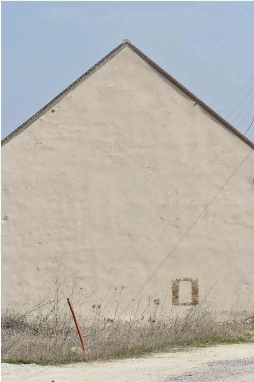
Mur-pignon du bâtiment à droite du portail d'entrée.

89, Saint-Julien-du-Sault Chemin rural de la Ferme de la Maladrerie à Charmoy, lieudit : la Maladrerie