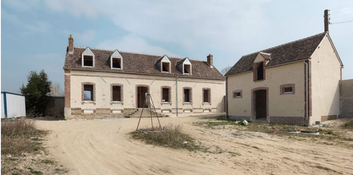
Logis au fond de la cour et petite dépendance à droite.

89, Saint-Julien-du-Sault Chemin rural de la Ferme de la Maladrerie à Charmoy, lieudit : la Maladrerie