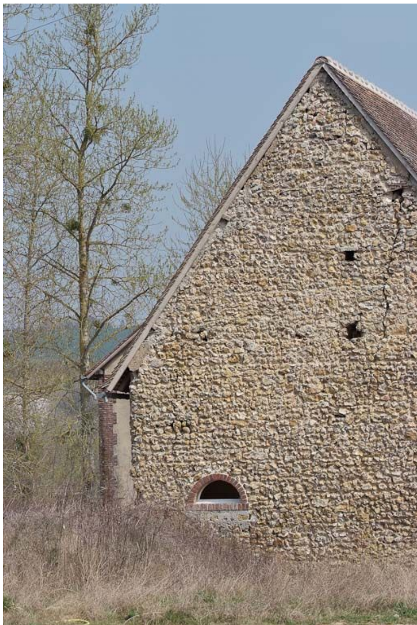
Mur-pignon du bâtiment à gauche en entrant, appareil en silex.

89, Saint-Julien-du-Sault Chemin rural de la Ferme de la Maladrerie à Charmoy, lieudit : la Maladrerie