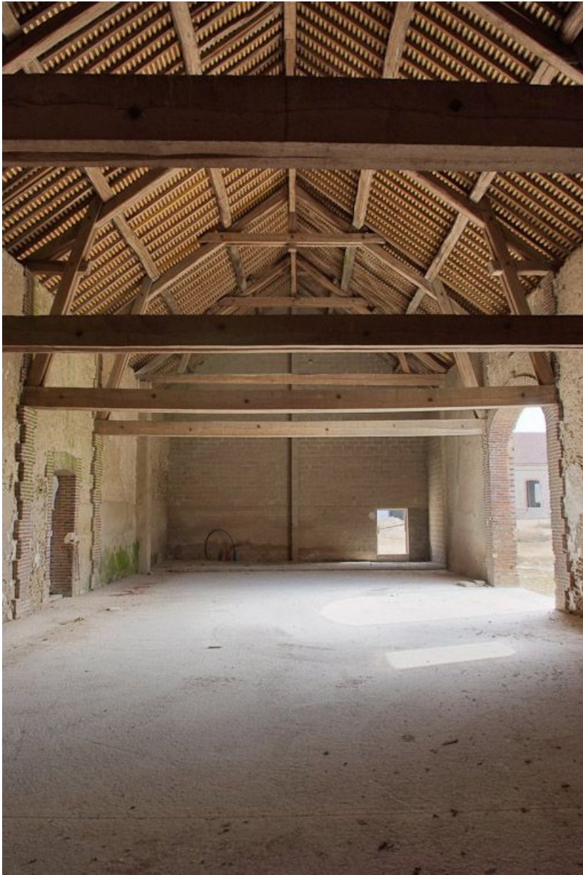
Bâtiment d'exploitation gauche, vue intérieure.

89, Saint-Julien-du-Sault Chemin rural de la Ferme de la Maladrerie à Charmoy, lieudit : la Maladrerie