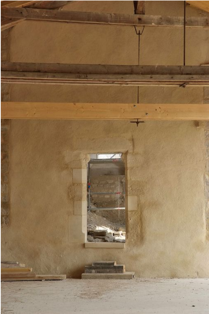
Détail de l'ouverture dans le mur sud de la chapelle.

89, Saint-Julien-du-Sault Chemin rural de la Ferme de la Maladrerie à Charmoy, lieudit : la Maladrerie