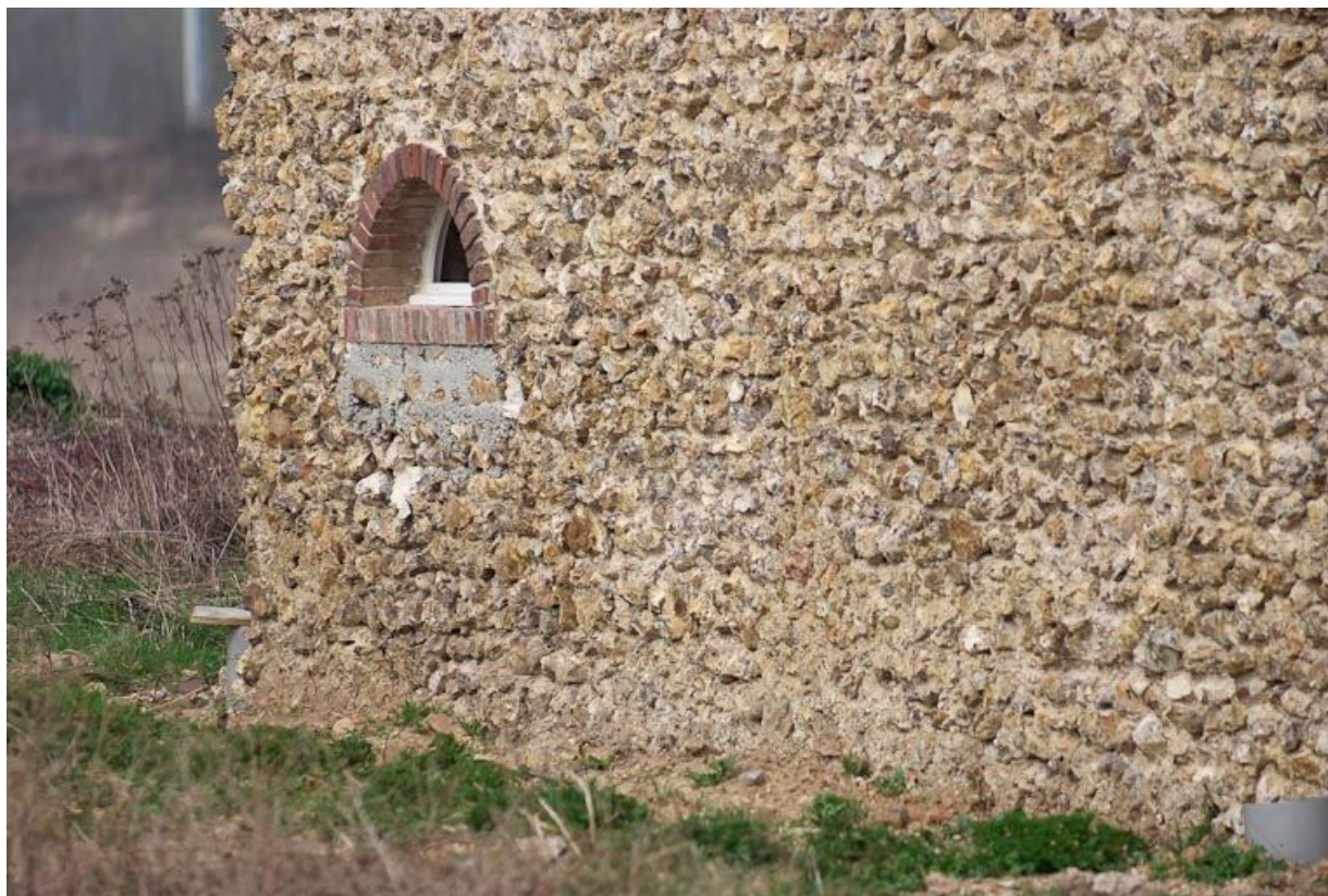
Détail du pignon du bâtiment à gauche du portail d'entrée.

89, Saint-Julien-du-Sault Chemin rural de la Ferme de la Maladrerie à Charmoy, lieudit : la Maladrerie