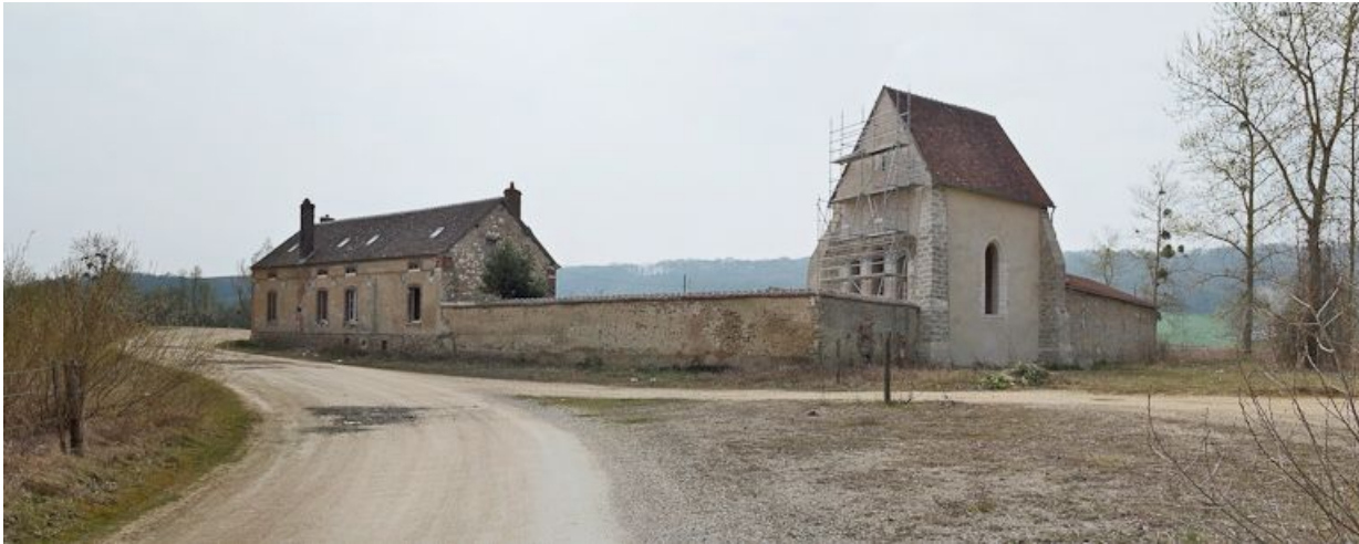
Vue de l'ensemble prise du nord.

89, Saint-Julien-du-Sault Chemin rural de la Ferme de la Maladrerie à Charmoy, lieudit : la Maladrerie