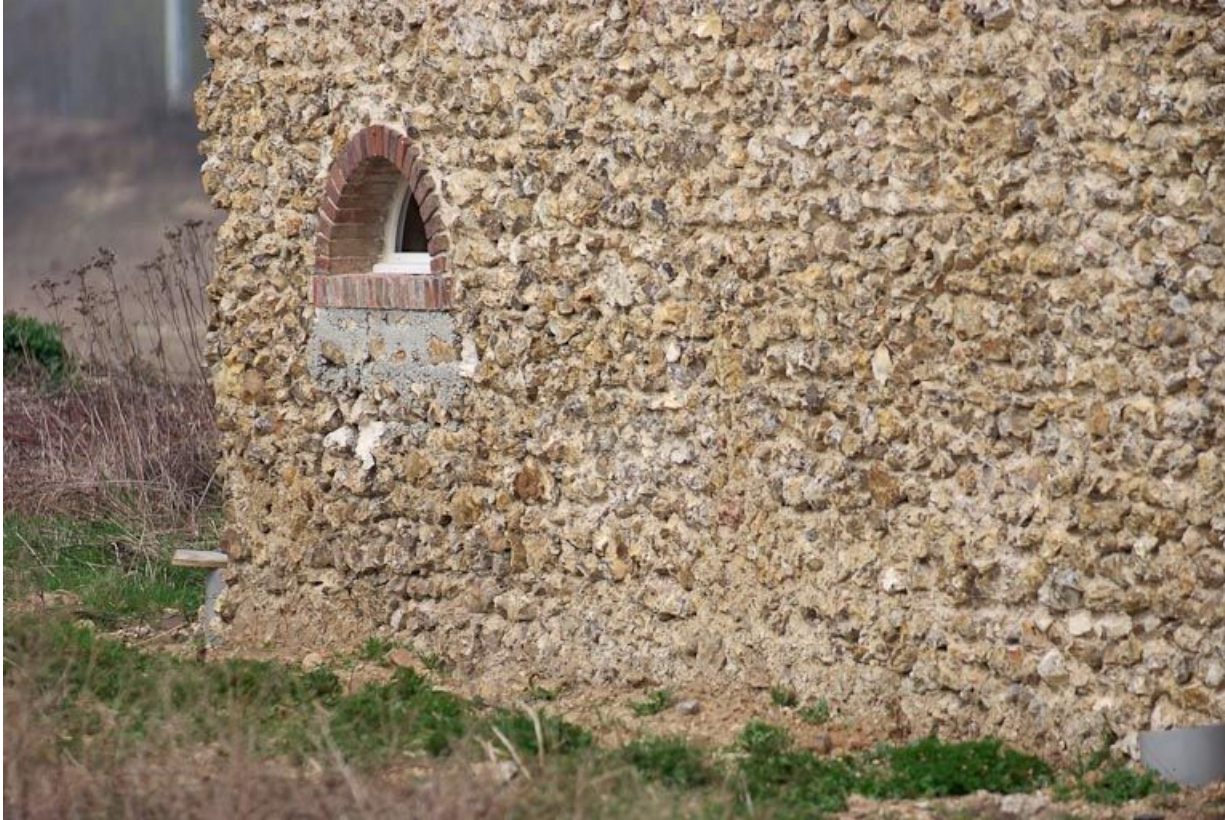
Détail du pignon du bâtiment à gauche du portail d'entrée.

89, Saint-Julien-du-Sault Chemin rural de la Ferme de la Maladrerie à Charmoy, lieudit : la Maladrerie