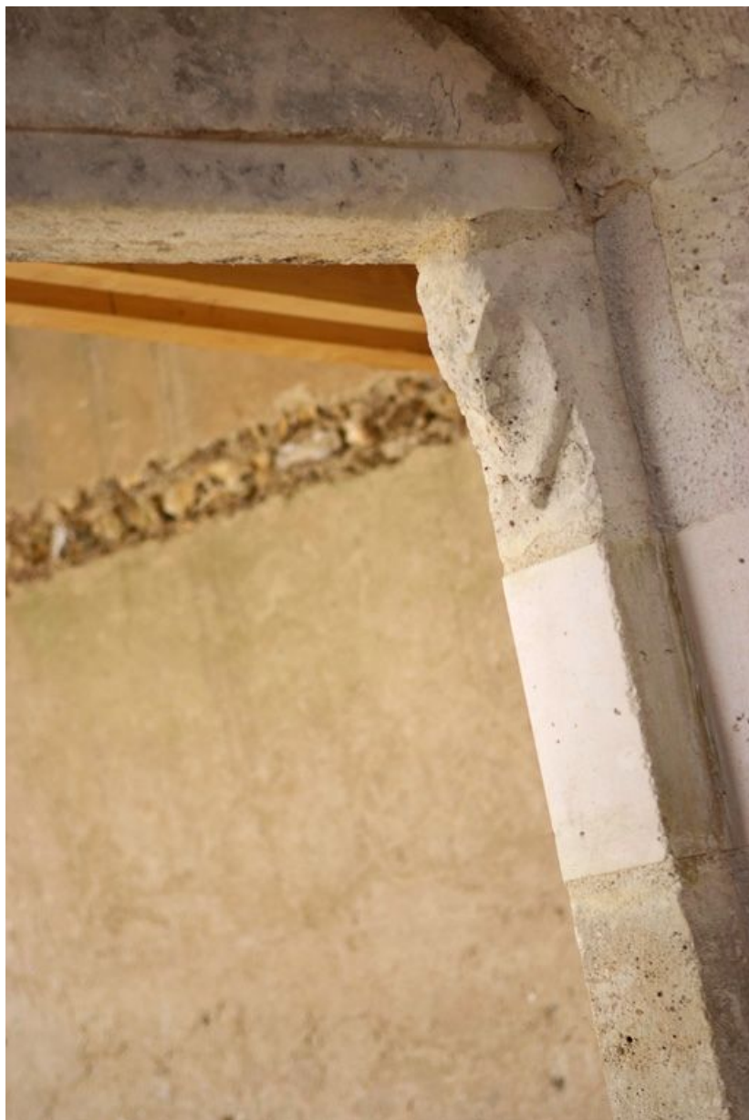
Détail du coussinet de l'ouverture dans le mur sud de la chapelle.

89, Saint-Julien-du-Sault Chemin rural de la Ferme de la Maladrerie à Charmoy, lieudit : la Maladrerie