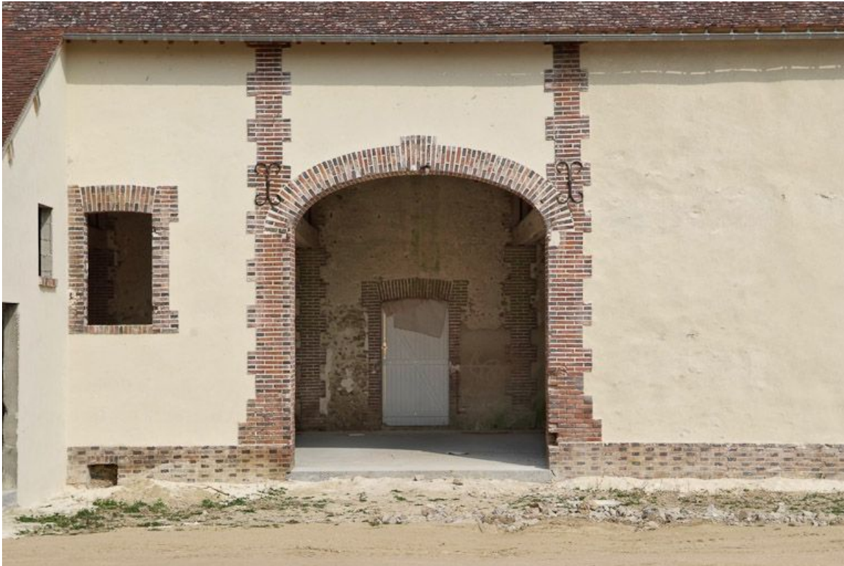
Bâtiment avec appentis à gauche dans la cour, porte charretière.

89, Saint-Julien-du-Sault Chemin rural de la Ferme de la Maladrerie à Charmoy, lieudit : la Maladrerie