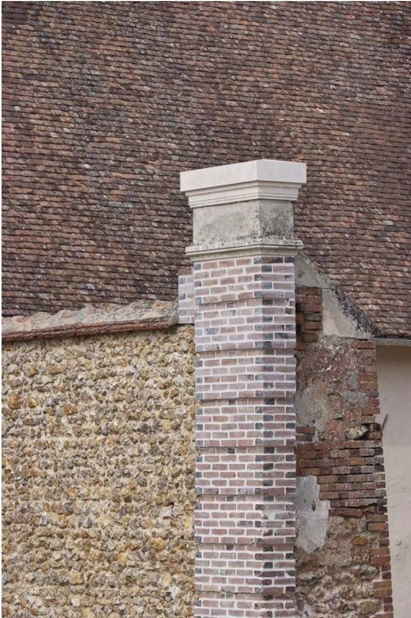
Pilier gauche du portail.

89, Saint-Julien-du-Sault Chemin rural de la Ferme de la Maladrerie à Charmoy, lieudit : la Maladrerie