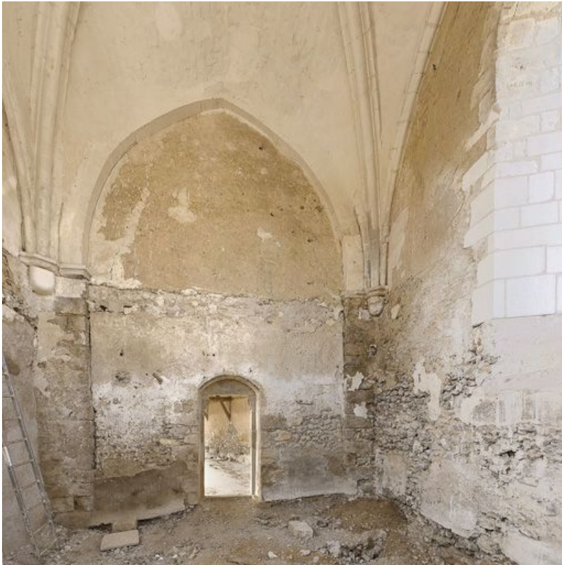
Chapelle, vue intérieure.

89, Saint-Julien-du-Sault Chemin rural de la Ferme de la Maladrerie à Charmoy, lieudit : la Maladrerie