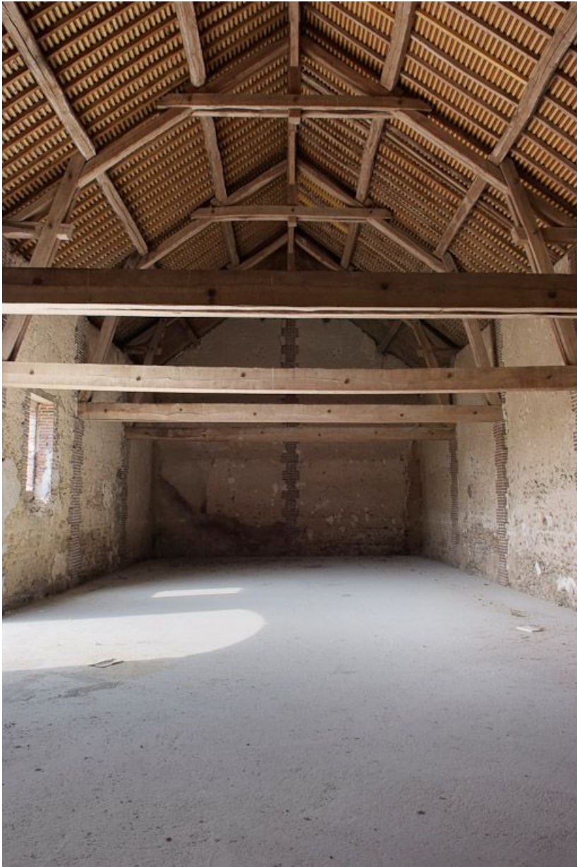
Bâtiment d'exploitation gauche, vue intérieure.

89, Saint-Julien-du-Sault Chemin rural de la Ferme de la Maladrerie à Charmoy, lieudit : la Maladrerie