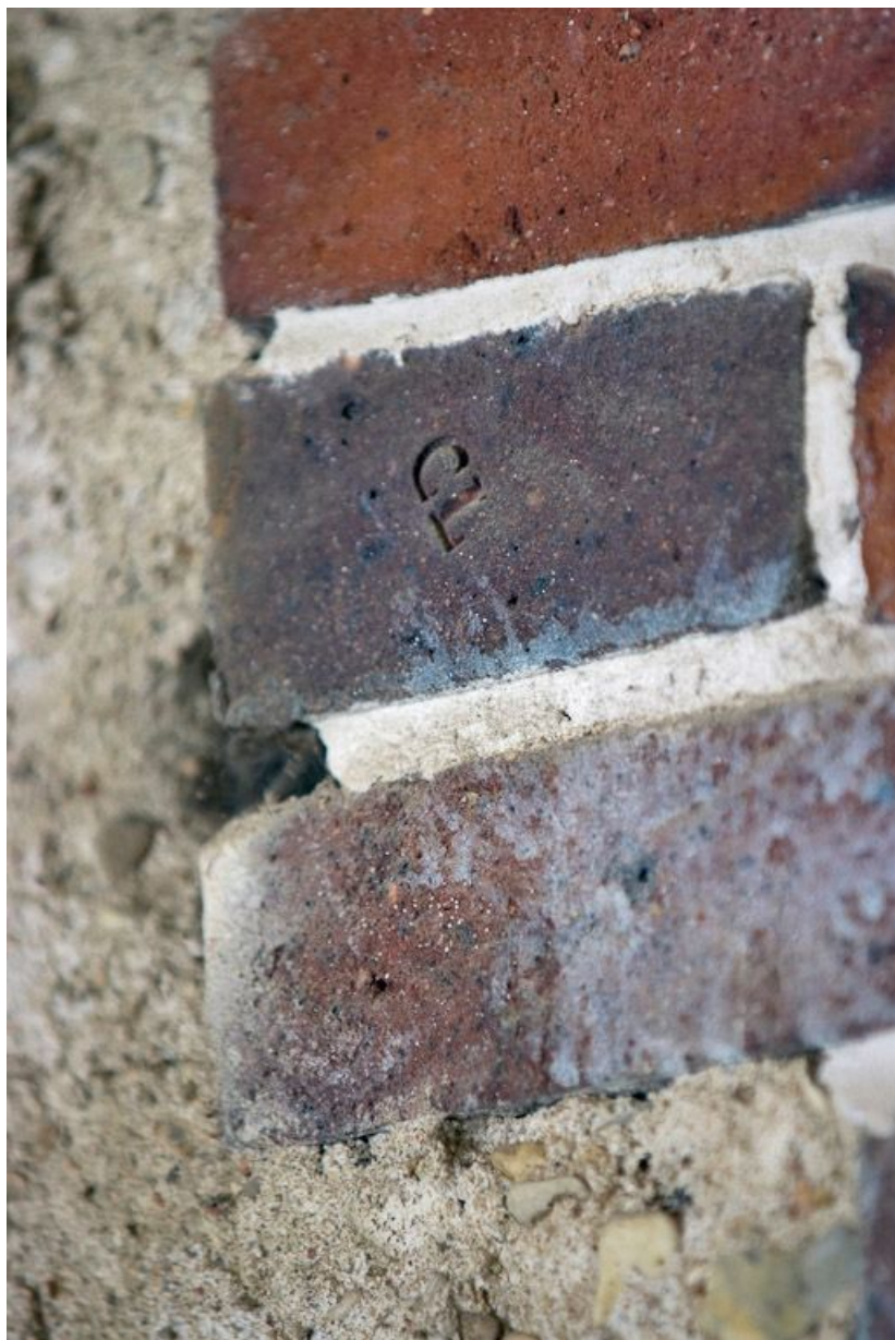
Détail de mise en oeuvre : brique avec marque CL (2e bâtiment gauche).

89, Saint-Julien-du-Sault Chemin rural de la Ferme de la Maladrerie à Charmoy, lieudit : la Maladrerie