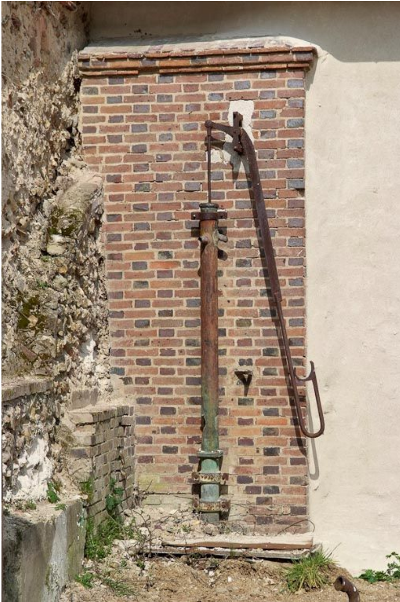
Pompe à bras, à côté du portail d'entrée.

89, Saint-Julien-du-Sault Chemin rural de la Ferme de la Maladrerie à Charmoy, lieudit : la Maladrerie