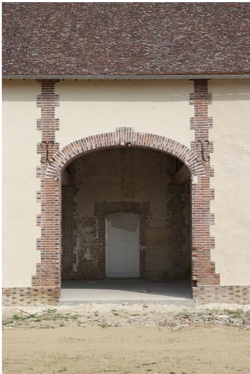
Bâtiment avec appentis à gauche dans la cour, porte charretière.

89, Saint-Julien-du-Sault Chemin rural de la Ferme de la Maladrerie à Charmoy, lieudit : la Maladrerie