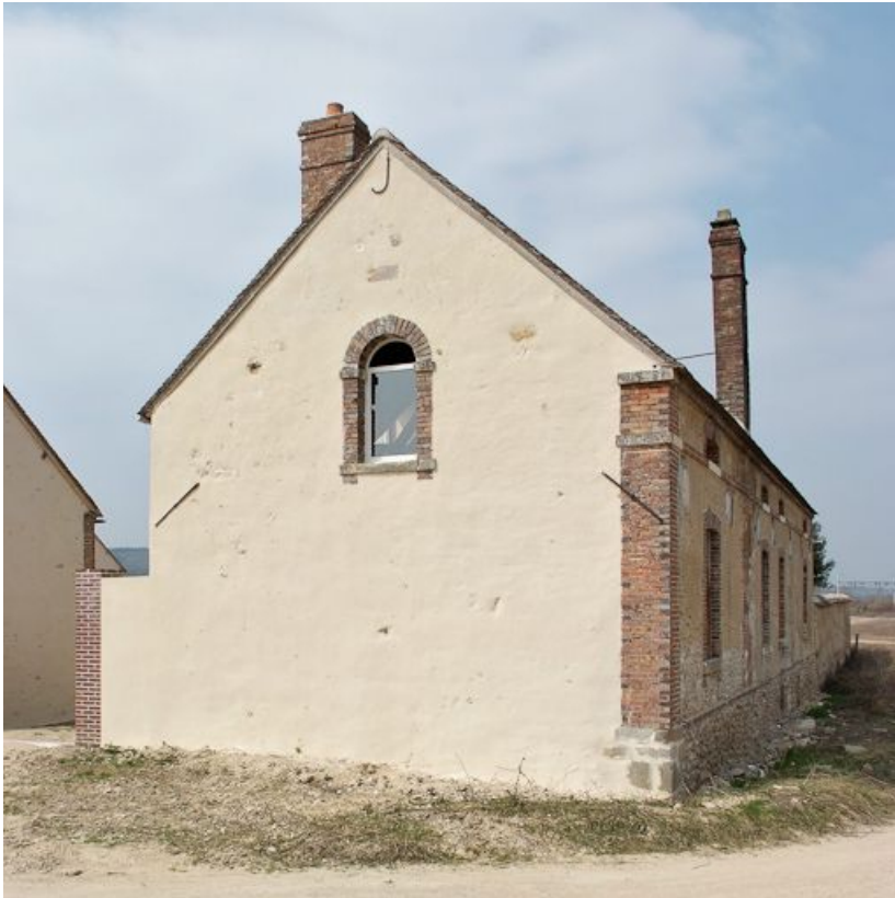
Mur-pignon et façade postérieure du bâtiment à droite en entrant.

89, Saint-Julien-du-Sault Chemin rural de la Ferme de la Maladrerie à Charmoy, lieudit : la Maladrerie