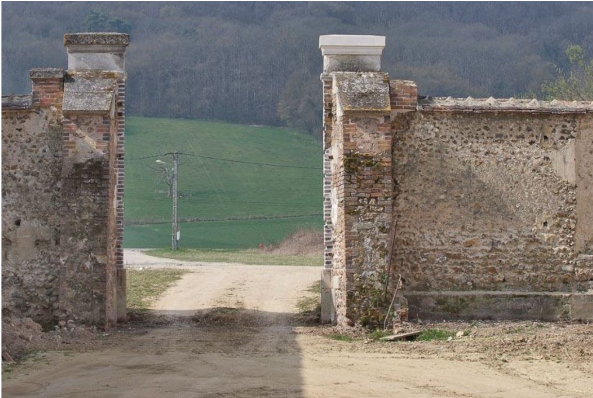
Portail, vue de l'intérieur de la cour.

89, Saint-Julien-du-Sault Chemin rural de la Ferme de la Maladrerie à Charmoy, lieudit : la Maladrerie