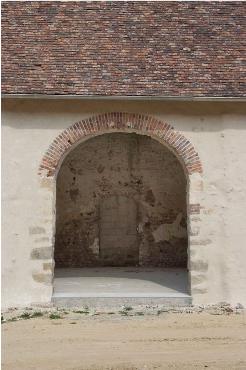
Porte charretière du 1er bâtiment à gauche en entrant dans la cour.

89, Saint-Julien-du-Sault Chemin rural de la Ferme de la Maladrerie à Charmoy, lieudit : la Maladrerie