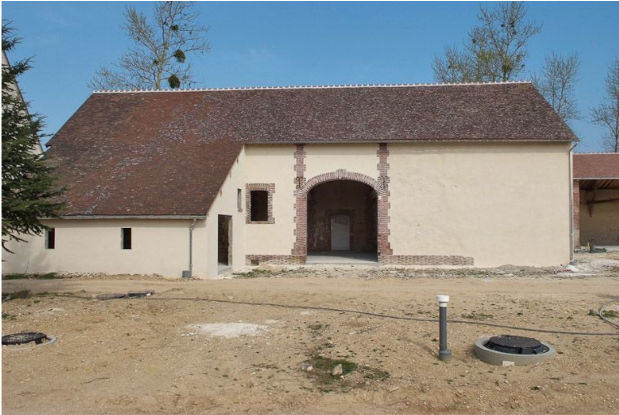
Bâtiment avec appentis à gauche dans la cour.

89, Saint-Julien-du-Sault Chemin rural de la Ferme de la Maladrerie à Charmoy, lieudit : la Maladrerie