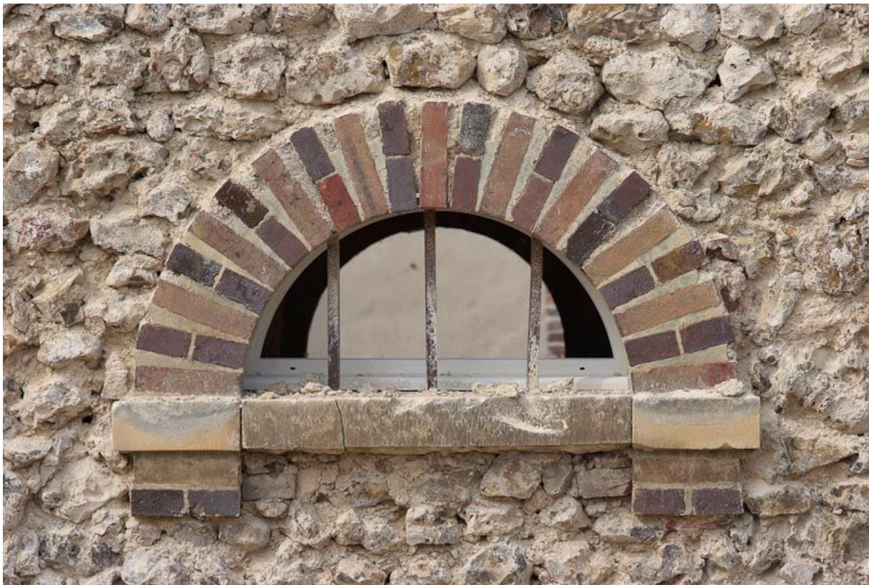
Baie semi-circulaire du mur-pignon du bâtiment à gauche du portail d'entrée.

89, Saint-Julien-du-Sault Chemin rural de la Ferme de la Maladrerie à Charmoy, lieudit : la Maladrerie