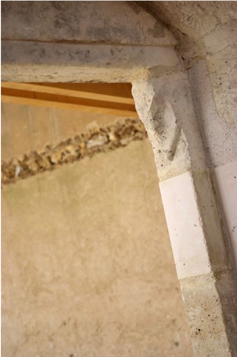
Détail du coussinet de l'ouverture dans le mur sud de la chapelle.

89, Saint-Julien-du-Sault Chemin rural de la Ferme de la Maladrerie à Charmoy, lieudit : la Maladrerie