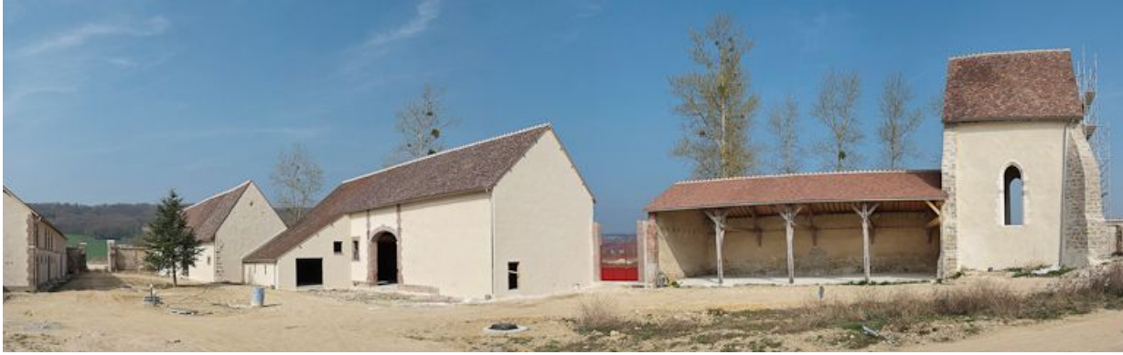
Vue d'ensemble des bâtiments à gauche de la cour.

89, Saint-Julien-du-Sault Chemin rural de la Ferme de la Maladrerie à Charmoy, lieudit : la Maladrerie