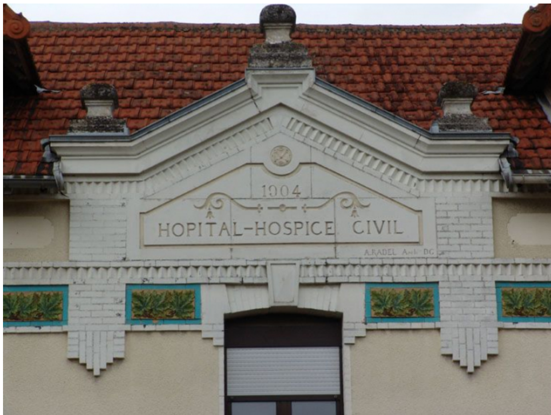
Bâtiment de l'administration, détail du fronton.

89, Brienon-sur-Armançon, 4 rue Marie-Noël