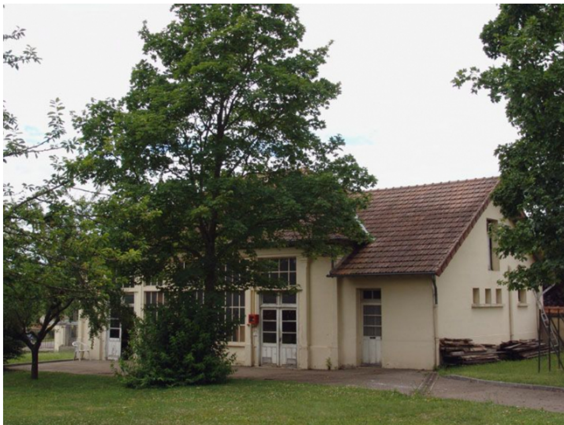
Le pavillon de la laverie, buanderie et désinfection.

89, Brienon-sur-Armançon, 4 rue Marie-Noël