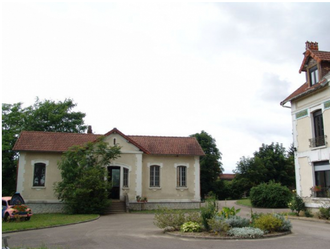
Pavillon des douches et des salles de bain.

89, Brienon-sur-Armançon, 4 rue Marie-Noël