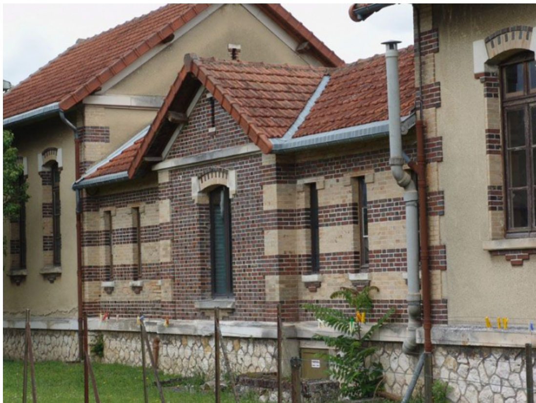
La galerie de liaison entre le pavillon des vieillards hommes et celui des femmes, élévation postérieure. 89, Brienon-sur-Armançon, 4 rue Marie-Noël