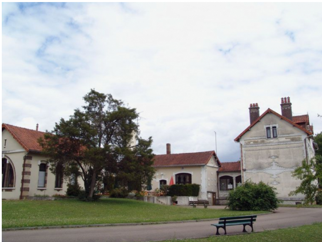
Vue d'ensemble prise de l'ouest.

89, Briennon-sur-Armançon, 4 rue Marie-Noël