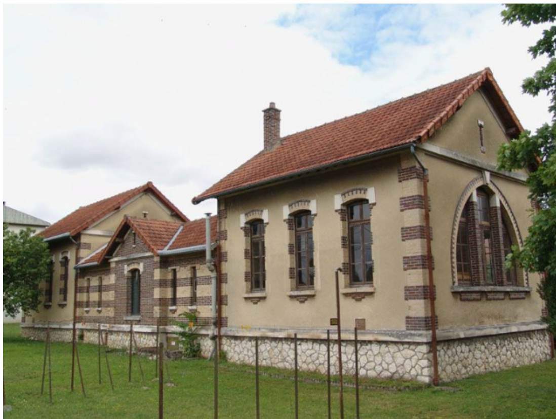
Le pavillon des vieillards hommes, le pavillon des vieillards femmes et la galerie de liaison, élévations postérieures. 89, Briennon-sur-Armançon, 4 rue Marie-Noël