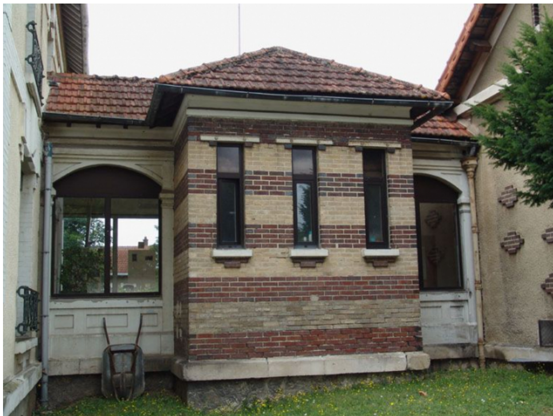
Galerie de liaison entre le bâtiment de l'administration et ceux des cuisines et des réfectoires, vue extérieure. 89, Brienon-sur-Armançon, 4 rue Marie-Noël