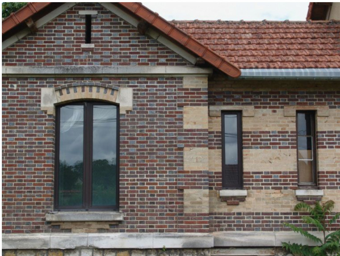
La galerie de liaison entre le pavillon des vieillards hommes et celui des femmes, détail de l'élévation postérieure. 89, Brienon-sur-Armançon, 4 rue Marie-Noël