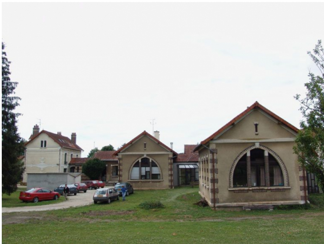
Vue générale prise de l'est : deux pavillons et le bâtiment de l'administration à l'arrière plan.

89, Brienon-sur-Armançon, 4 rue Marie-Noël