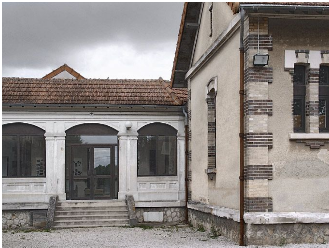
Galerie de liaison entre le bâtiment de l'administration et ceux des cuisines et des réfectoires, vue extérieure. 89, Brienon-sur-Armançon, 4 rue Marie-Noël