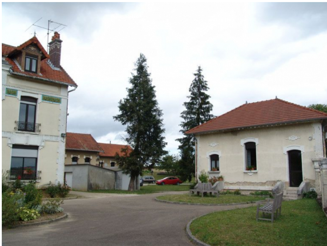
la conciergerie et le bâtiment de l'administration.

89, Briennon-sur-Armançon, 4 rue Marie-Noël