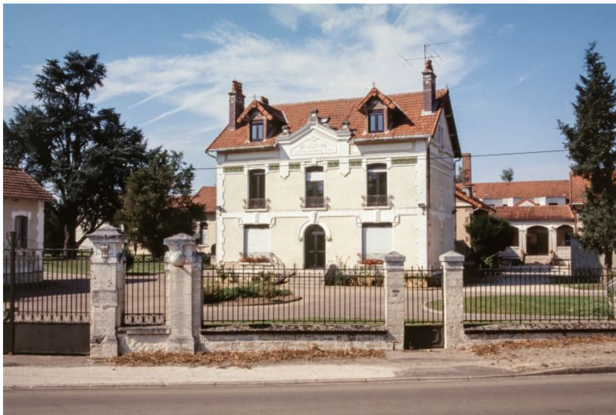
Bâtiment de l'administration, vue prise de la rue.

89, Brienon-sur-Armançon, 4 rue Marie-Noël