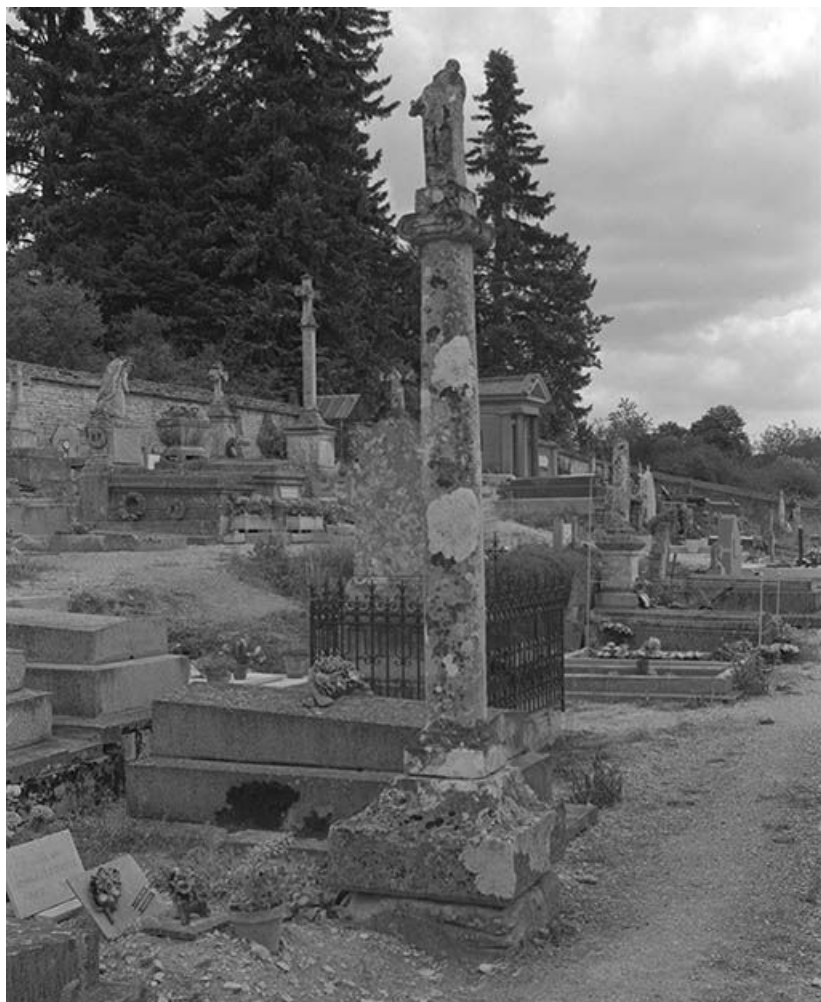
Croix de cimetière.