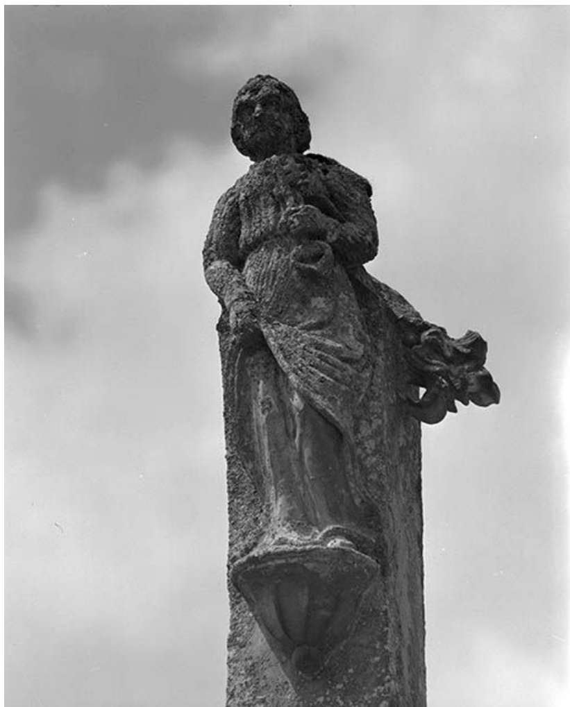
Croix de cimetière : statue au sommet de la croix.