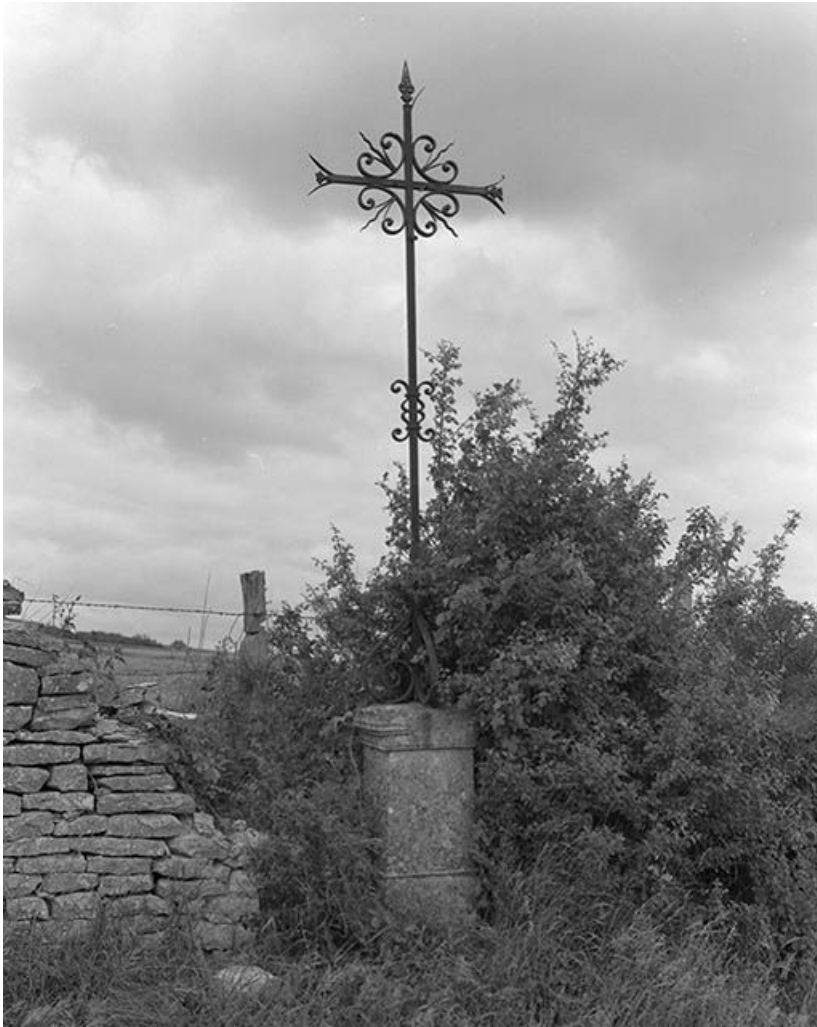
Croix de chemin, dite croix Saint-Marc.

89, Villiers-les-Hauts, lieudit : Come du Four