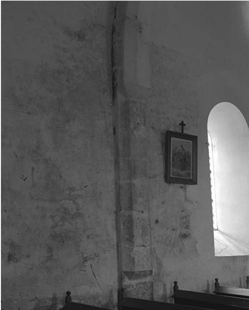
Base d'un doubleau (?)