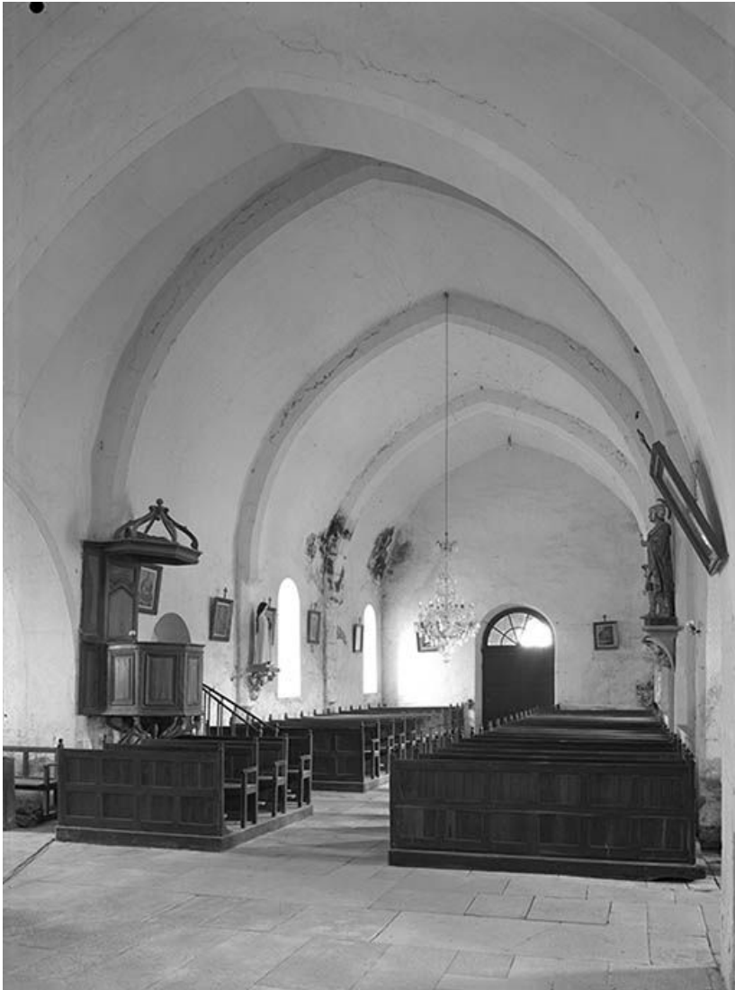
Vue est-ouest de la nef, chaire à prêcher et voûte d'ogives.