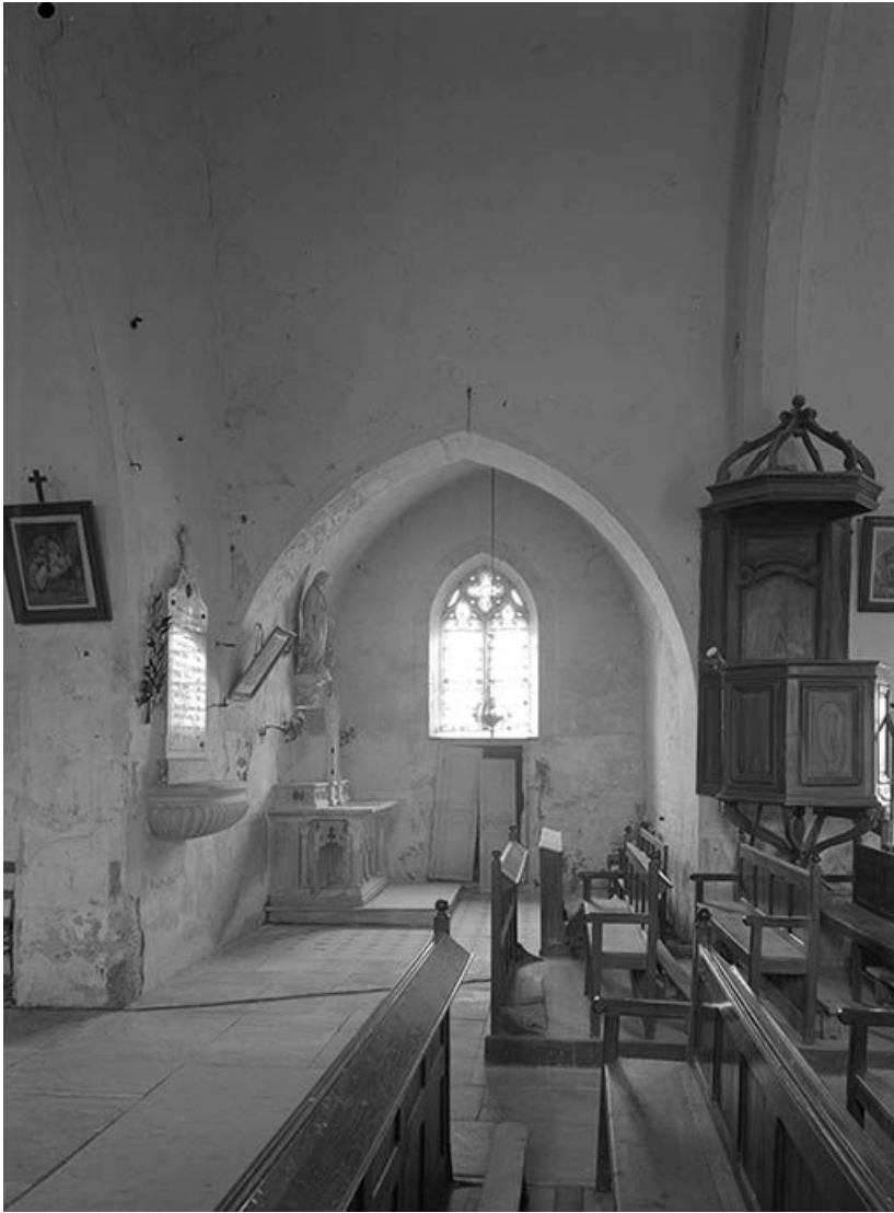
Chapelle latérale et chaire à prêcher.