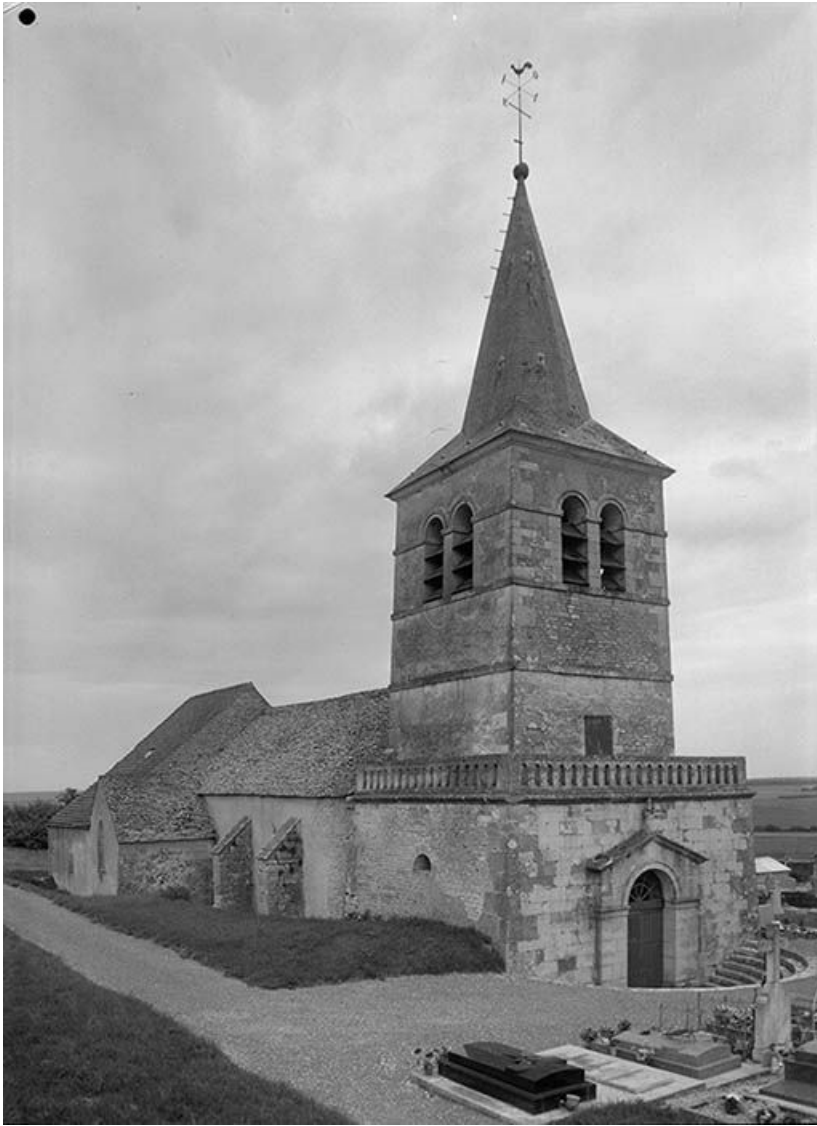
Façade occidentale avec clocher-porche.