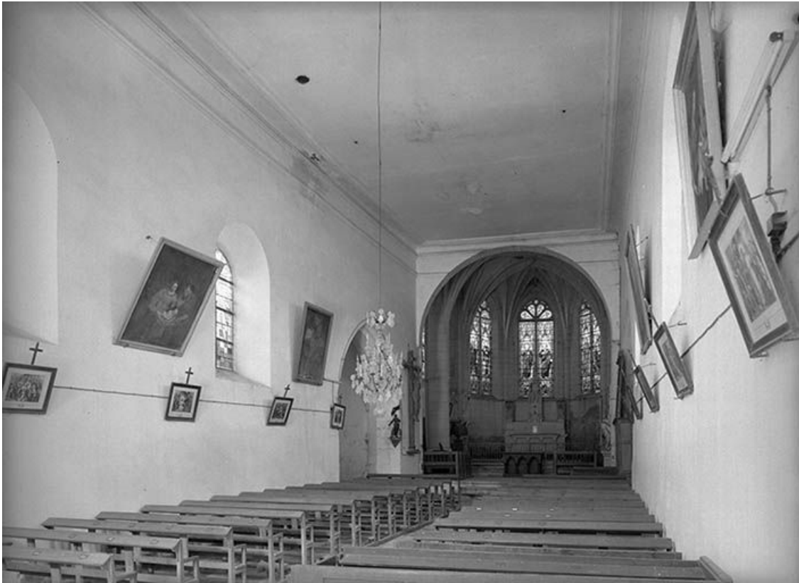
Vue intérieure vers le chœur.