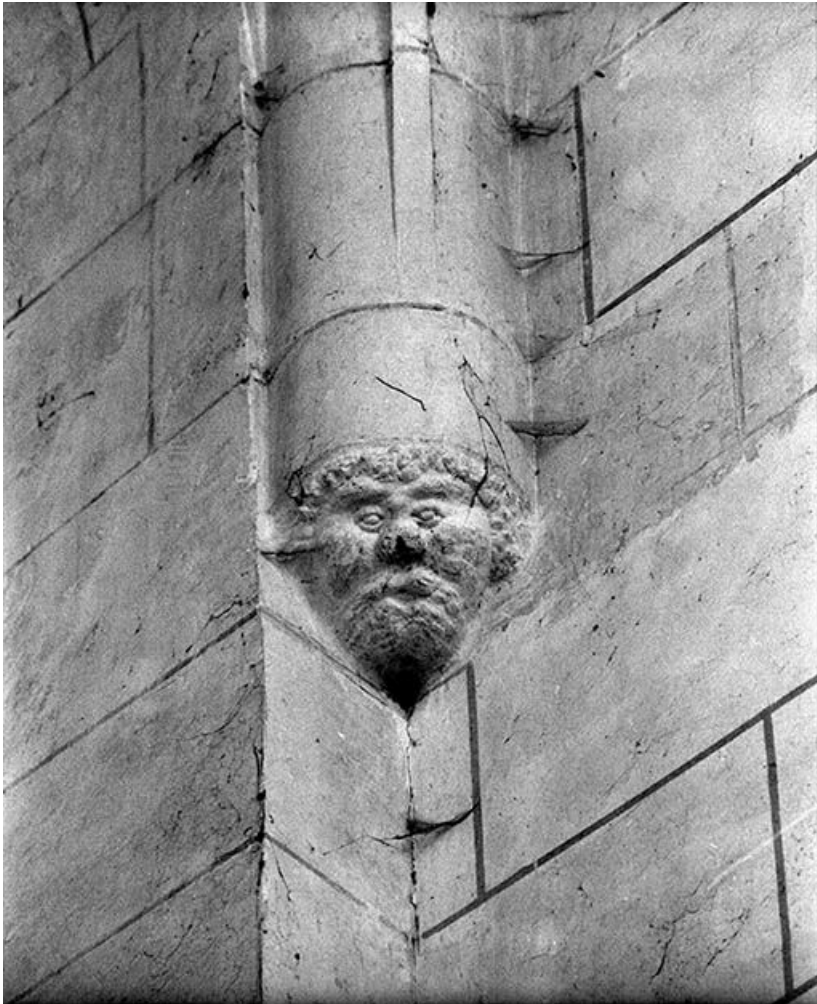
Culot décoré d'une tête en relief.