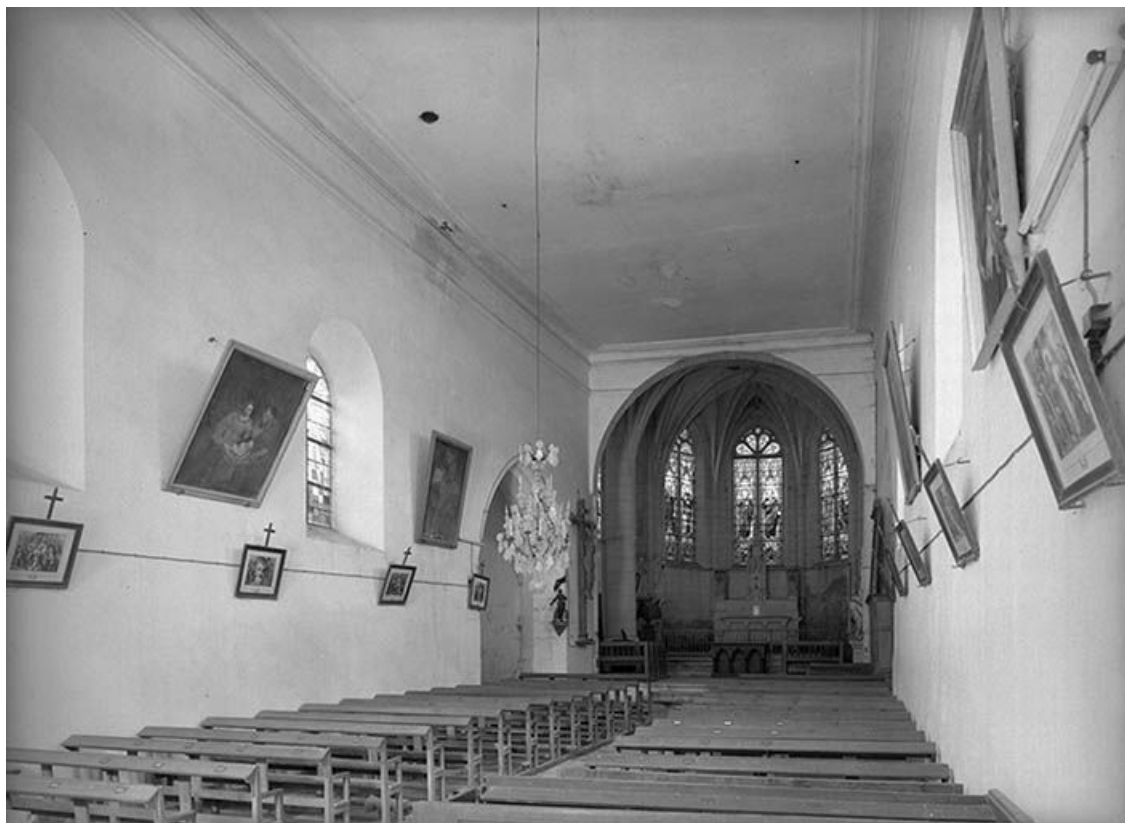
Vue intérieure vers le chœur.