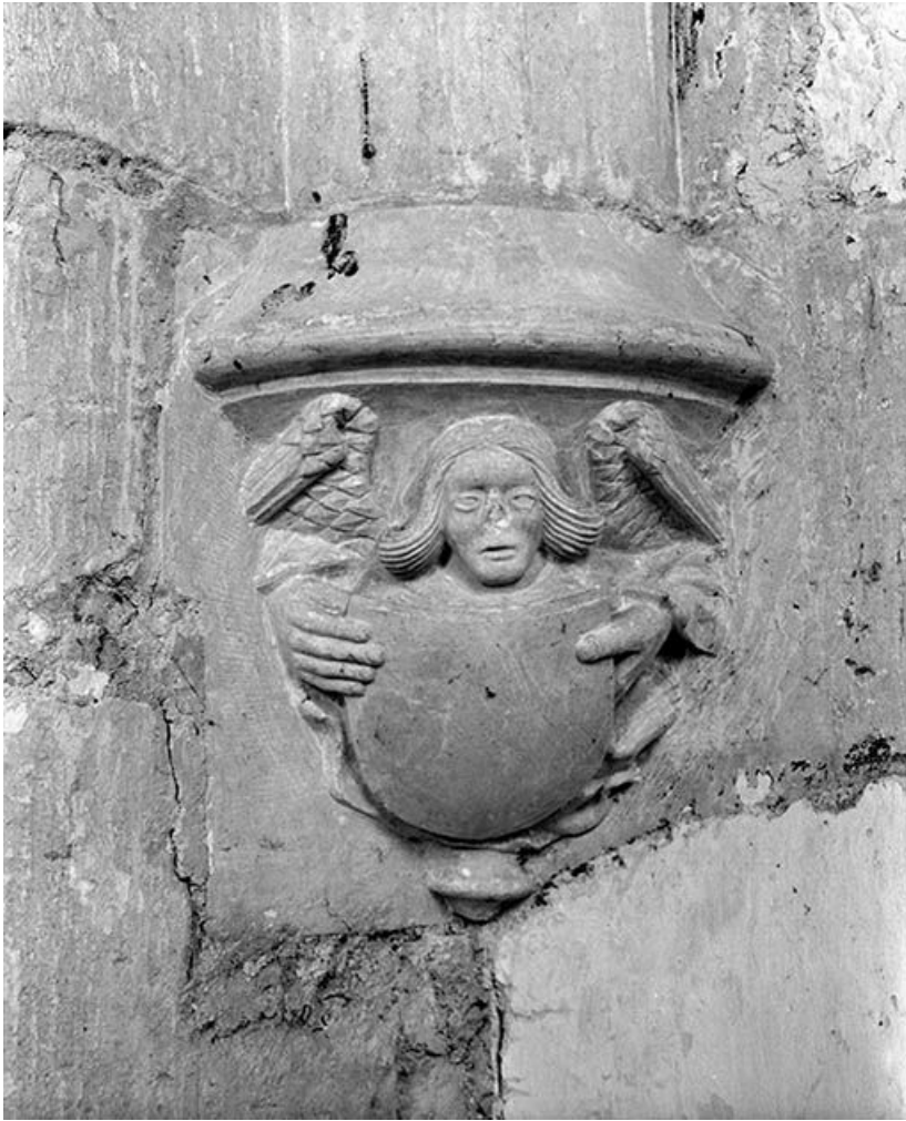
Culot décoré d'un ange porte-blason en relief.