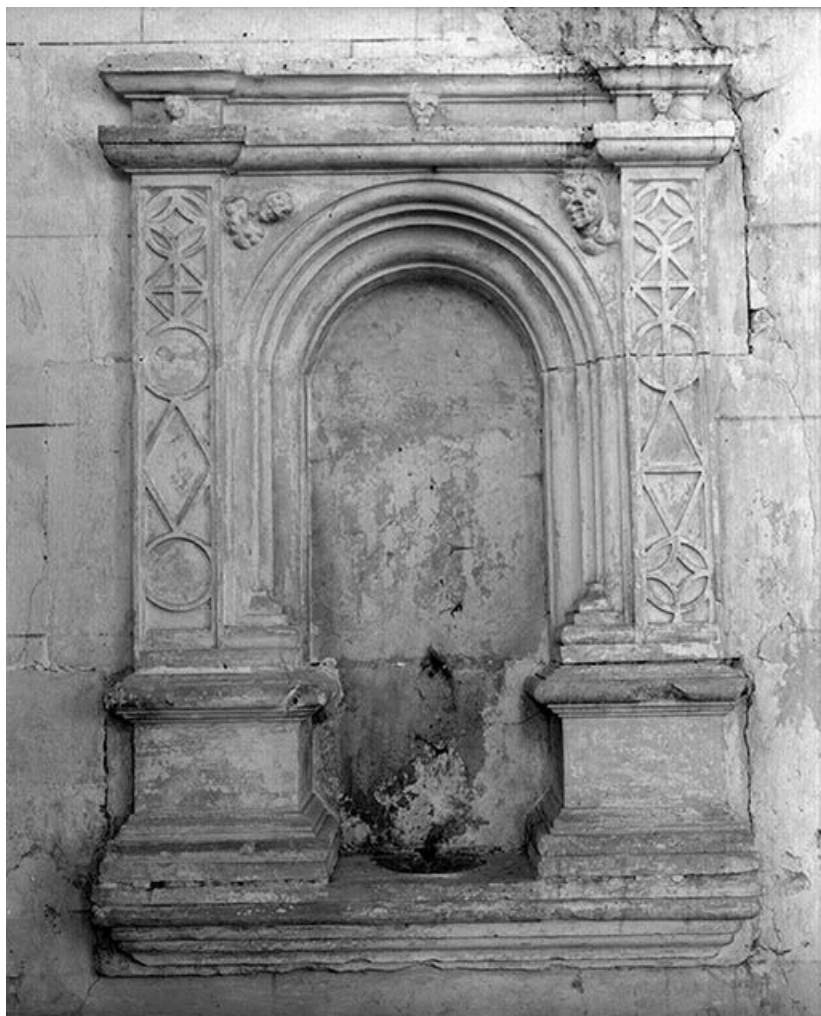
Collatéral droit, 2e travée. Lavabo encastré dans le mur droit. 89, Stigny Grande-Rue