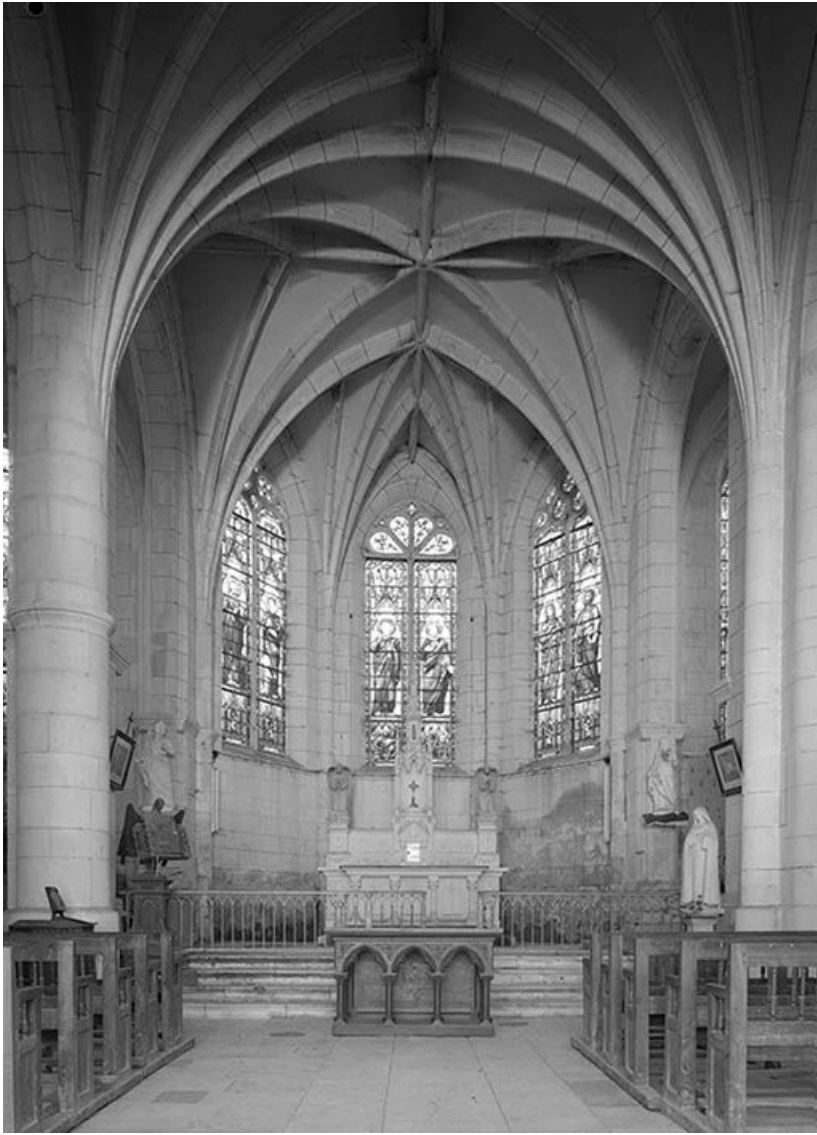
Choeur. Voûte d'ogives.