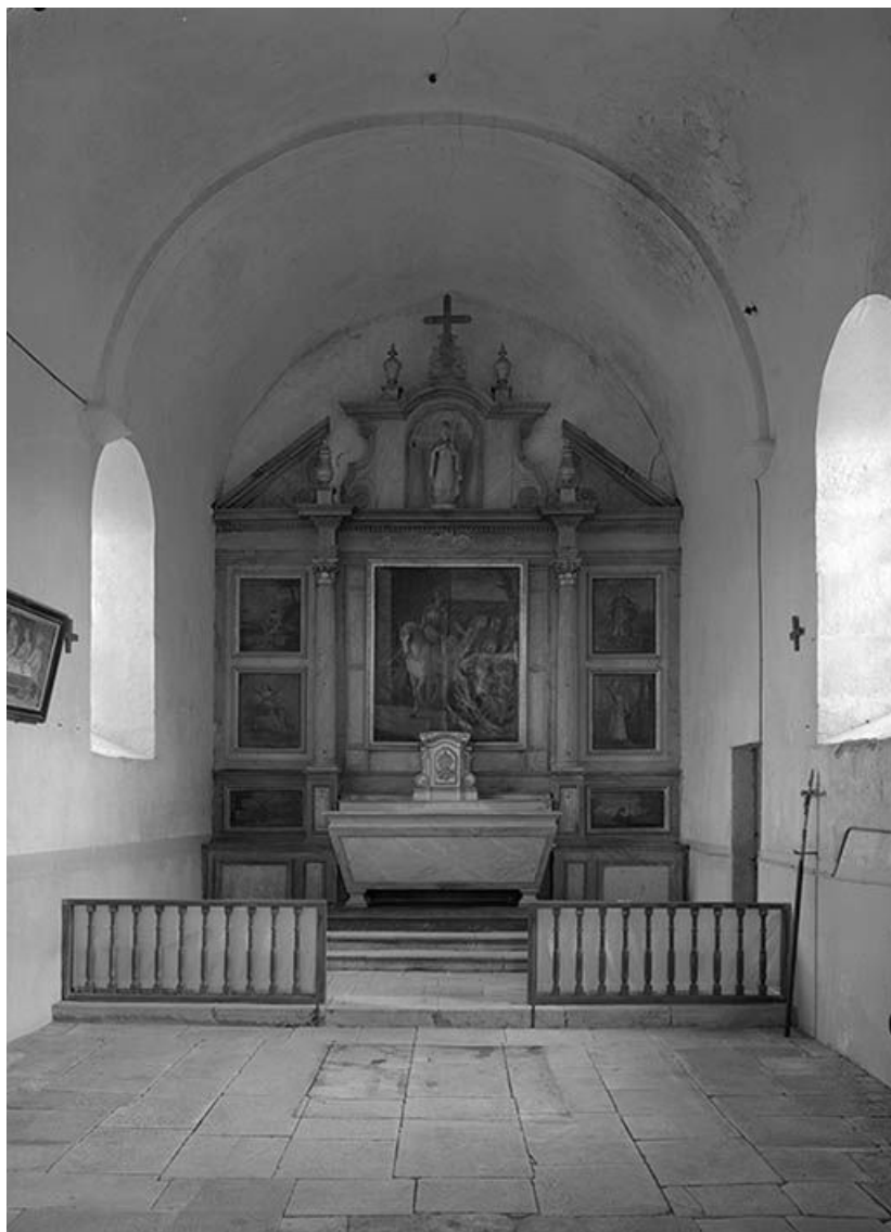
Vue intérieure. Choeur liturgique avec autel et retable.