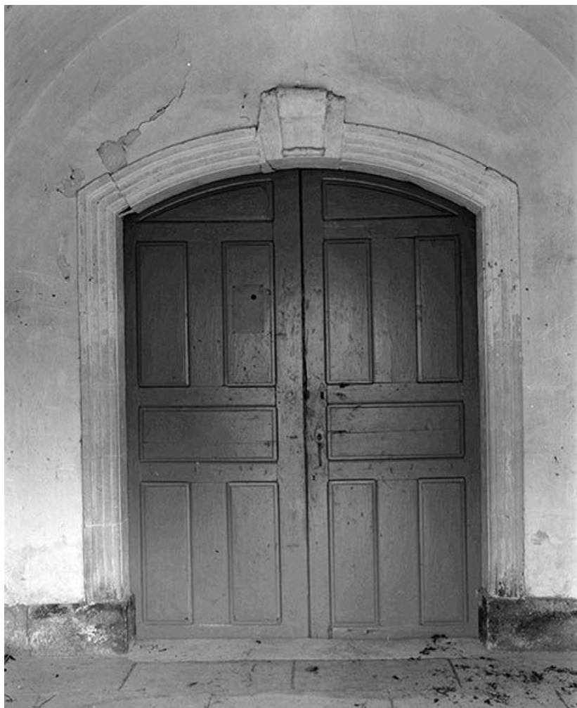
Porte en arc segmentaire.