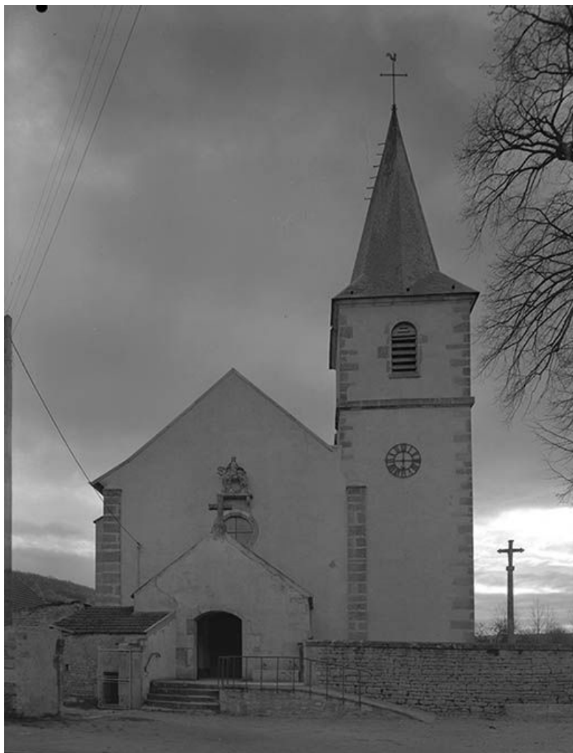
Façade occidentale avec porche et clocher.