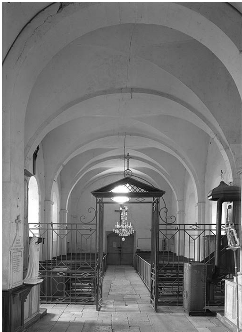
Vue intérieure prise depuis le chœur. Clôture liturgique et chaire à prêcher. 89, Perrigny-sur-Armançon