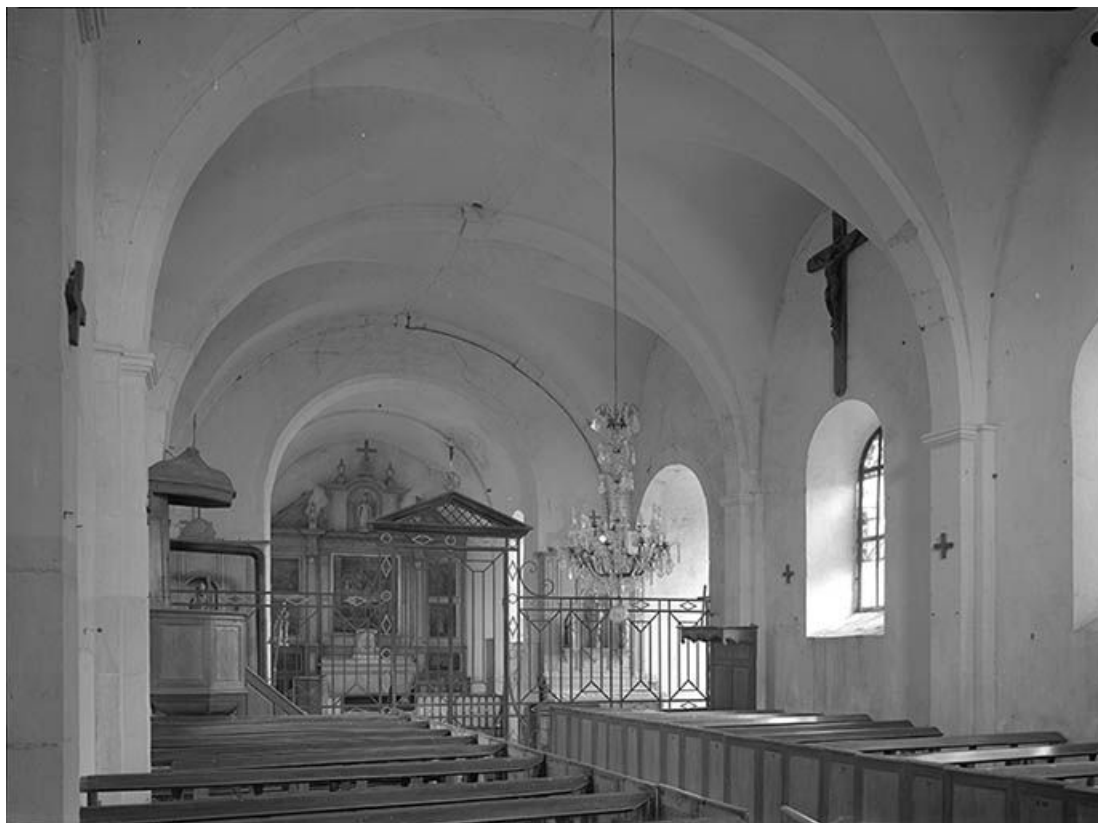
Vue intérieure vers le choeur. Clôture liturgique et chaire à prêcher. 89, Perrigny-sur-Armançon