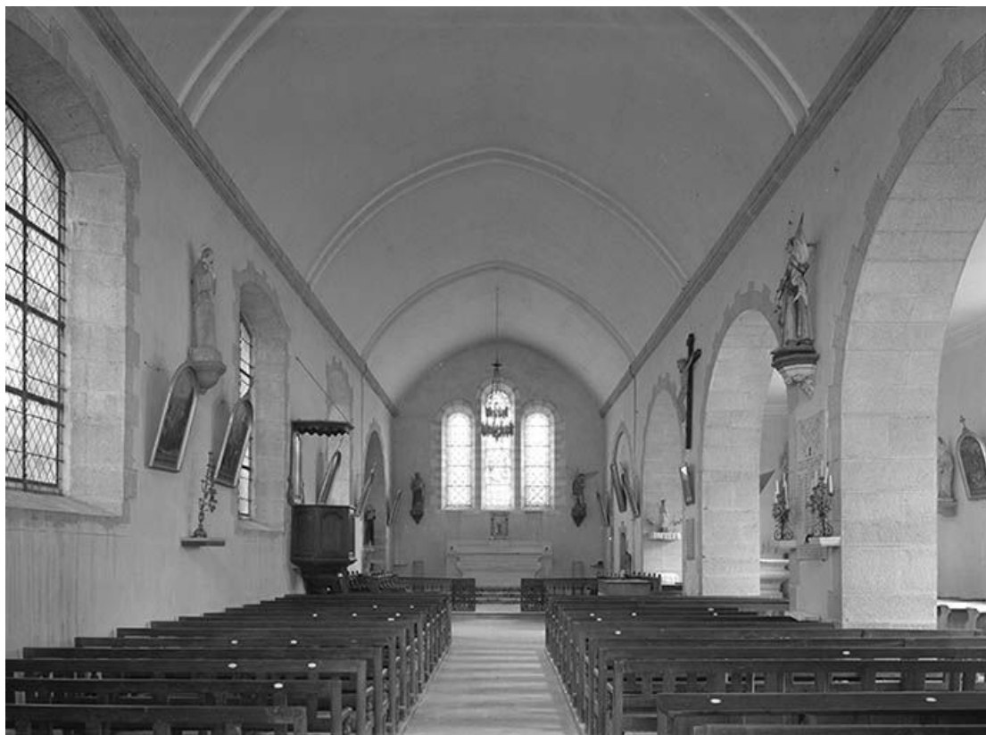
Vue intérieure vers le choeur.