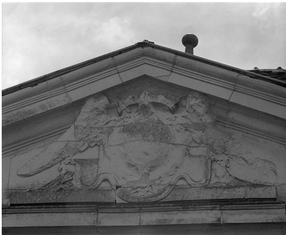
Façade antérieure. Fronton.