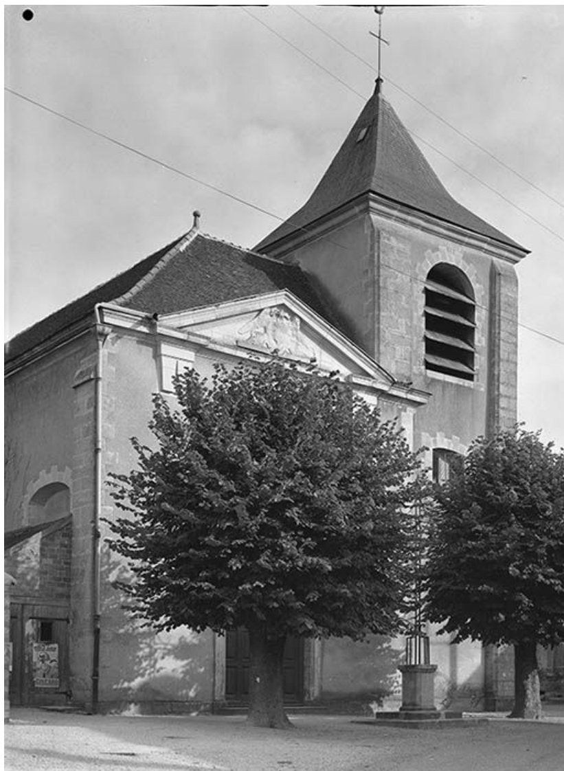
Façade occidentale avec clocher.