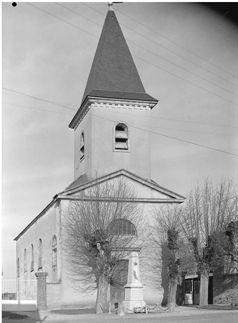
Façade occidentale à fronton triangulaire, avec clocher.