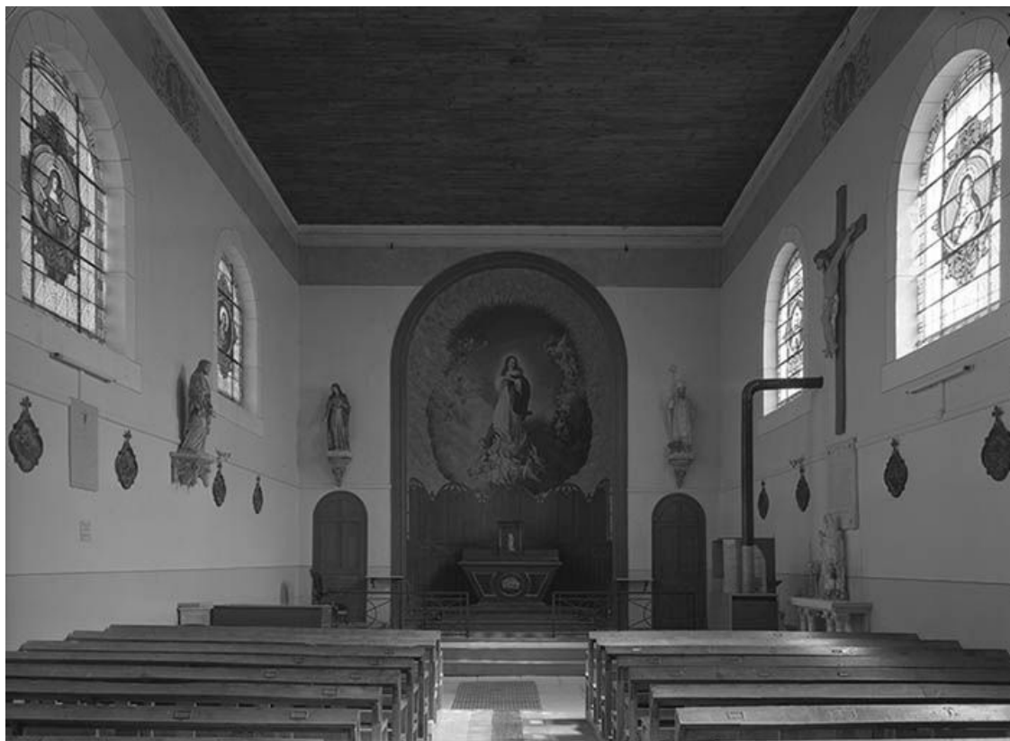
Vue intérieure vers le choeur. Mobilier et couvremet en lattes de bois naturel. Peinture monumentale. 89, Jully, lieudit : la Maine