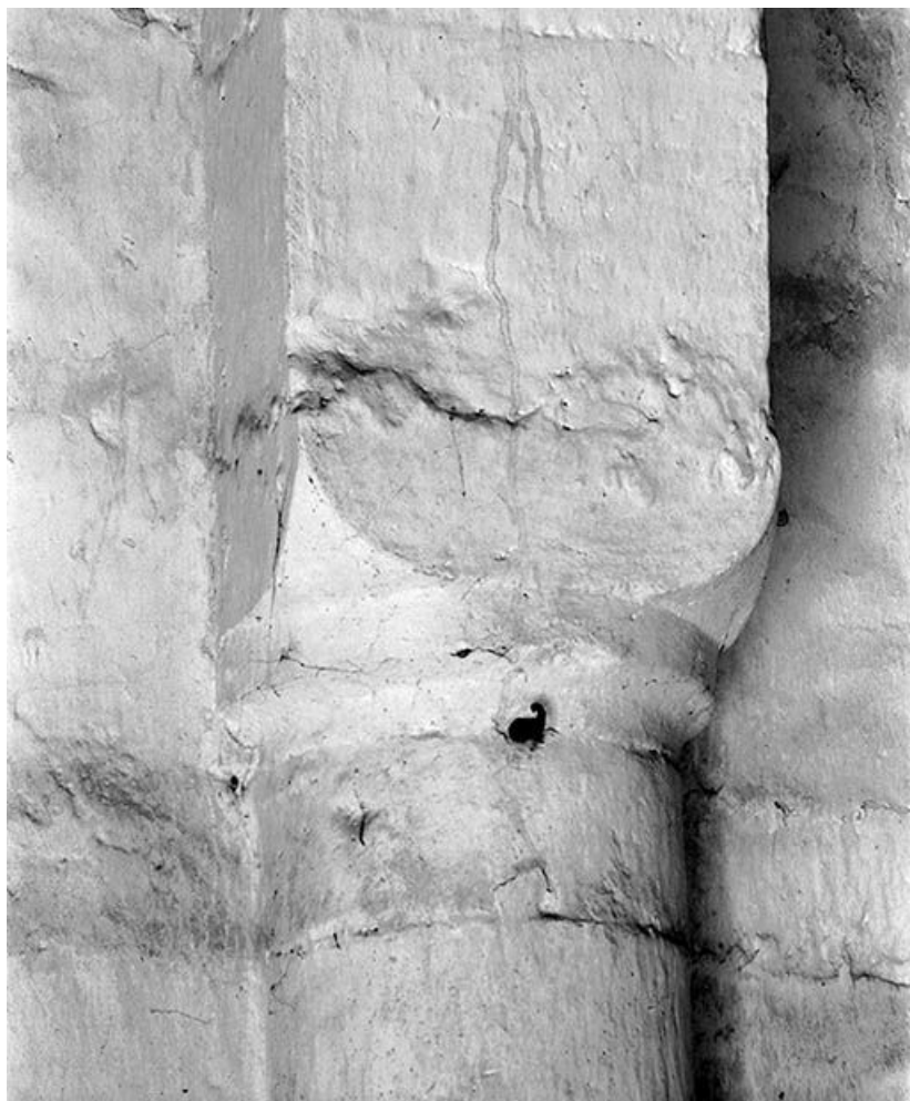
Colonne avec chapiteau.