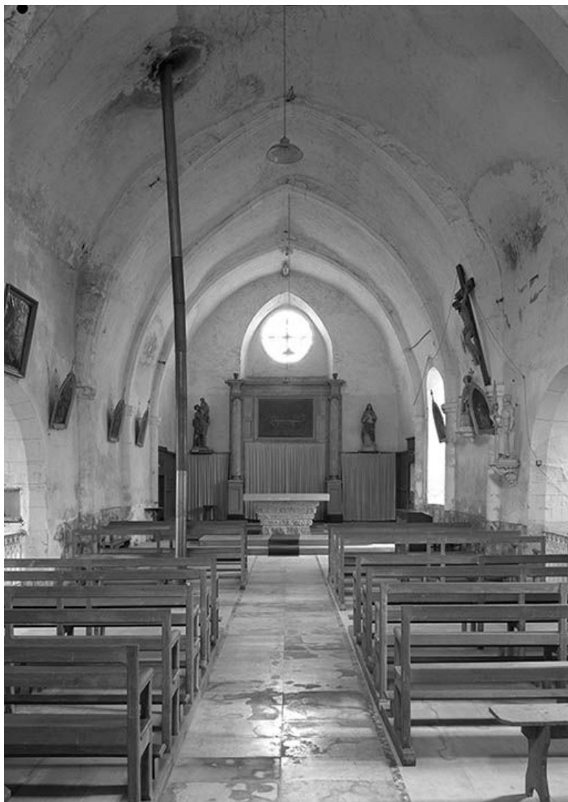
Vue intérieure vers le chœur.