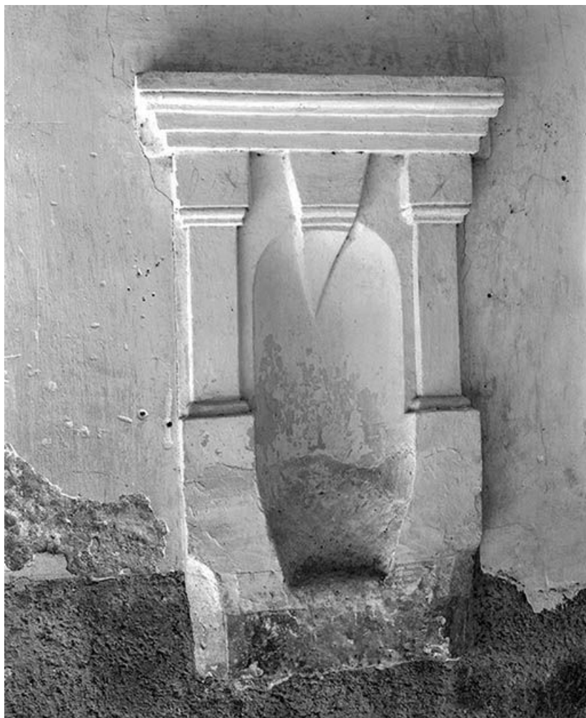
Niche avec décor d'architecture.