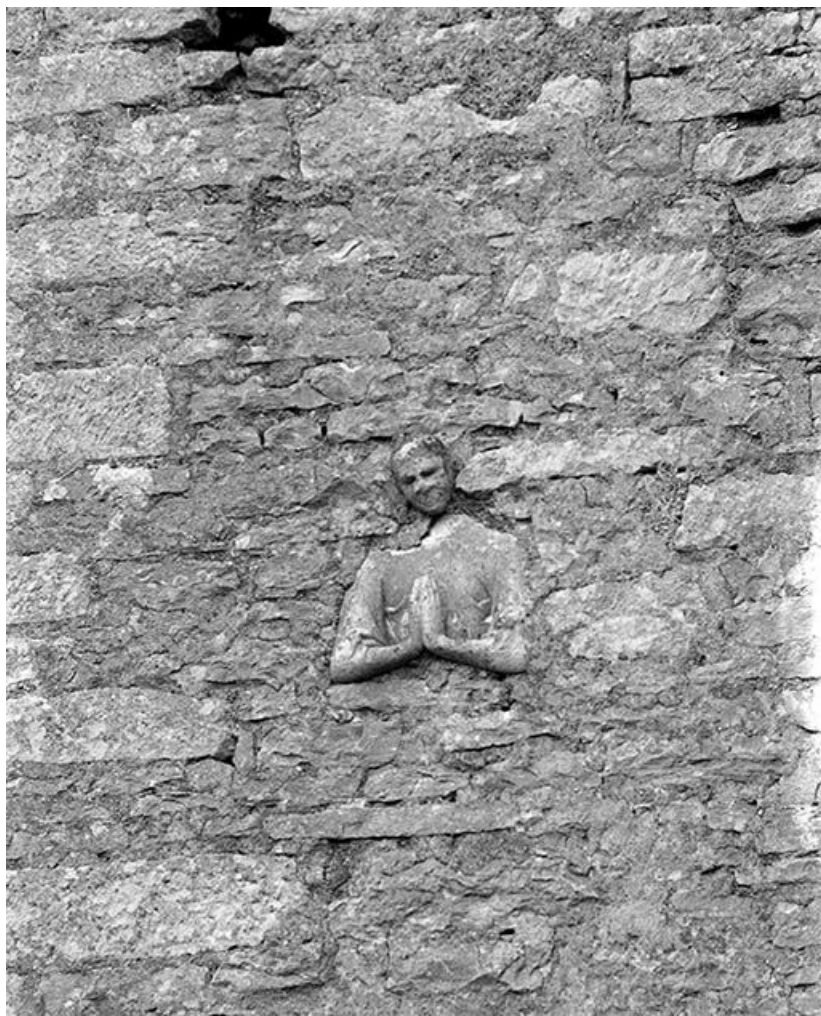
Face antérieure du clocher. Buste d'homme aux mains jointes.