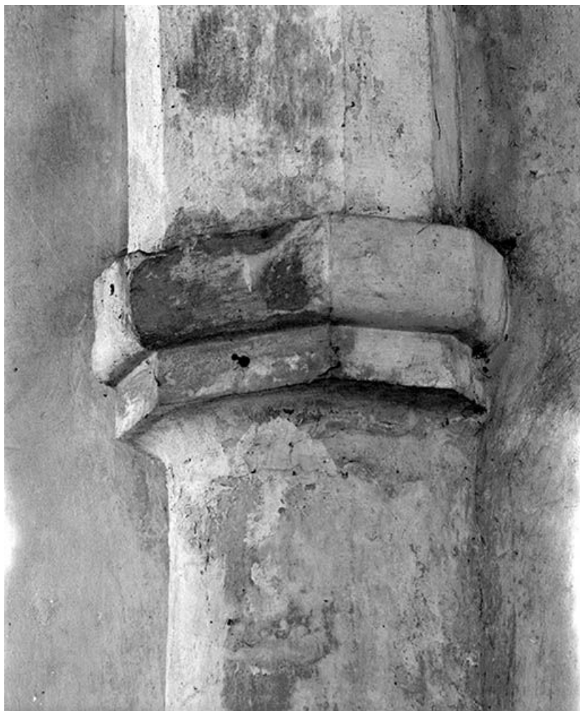
Colonne avec chapiteau.