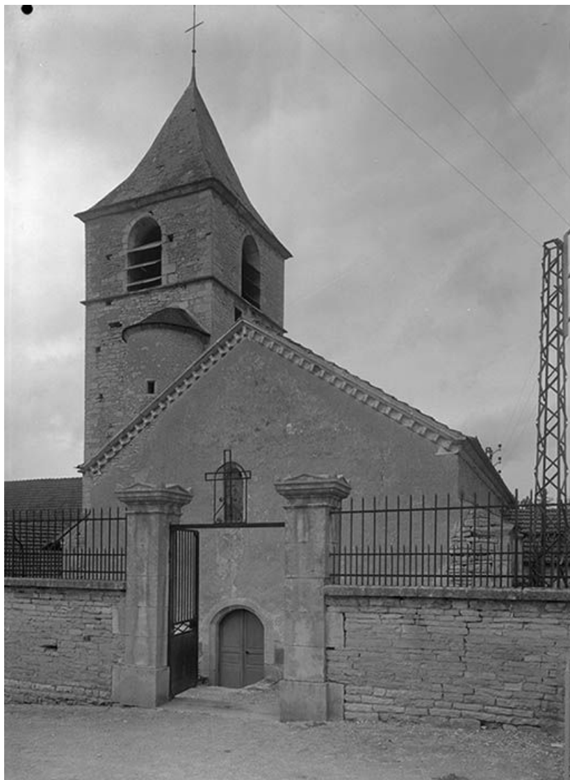
Façade occidentale avec clocher.