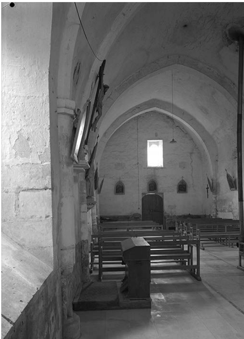
Vue est-ouest de la nef, avec voûte en berceau brisé et doubleaux.