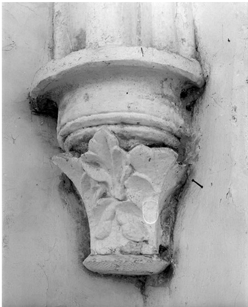
Chapiteau antérieur droit du choeur (décoré de larges feuilles imbriquées). 89, Argentenay Grande-Rue