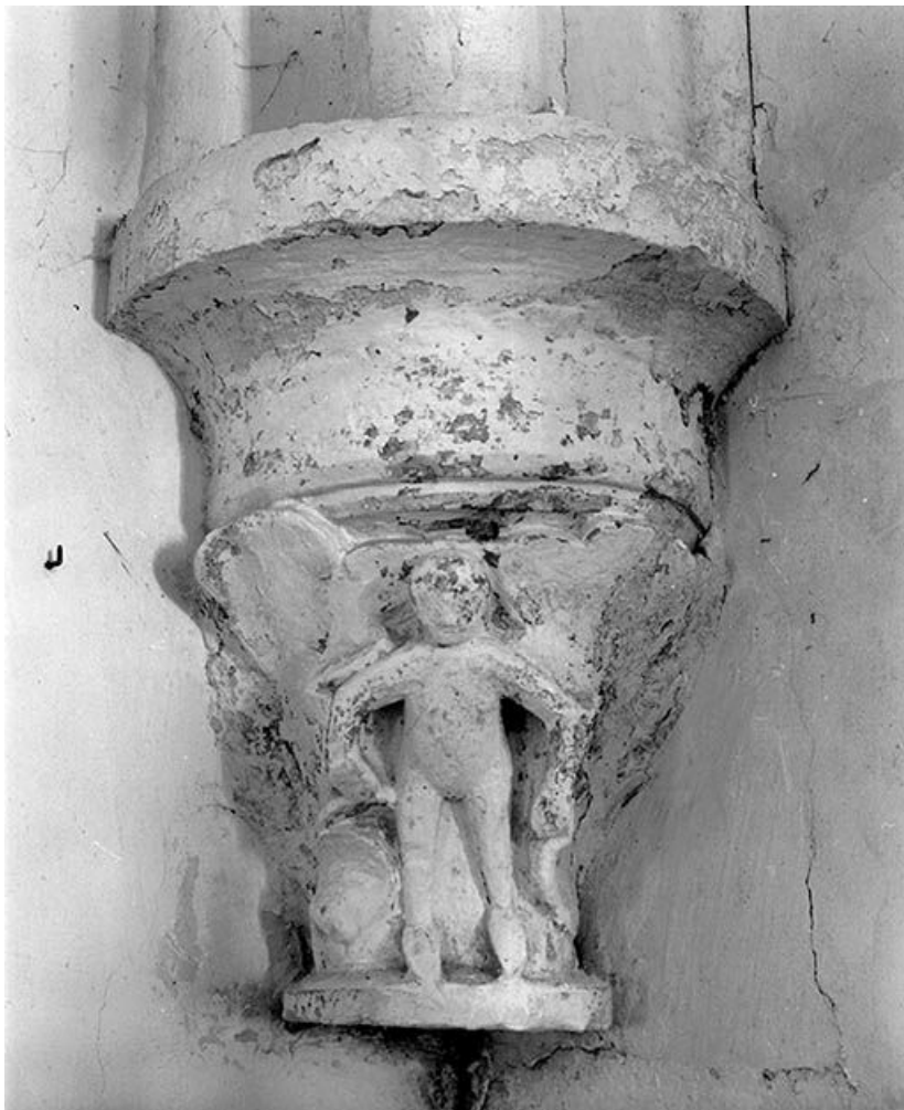
Chapiteau postérieur droit du choeur (décoré d'un enfant (?), entre deux grosses feuilles). 89, Argentenay Grande-Rue