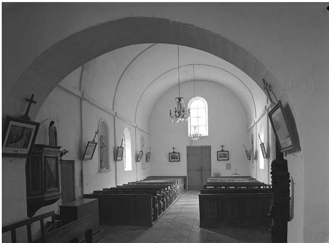
Vue intérieure prise depuis le chœur.