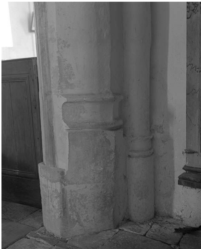
Détail : piédroit de l'arcade donnant accès à la chapelle latérale gauche. 89, Argentenay Grande-Rue