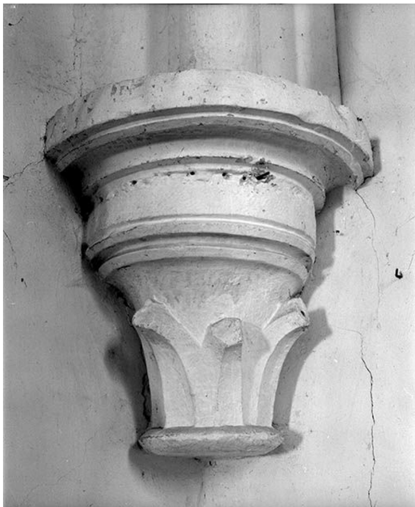
Détail : culot, angle postérieur gauche.