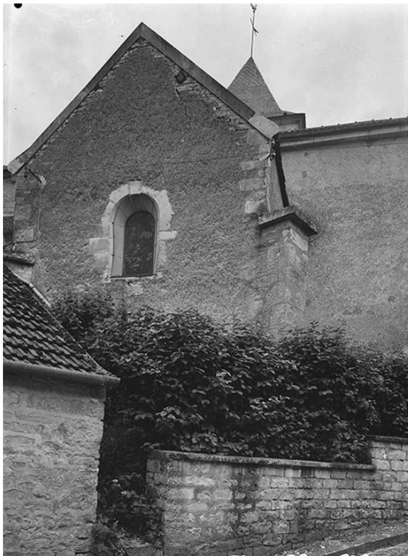
Façade du transept nord (?).