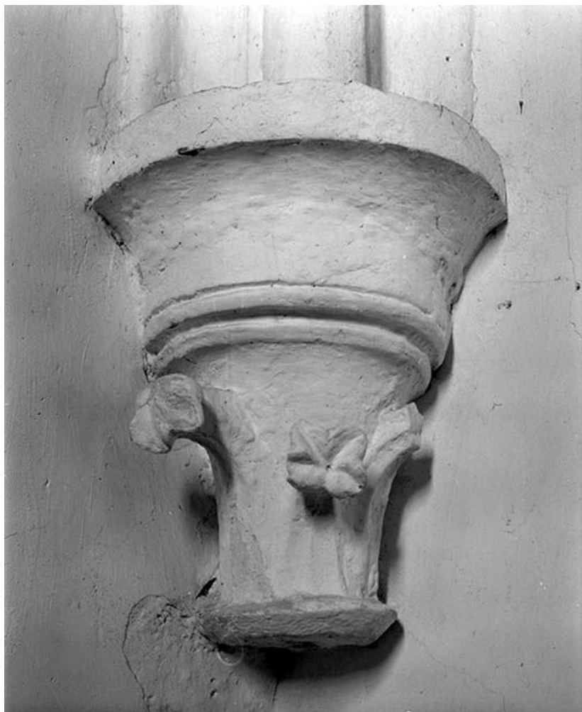
Détail : culot, angle antérieur gauche.