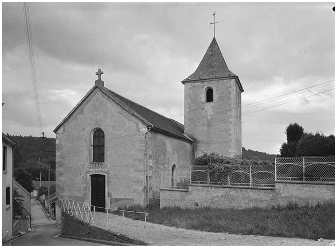
Façade occidentale avec clocher.