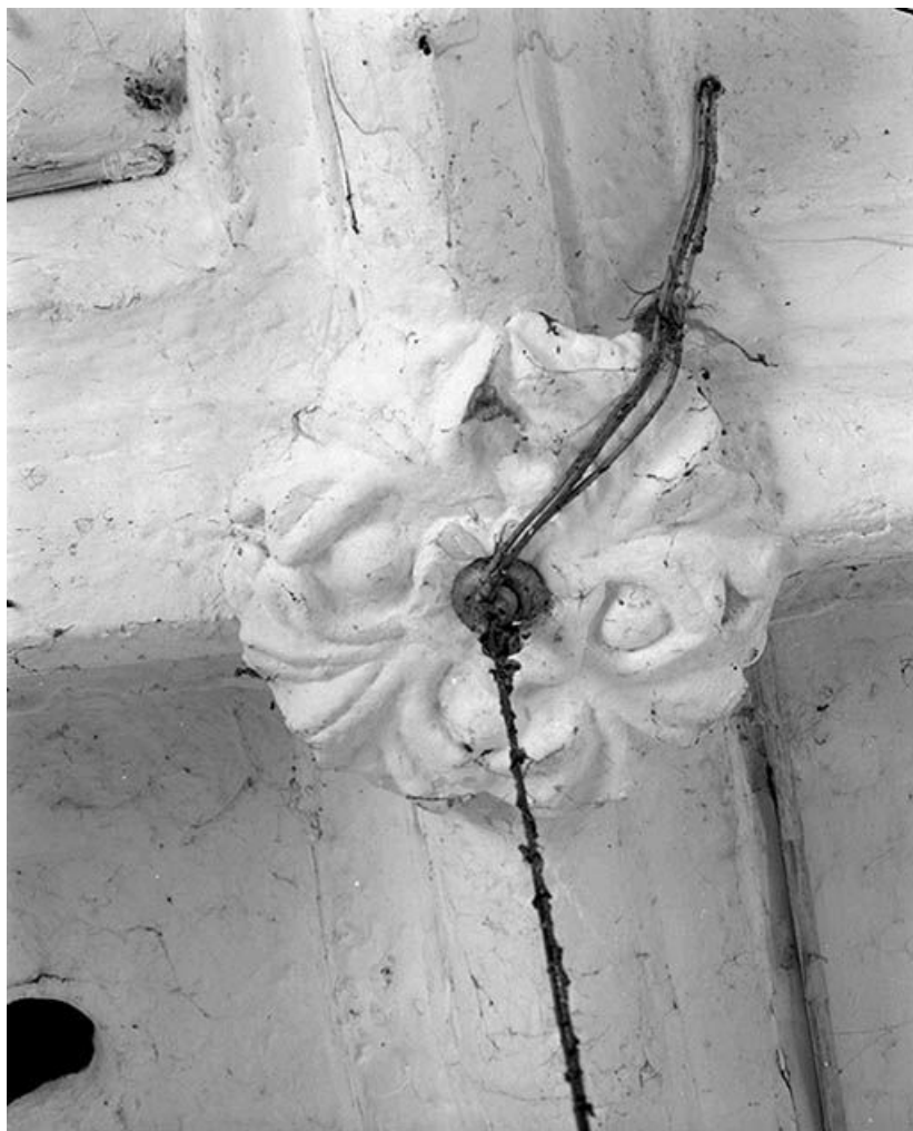
Détail : clef de voûte, dans le chœur.