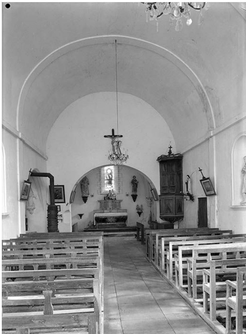
Vue intérieure vers le chœur.