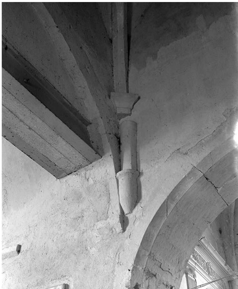
Détail d'une colonnette dans l'angle postérieur droit de la travée d'avant-choeur. 89, Ancy-le-Libre, lieudit : bief 87 du versant Yonne