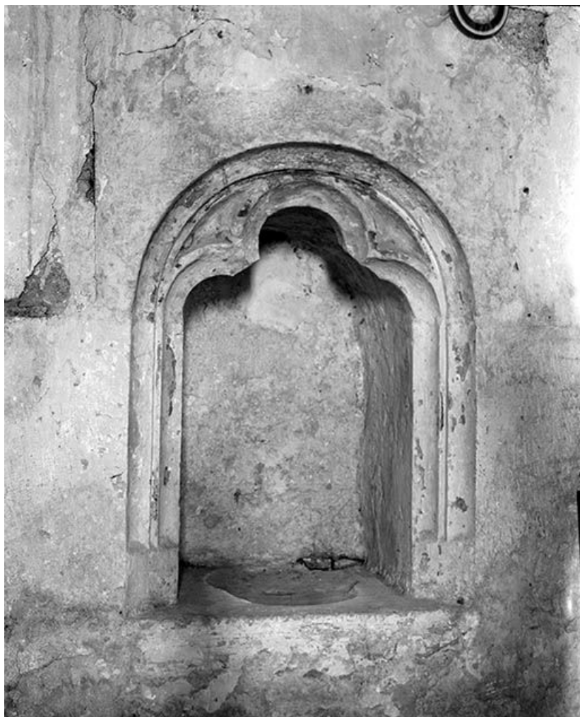
Lavabo dans la chapelle latérale droite.

89, Ancy-le-Libre, lieudit : bief 87 du versant Yonne