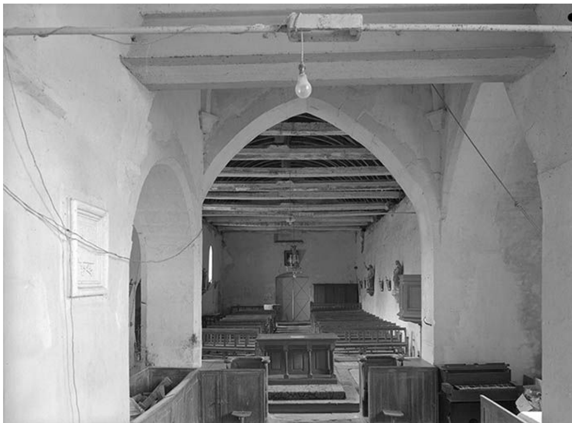
La nef vue depuis le chœur.

89, Ancy-le-Libre, lieudit : bief 87 du versant Yonne