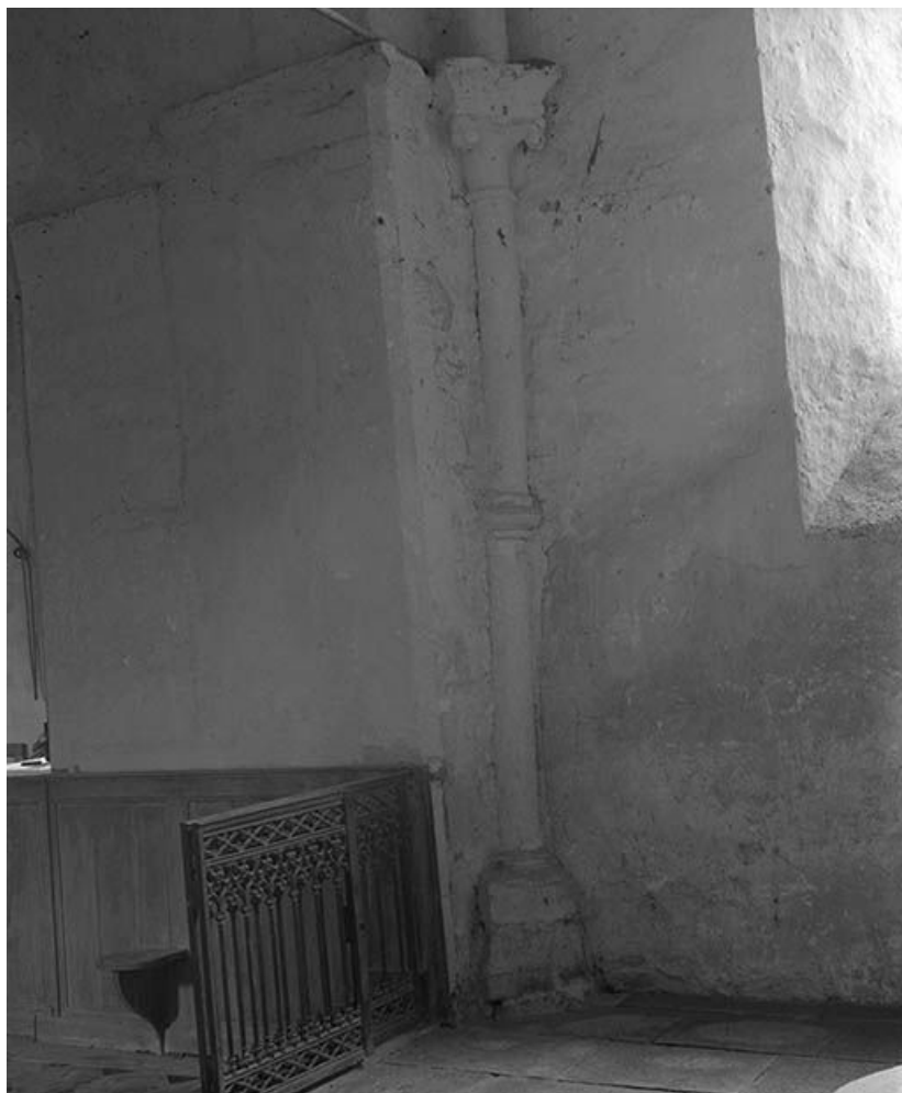
Détail d'une colonnette à l'angle antérieur gauche du choeur.

89, Ancy-le-Libre, lieudit : bief 87 du versant Yonne