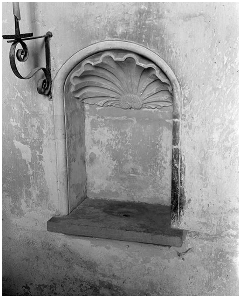
Lavabo dans le mur droit du chœur.

89, Ancy-le-Libre, lieudit : bief 87 du versant Yonne