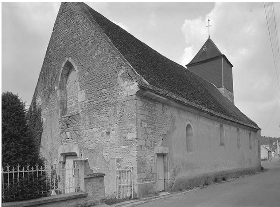
Façade antérieure et façade latérale droite.

89, Ancy-le-Libre, lieudit : bief 87 du versant Yonne