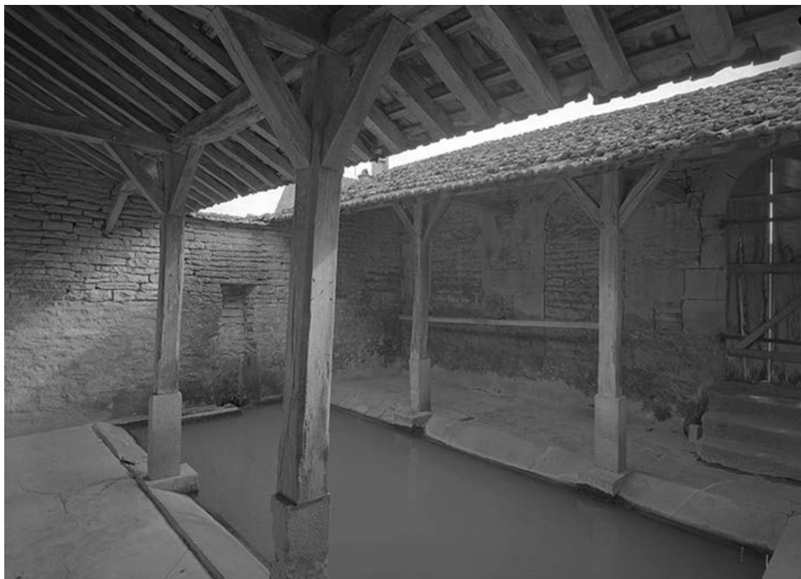
Vue intérieure. Bassin et charpente.