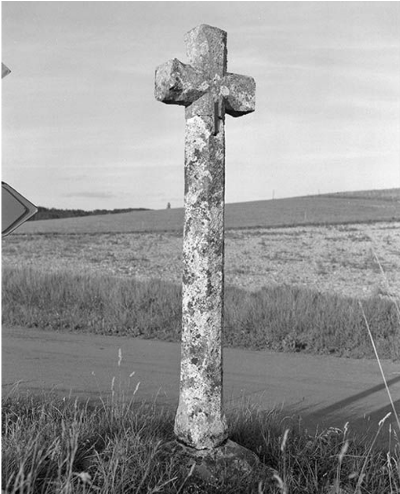
Croix de chemin, dite croix de Pierre. 89, Stigny C.D. 17