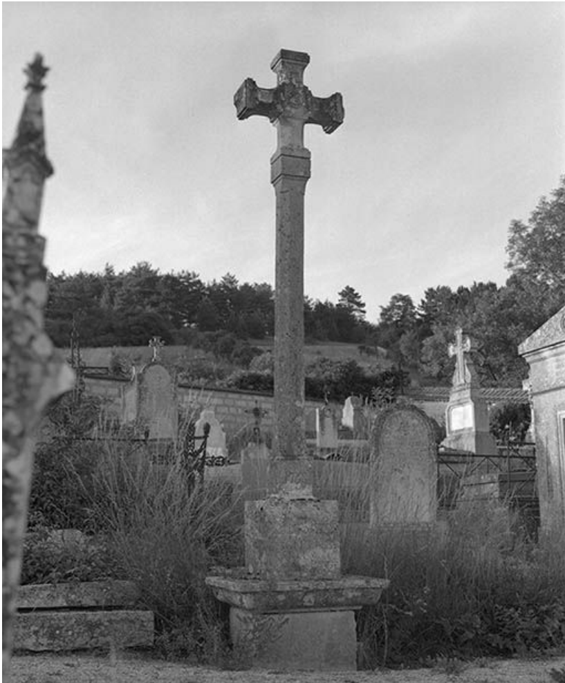
Croix de cimetière.