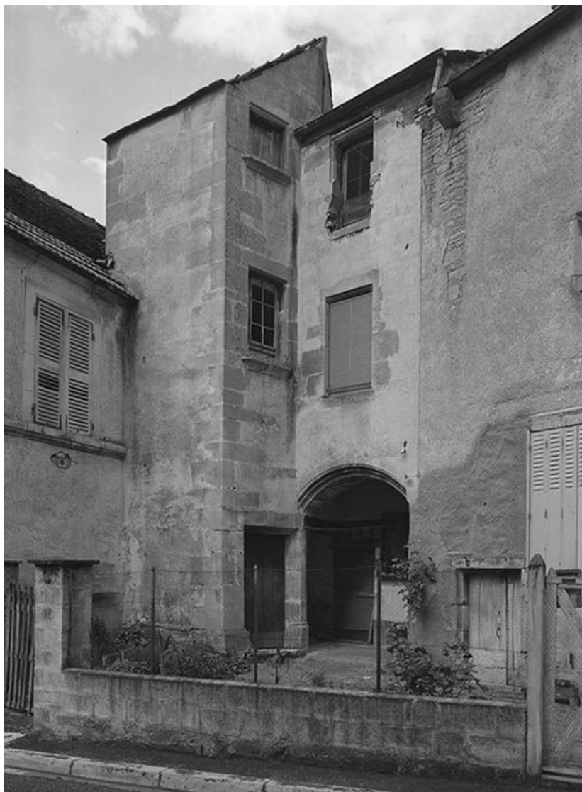
Maison et corps de passage. Façades sur rue.