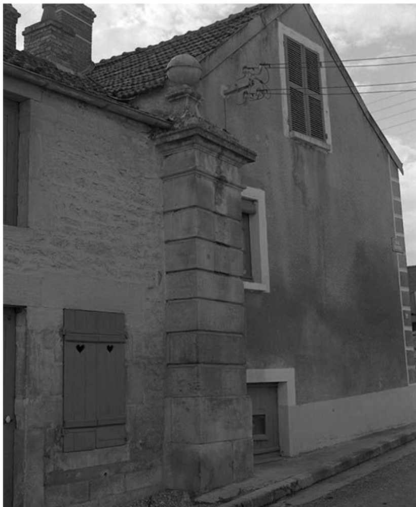
Pilier de l'ancienne porte de ville.